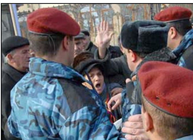
Scuffles and arguments between protesters and the police

Scuffles and arguments between protesters and the police followed.