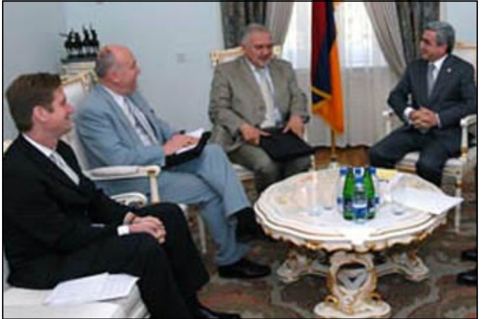
Տեսարան՝ Մինակի խումբի համանախագահներու եւ Սերժ Սարգսեանի միջեւ տեղի ունեցած հանդիպումին

Սերժ Սարգսեանի եւ տարածաշրջանային այցով Երեւանում գտնուող ԵԱՀԿ-ի նախագահների միջեւ Յունուար 20-ին կայացած հանդիպման ժամանակ ձեռք է բերուել պայմանաւորութիւններ առաջիկայում կազմակերպել Հայաստանի եւ Ադրբեջանի նախագահների հանդիպում: