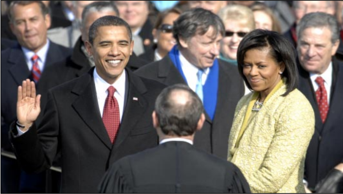
Պարաֆ Օպամա Երդում կատարելով դարձաւ Ամերիկայի Միացեալ Նահանգներու 44-րդ նախագահը

Յունուար 20-ին, Պարաք Օպամա երդում կատարելով դարձաւ Ամերիկայի Միացեալ Նահանգներու 44-րդ նախագահը, սակայն, ան եղաւ առաջինը, որու արմատները կու գայ աբրիկեան ցամաքամասէն եւ ոչ թէ Եւրոպայէն: