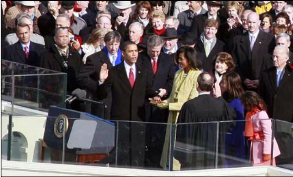
Barack Obama takes the Oath of Office as the 44th President of the United States

WASHINGTON, DC -- Barack Obama, sworn in on January 20 as the 44th president of the United States, urged his fellow Americans to cast aside their political and social divisions and instead face the challenges of economic chaos, two difficult wars, and a growing environmental crisis with what he called a "unity of purpose."