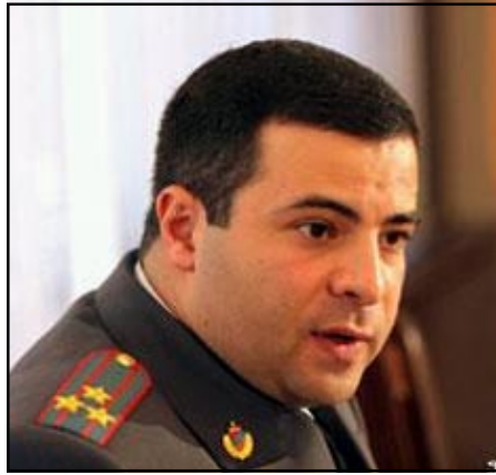
Սպաննուած փոխտարապետ Գեորգ Մհերեան

Երեքշաբթի, փետրուար 3-ի երեկոյան, Երեւան Գիւլեան փողոցի վրայ գտնուող իր բնակարանի մօտ, հրազէնով սպանուած է ՀՀ փոխտարապետ, զինուորացի, 1975 թուականի ծնունդ Գեորգ Մհերեանը: Ան մահացած է գլխէն ստացած հրազէնային կրակոցէն: Մհերեանի վրայ արձակուած է 6 կրակոց: