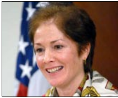
U.S. ambassador to Armenia Marie Yovanovitch

Armenia's main opposition alliance led by former President Levon Ter-