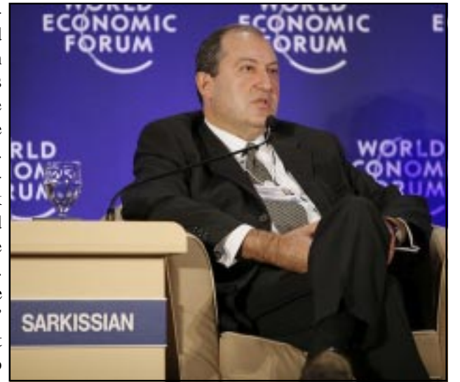
Former Prime Minister Armen Sarkissian

Armenia's former Prime Minister Armen Sarkissian, who is the Chairman of the Global Energy Security Council, participated as a speaker in a plenary session on "An Integrated Approach to Energy, Food and Water Security". The discussions focused on the impact of the global financial turmoil on supply and distribution of natural resources in view of the facts that 1 billion people around the world lack clean water, one in four lacks electricity, and 25,000 die of hunger each day. The speakers addressed the hidden interrelationships between food, water and energy. Water and energy are more closely interlinked than many assume.