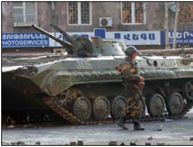
Army units in the streets of Yerevan on March 1, 2008

Suren Abrahamian, an opposition figure who had served as interior minister in the late 1990s, tells "Aravot" that police troops could not have opened fire at the protesters without their commanders' orders. "Who gave the orders?" he asks. "In which regiment, battalion did he serve? Where was it deployed?" Abrahamian dismisses investigators' assurances that it is impossible to forensically identify who killed the three men with tear gas bullets.