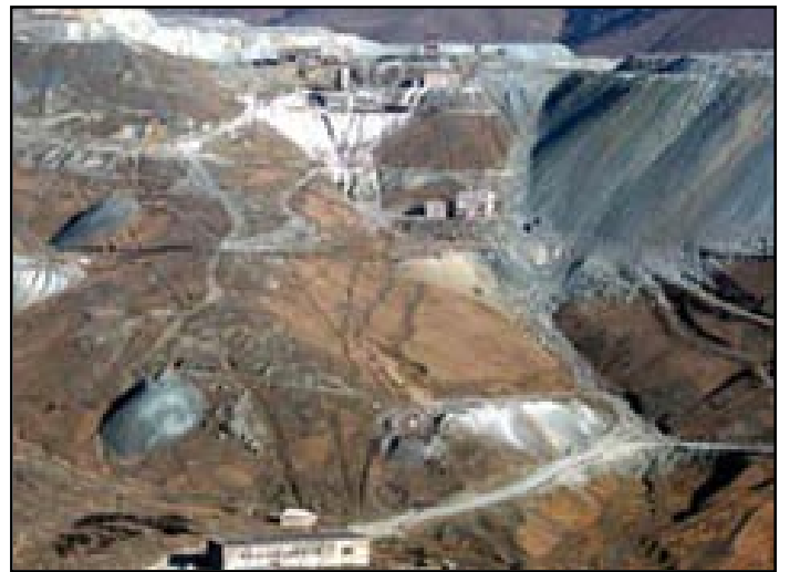
Ագարակի պղինձի գործարանը դադարած է աշխատելէ

«ԱԶԱՏՈՒԹԻՒՆ ՌԱՏԻՈՅ»: Ագարակի պղնձամոլիբդենային կոմբինատի աշխատակիցներին ծանուցազրեր են ուղարկուել, որտեղ նշուած է, թէ նրանց վերջին աշխատանքային օրը Մարտի 9-ն է: Կոմբինատի սեփականատէր GeoProMining ընկերութեան արտաքին կապերի պատասխանատու Ռուզաննա Գրիգորեանը «Ազատու թիւն»