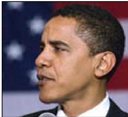
U.S. President Barack

"The President emphasized his desire to strengthen U.S.-Turkish relations and to work together effectively in NATO," the statement said,