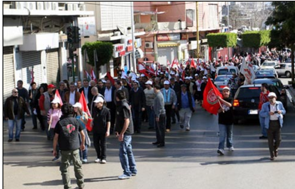
Լիբանանահայեր Պէյրութի Հանրն թաղամասէն անցնելով կ'ուղղուին դէպի հանրահաւաքի վայրը

Շաբաթ, Փետրուար 14-ին Լիբանանի մայրաքաղաք Պէյրութի կեդրոնական՝ Նահատակաց հրապարակին վրայ տեղի ունեցաւ «Մարտ 14» համախմբուած կազմակերպած հսկայ հանրահաւաքը, պը նուիրուած էր նախկին վարչապետ Ռաֆիք Հարիրիի սպանութեան 4-րդ տարելիցին: Ըստ միջազգային մամուլի գործակալութիւններուն, հանրահաւաքին մասնակցած են հարիւր հազար