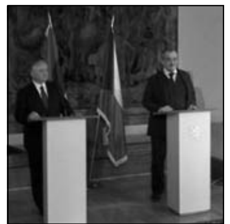
Eduard Nalbandian and Karel Schwarzenberg

Nalbandian reiterated his government's assertions that none of those oppositionists is a political prisoner. Still, he said Yerevan is committed to fully complying with Council of Europe resolutions that demand the release of all individuals arrested on "seemingly