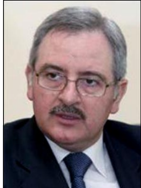
Պետական նախարար Ժան Օղասապեան

Շաբաթ, Փետրուար 14-ին Լիբանանի մայրաքաղաք Պէյրութի կեդրոնական՝ Նահատակաց հրապարակին վրայ տեղի ունեցաւ «Մարտ 14» համախմբուած կազմակերպած հսկայ հանրահաւաքը, պը նուիրուած էր նախկին վարչապետ Ռաֆիք Հարիրիի սպանութեան 4-րդ տարելիցին: Ըստ միջազգային մամուլի գործակալութիւններուն, հանրահաւաքին մասնակցած են հարիւր հազար