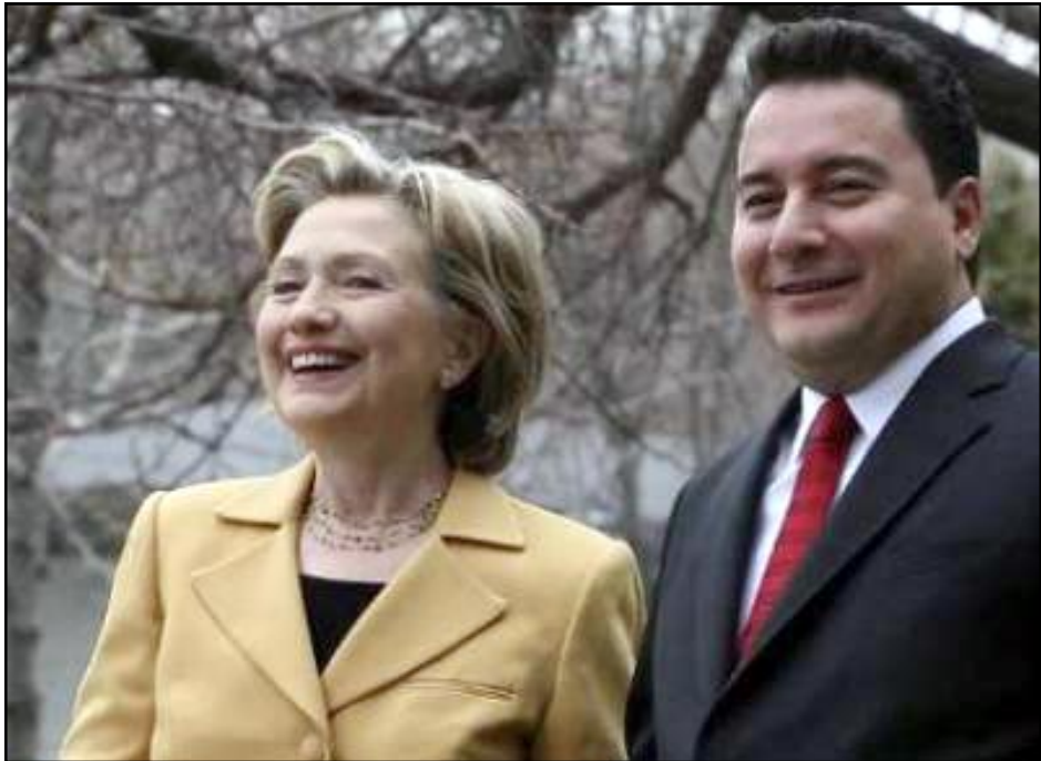
Հիլըրի Գլինթըն եւ Ալի Պապաճան Անգարայի մէջ իրենց հանդիպման ընթացքին

«Թուրքիոյ մէջ, որեւէ հարցազրուած եւ կամ հրատարակչին քննարկում, թէ ի՞նչ պատահած է Օսմանեան կայսրութեան հայե-