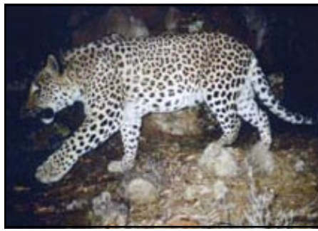
World Wildlife Fund Armenia took this rare photograph of an endangered Near Eastern Leopard in Southern Armenia in 2005

The film notes that the natural corridors of the leopard stretch over dozens of kilometers in southern Armenia and parts of Nakhichevan and Nagorno Karabagh, and that they are