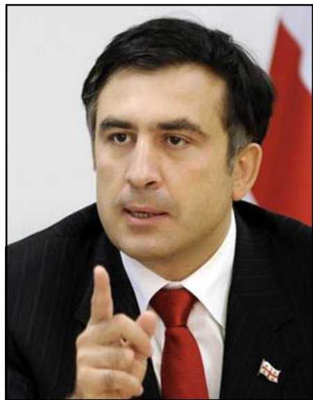
Վրաստանի նախագահ Միխայիլ Սահակաշվիլի

Նա նշել է, որ Վրաստանի հարեւան երկրների տնտեսութիւններում դժուարութիւններ են ծագել, սակայն Վրաստանը կանգուն կը մնայ: «Վրաստանը կանգուն կը մնայ, Վրաստանը կը փրկուի նոյնիսկ ամենածանր պայմաններում, եթէ մեզ մօտ լինի քաղաքական կայունութիւն», - յայտարարել է Վրաստանի նախագահը, յաւելելով,