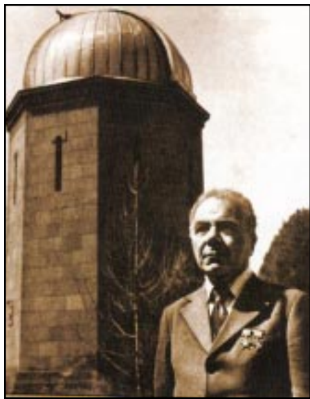
դաբնագիտութեան անդրանիկ ամպիոնի առաջին վարիչ-փրոֆեսորը:

Զեկուցաբերը նախ արագորէն տուաւ դպրոցական եւ համալսարանական տարիները, երբ արդէն իր հետաքրքրութեան կեդրոնն էին գիտութիւնն ու մաթեմատիկան ընդհանրապէս եւ աստղագիտութիւնն ու տեսական աստղաբանագիտութիւնը (աստղաֆիզիկան) մասնաւորապէս: Ծնած Թիֆլիս, 18 Սեպտեմբեր 1908ին: Հազիւ 16 տարեկան, յայտնի գրականագէտ-բանասէր իր հօր Համազասպ Համբարձումեանի ճիգերով Լենինկրատի համալսարանը կ'ընդունուի, ուրկէ շրանաւարտ կ'ըլլայ 20 տարեկանին՝ 1928ին: Ուսումը կը շարունակէ Բուլղարիոյ աստղագիտարանը, ուրկէ նոյն ատեն մեծաթիւ գիտական աշխատասիրութիւններ կը հրատարակէ գերմաներէն լեզուով՝ գերման աստղագիտական համբաւաւոր պարբերաթերթերու մէջ: Լենինկրատի պետական համալսարանի դասախօս է 1931-1934 թուականներուն, ուր փրոֆեսորի տիտղոսը կը ստանայ 1934-ին, 26 տարեկանին, եւ ուր կը նշանակուի Սովետ Միութեան նորաստեղծ աստ-