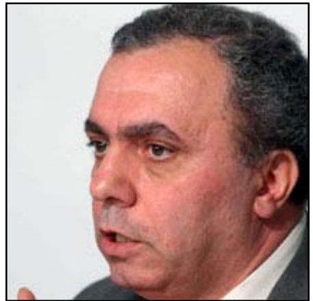
Մախկին վարչապետ, Հայ ազգային կոնգրեսի ներկայացուցիչ Հրանդ Բագրատեան

Նախկին վարչապետը չի նշեցրեց, որ դեռ 2008 թուականի Դեկտեմբերի վերջին Հայ ազգային կոնգրեսը եւ մասնաւորապէս ինքը