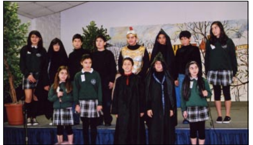
Մերտինեան Վարժարանի աշակերտները ելոյթի պահուց

նը տալէ ետք, ան յայտնեց որ Վարդան ո'չ թէ երիտասարդ տարիքին հայրենիքը պաշտպանելու համար պայքարի գնաց, այլ՝ 62-64 տարեկանին, երբ ընտանիքի ու գաւազներու տէր էր եւ ունէր հանգիստ կեանք ապրելու բոլոր պայմանները: Ան քաջ գիտէր որ