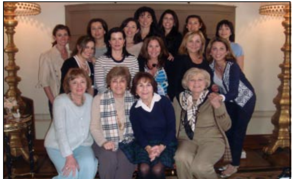
AMAA Orphan and Child Care Luncheon and Fashion Show organizing committee members

The AMAA Orphan and Child Care Luncheon and Fashion Show is almost here! It is going to be absolutely spectacular, with fashions from Nordstrom, modeled by 55 of our gorgeous young models, an amazing silent auction featuring priceless items – from handpainted works of art to magnificent jewelry to stays at five star resorts to tickets to incredible events - and all at a fabulous venue – the Beverly Hills Hotel! This is truly a luncheon not to be missed.