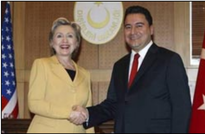
US Secretary of State Hillary Clinton with Turkey's Foreign Minister Ali Babacan in Ankara

Turkey within the next month or so," she said at a joint press conference with Babacan after talks with Turkish leaders.