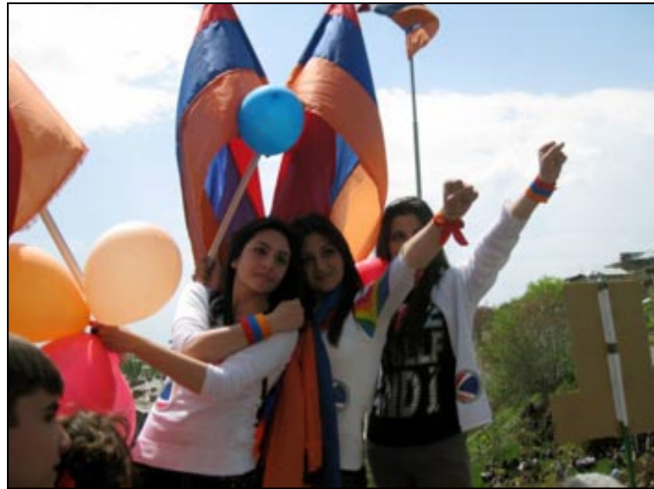
Մայիս 1-ի հանրահաւաքին մասնակցող երիտասարդների տօնակալ տրամադրութեան մէջ

ցողական դիրքորոշումից: Սակայն առկայ են երկու հանգամանքներ, որոնք մթազնում են այս տպաւորութիւնը: Հայկական կողմի համար ակնյայտօրէն որոշակի դժուարութիւն պիտի յարուցեր հայ եւ թուրք պատմաբանների յանձնաժողովի ստեղծման գաղափարը, եւ վերջիվերջոյ նրան յաջողուել է այն վերանուանել միջկառավարական յանձնաժողով: Բայց դա ընդամենը միայն խնդիրը քողարկելուն եւ հայ ժողովրդին հանդարտեցնելուն միտուած մեղմասացութիւն է, քանի որ միջկառավարական յանձնաժողովում եւս ենթադրուում է ստեղծել պատմաբանների ստորաբաժանում, ինչից հարցի էութիւնն ամէնեւին չի փոխուում: Իսկ թուրքական կողմը չի կարող հաշուի չնստել աղբեջանական