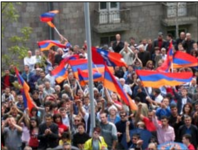
Popular movement supporters waving Armenian national flags

Ter-Petrosian also urged the authorities to ensure that the polls are free and fair. "The proper conduct of the mayoral elections is Serzh Sarkisian's last chance to gain some authority with Armenian society and the international community," he said.