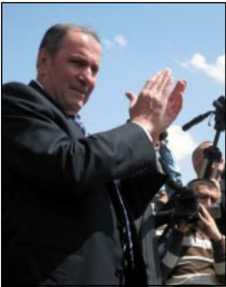
Լ.Լ.ՍԵՐՋԱՆԻ ՏԵՐ-ՊԵՏՐՈՍԵԱՆ ԵՐ ԲԱԳՄԱՆԻՎԱԿԱՐ ԺՈՂՈՎՈՐԴ ՄԱՅԻՍ 1-Ի ԽՈՐՀԱՆՈՒՄԻ ԸՆԹԱՑՄԱՆ