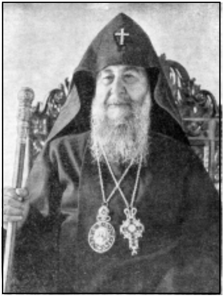
որդ Արքեպիսկոպոս, յայտնապէս երջանիկ եւ սակայն միշտ արթնամիտ, վերջին խնդրանք մը եւս ներկայացուց Ստալինի, ոչ գրաւոր այլ բանաւոր կերպով, որ Խորհրդային Միութեան պետը բարի ըլլար գրաւոր վաւերացնել տրուած արտօնութիւնները «Իբրեւ վկայութիւն ձեր յատուկ ուշադրութեանը դէպի հայ ժողովուրդը եւ հայոց եկեղեցին, ինչպէս կ'ընէին մեր պատմութեան մէջ հայոց թագաւորները»: Ստալին վերադարձնելով Տեղակալին լման գեկուցագիրը, արդէն »առաջին էջի վերին ձախ անկիւնում լայնակի ձեռագրով մակագրած էր «Համաձայն եմ»: Խորհրդային Միութեան ժողովրդական կոմիսարների խորհրդի նախագահ՝ Ի. Ստալին. 19.4.45 թ.»: Այս կերպով Գէորգ Տեղակալ

Իոսիֆ Ստալին, ի ներկայութեան կրօնական գործերու խորհուրդի նախագահ Ի. Պոլեանսկիի, «բարձր գնահատեց Տեղակալի հայրենասիրական գործունէութիւնը» եւ համաձայն եղաւ Գէորգ Արքեպիսկոպոսի գեկուցման մէջ գտնուող բոլոր խնդրանքներուն գոհացում տալ, բացի «Էջմիածնապատկան կալուածքները» հարցէն, քանի որ այդ կալուածները հողատնտեսութեան տրամադրուած էին ու հաստատուած իր, Ստալինի կողմէ, որպէս մնալուն օգտագործում: Գէ-