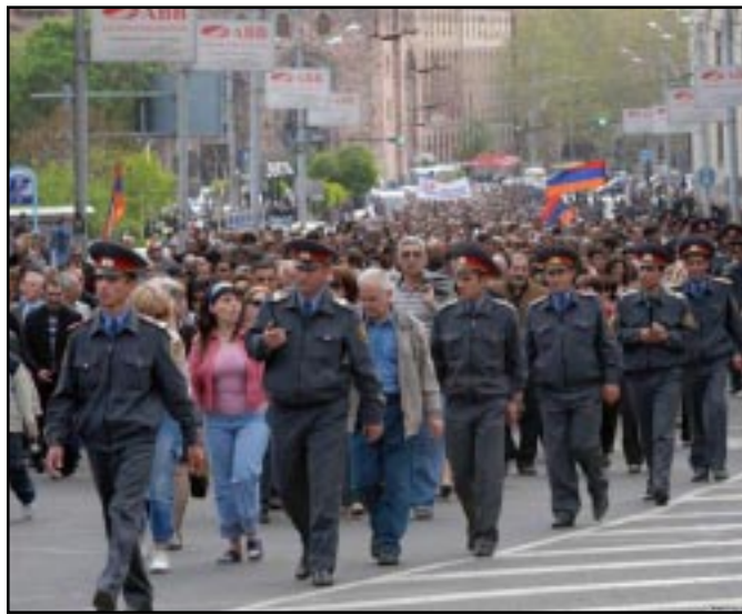
Thousands of opposition supporters march through Yerevan

key misled Yerevan and Washington into thinking that it is about to lift the 16-year blockade of Armenia in order to stop U.S. President Barack Obama from describing the 1915 massacres as genocide.