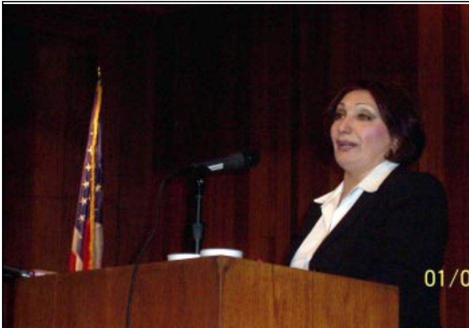
Արուեստարան, փրոֆ. Մարգարիտ Շահինեան

Այս խորագրի ներքոյ Ապրիլի 21ին Կլենտոնի քաղաքի կենտրոնական գրադարանում «Նոր Սերունդ» Մշակութային Միութիւնը նախաձեռնել էր մի հիանալի ծրագիր: Այն նուիրուած էր 1915 թ.ի Ապրիլեան եղեռնի զոհերից մէկի, հայ ժողովրդի փառապանծ զաւակ, հայ երաժշտարուեստի հանճարեղ գործիչ Կոմիտասի ծննդեան 140-ամեակին: