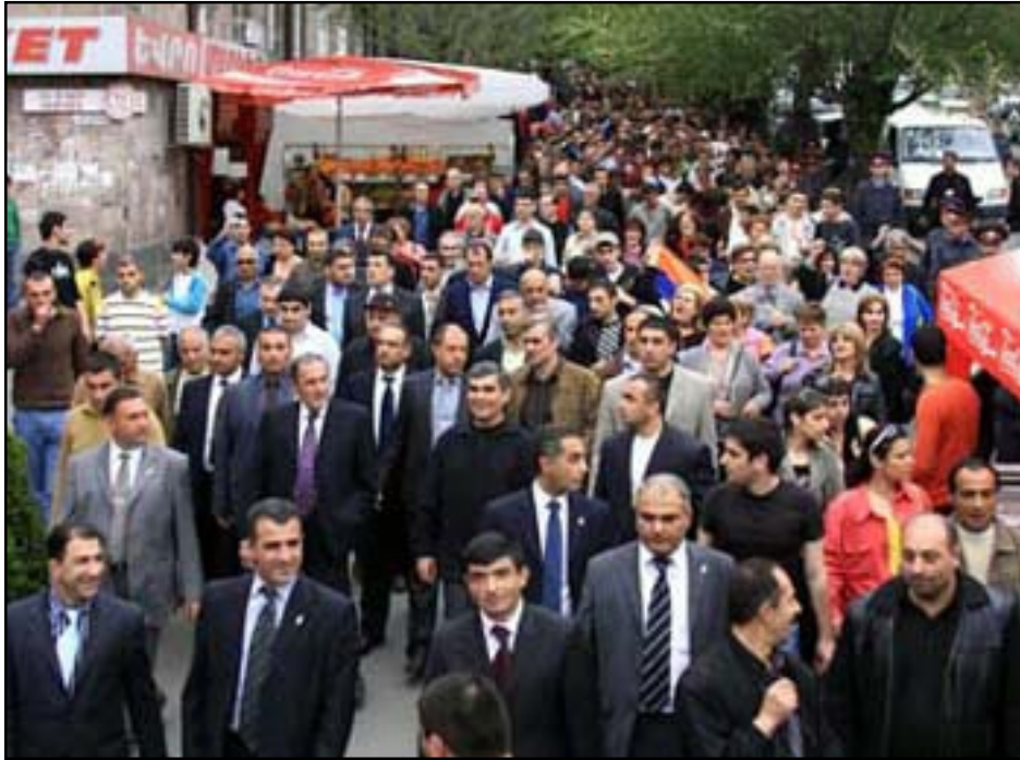
ԼԵՆԻՆ ՏԷՐ-ՊԵՏՐՈՍԵԱՆԻ Կ՝ԱՌԱՅԻՆՈՒՄԻ ԲԱԳՎՈՒՅԻՆՆԵՐ՝ ԱՐԱՔԻԻՐԻ ՓՈՂՈՑՆԵՐՈՎ

ԵՐԵՒԱՆ, «ԱՅԲ-ՖԷ»: Մայիս 5-ին Երեւանի աւազանու անդամների ընտրութիւններին ընդդիմութեան թեկնածու Լեւոն Տէր-Պետրոսեանի նախընտրական առաջին հանդիպումը սկսուեց Արաքիի համայնքից: Ինչպէս իր ելոյթով նշեց Հայ Ազգային Կոնգրեսի ղեկավարը, այսպիսի գեղեցիկ մեկնարկը անպայման աւարտուելու է յաղթանակով: