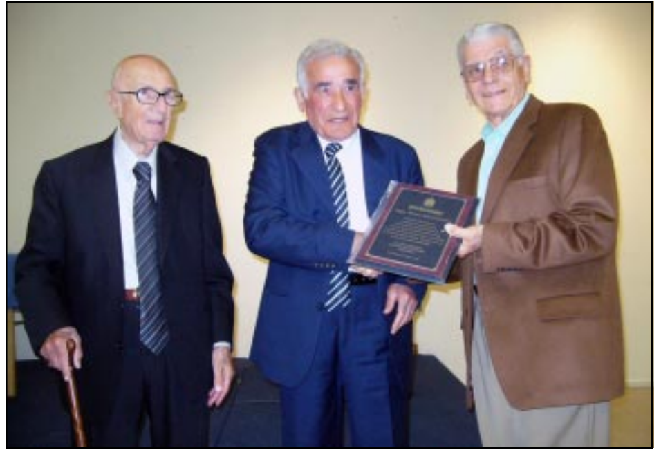
ՏՕԲԹ. Ա. ԳԱԶԱՆՃԵԱՆ

Հայէպահայ ծանօթ բանաստեղծ, արձակագիր, հրապարակագիր, շրջուն մտաւորական, Թորոս Թորանեան, հիւրաբար կը գտնուի Լոս Անճելոս: Այս այցելութիւնն իր կողմէ քաղութիւն պիտի տրուէր թուականէս երկու տարի առաջ, Այթապի Հերոսամարտի 88-րդ տարեդարձի տօնակատարութեան իբրեւ գլխաւոր բանախօս հրաւիրուած ըլլալուն առիթով: Թորանեան, արկածի մը հետեւանքով չէր կրցած ճամբորդել: Փոխարէն՝ ան ուղղարկած էր իր գրաւոր ելոյթը: Ուրախ ենք յայտնելու, որ Թորանեանի այս այցելութիւնը առիթ ընծայած էր «Նոր Օր»ին, գործակցաբար Այնթապի, Տէրթ Եօլի հայրենակցական միութիւններուն, ինչպէս նաեւ Ամերիկայի Հայ Գրող-