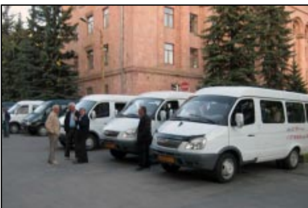
Minibuses parked outside the Vanadzor municipality

Yerevan and stopped outside the HHK headquarters in the city center more than two hours later.