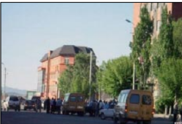
Minibuses and cars parked outside the Gyumri municipality

A very similar scene was observed in Vanadzor, the other major city in northern Armenia. Just about every senior local government official was among about a