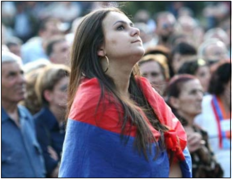
Յունիս 1-ի հանրահաւաքը Մատենադարանի մօտ. Իշխանութիւնները իրենց ապօրէն քայլերով, յուսալուծեան կը մատնեն առաջինի հերթին երիտասարդութիւնը...

ԵՐԵՒԱՆԻ ՔԱՂԱՔԱՊԵՏԱԿԱՆ ԿԵՂՈՒԱԾ ԸՆՏՐՈՒԹԻՒՆՆԵՐՈՒ ԱՐԴԻՒՆՔՆԵՐԸ՝ ՀԱՆՐԱՊԵՏԱԿԱՆ 47%, ԲԱՐԳԱՒԱԾ 22%, ՀԱՅ ԱԶԳԱՅԻՆ ԳՈՆԿՐԵՍ 17%, ՕՐԻՆԱՑ ԵՐԿԻՐ 5%, ՀՅԴ 4% ԸՆԴԴԻՍՈՒԹԻՒՆԸ ՀՐԱԺԱՐԵՑԱՒ ԻՐԵՆ ԲԱԺԻՆ ԻՆԿԱԾ ՏԵՂԵՐԵՆ