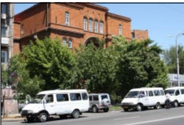
Minibuses that transported voters from Gyumri to Yerevan

hundred people that gathered outside the Vanadzor municipality early in the