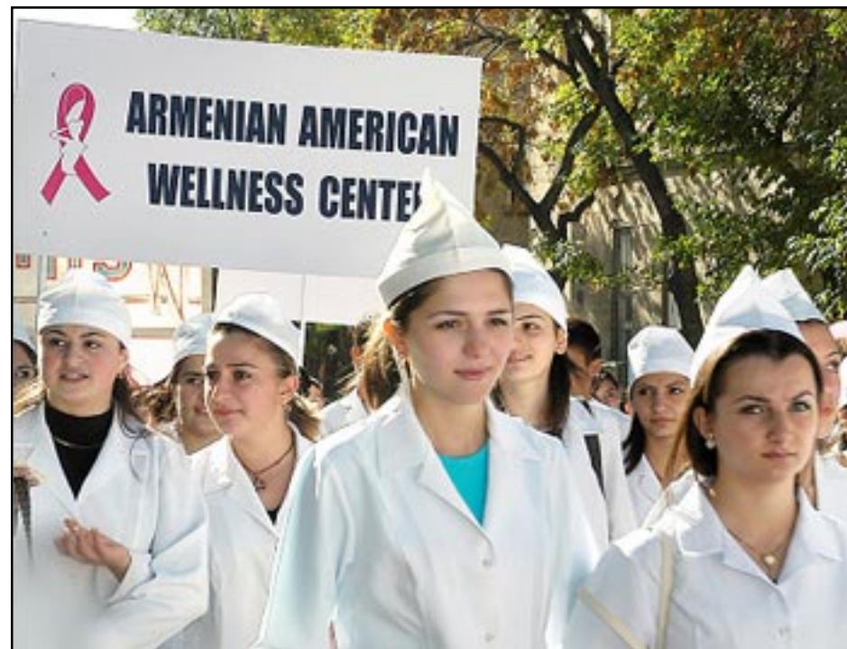
Doctors from other medical institutions in Yerevan participating in the Annual Health Walk, sponsored every year by the Wellness Center in October, during Breast Cancer Awareness Month.

newal and the much-needed peace in the Caucasus Region.