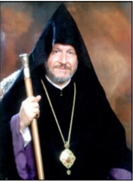
Ներսէս Արքեպիսկոպոս Պոզապալեան

Առաւօտեան կանուխ, Ներսէս Սրբազանի աճիւնը տեղափոխուեցաւ իր իսկ կառուցած Սրբոց Նահատակաց եկեղեցի, ուր մատուցուեցաւ Ս. Պատարագ: Պատար-