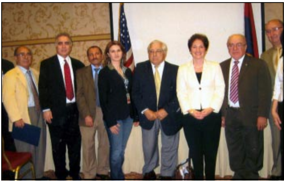
Դեսպան Սըրի Եովանովիչ շրջապատուած մամուլի խմբագիրներով

Դեսպան Եովանովիչ Ուրբաթ 26 Յունիս 2009 կ.ե. ժամը 4:00-ին տուաւ մամուլի ասուլիս մը, որ տեղի ունեցաւ Կլենտէյլի Հիլթոն պանդոկին մէջ, ուր ներկայ գտնուեցան զաղութիս համարեա բոլոր թերթերը եւ կարգ մը հեռուստատեսիլի ներկայացուցիչներ: