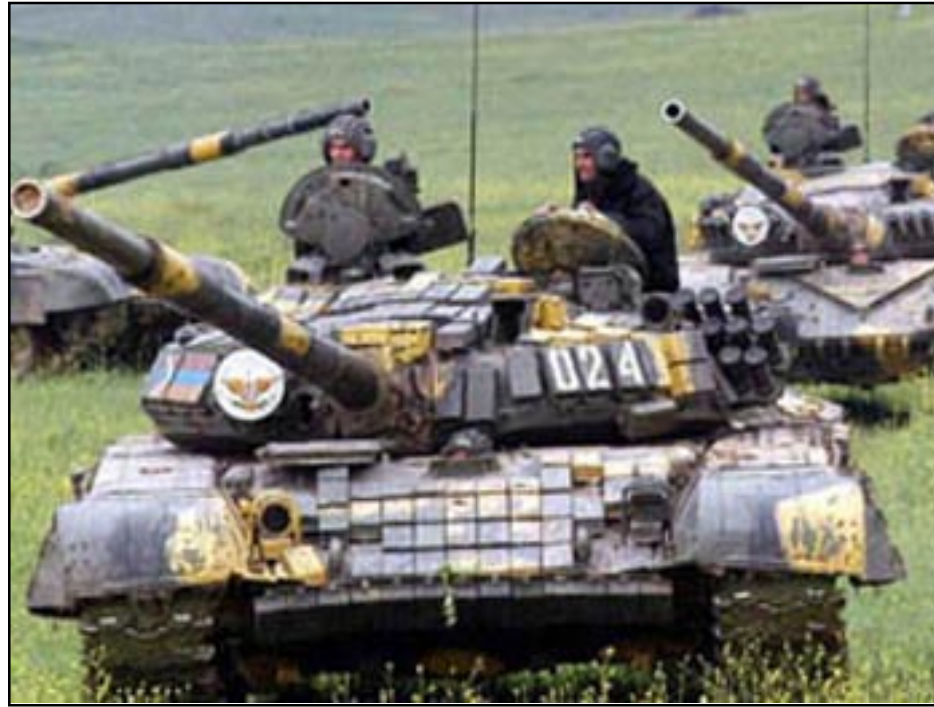
Karabagh Defense army tanks

So, does this mean Azerbaijan is ready to go to war?