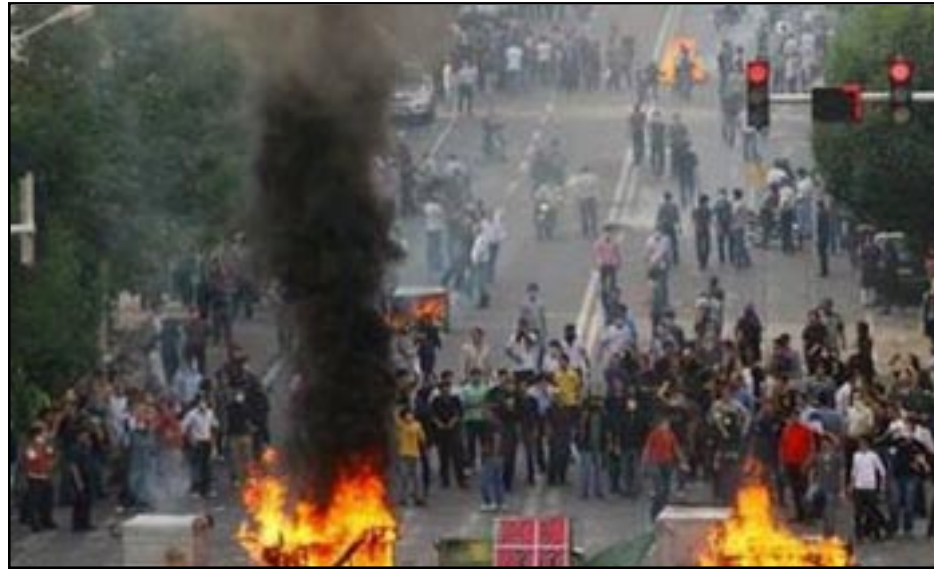
Iran presidential elections 2009

Of course, the current unrest in Iran was triggered by political developments—namely, by the 12 June presidential election, in which incumbent President Mahmoud Ahmadinejad was declared the official winner over his leading rival, former Iranian Prime Min-