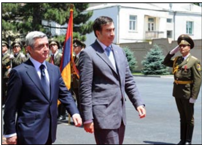
Serzh Sarkisian and Mikheil Saakashvili reviewing honor guards