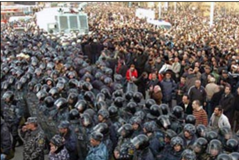
Armenia presidential elections 2008