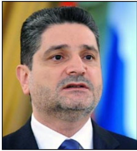
ՀՀ վարչապետ Տիգրան Սարգսյան

«ԱԶԱՏՈՒԹԻՒՆ ՌԱՏԻՕ»: Հայաստանի վարչապետ Տիգրան Սարգսյանը երեքշաբթի, Յունիս 7-ին յայտարարեց, թե տնտեսութեան ոլորտում այս տարուայ համար տեսնում է զարգացումների 3 սցենար, որոնցից ամենալավատեսականը ենթադրում է տնտեսութեան համախառն ներքին արդիւնքի (ՀՆԱ) 9,5 տոկոսի անկում: Վարչապետը չի բացառում ՀՆԱ-ի 16 եւ նոյնիսկ 20 տոկոս անկման հնարավորութիւնը: