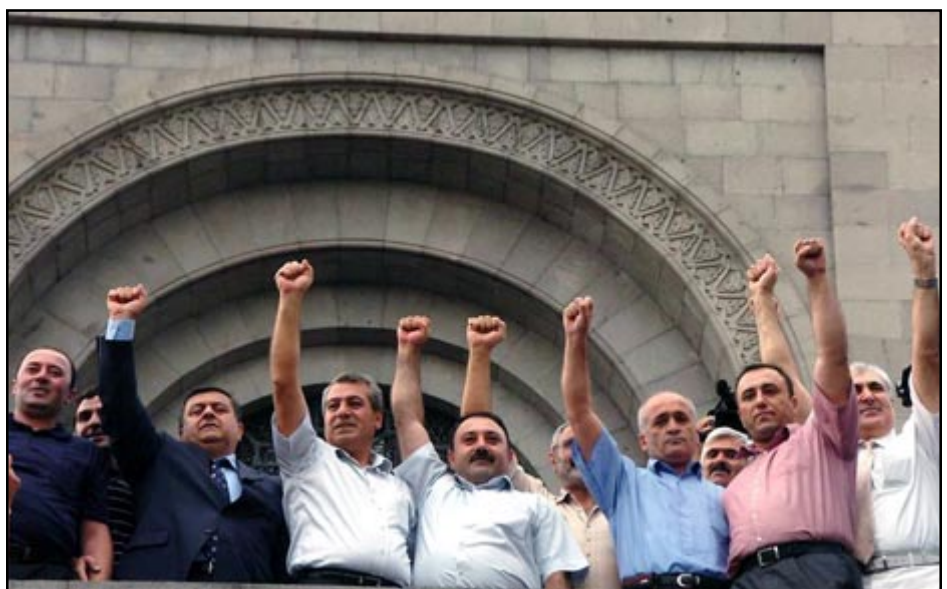
Ազատ արձակուած Բաղաբախկան բանտարկեալները Մատենադարանի առջեւ