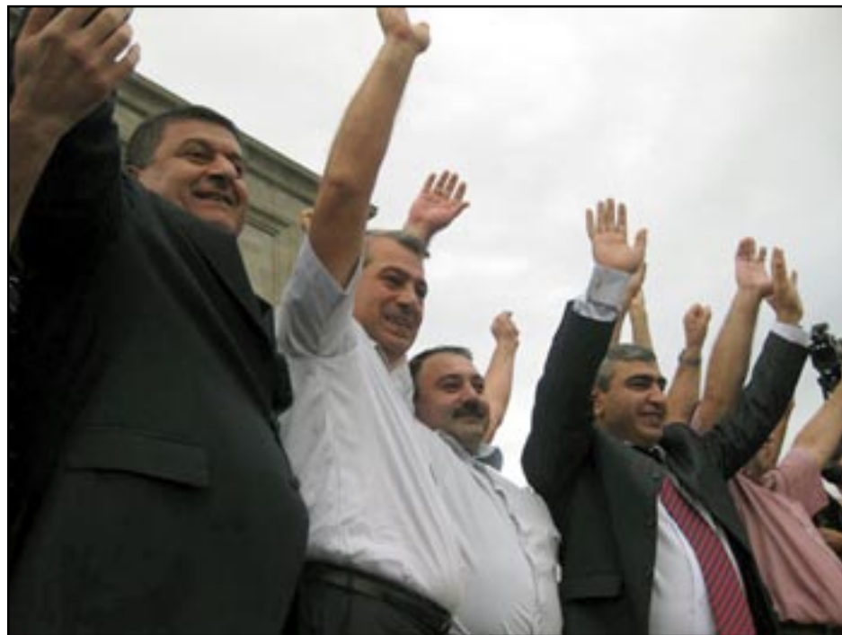
Former political prisoners waving to their supporters

YEREVAN -- Thousands of people rallied in Yerevan last Thursday to greet senior opposition figures that have been released from jail in a general amnesty declared by the Armenian authorities last month.