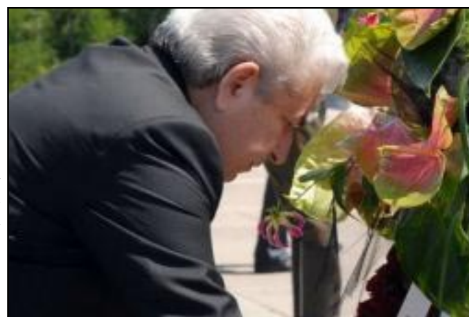
President Christofias at the memorial for the victims of the genocide

Speaking after the ceremony, President Christofias said it was unacceptable that Turkey, which is aspiring to become an EU member and wishes to