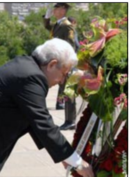
Կիպրոսի նախագահը ծաղկեպսակ կը գետնէ: ցեղասպանութեան յուշակոթողիմ

խնդրին, Խրիստոֆիասն ընդգծել է, որ այդ հարցը ուժով լուծելու բոլոր փորձերը հետընթաց են բերել: Միեւնոյն ժամանակ, նա ասել է, որ Կիպրոսում չի կարող գոյութիւն ունենալ դաշնութիւն, այն միասնական երկիր է ու ունի միասնական ժողովուրդ, թէ՛ երկու համայնքներ: