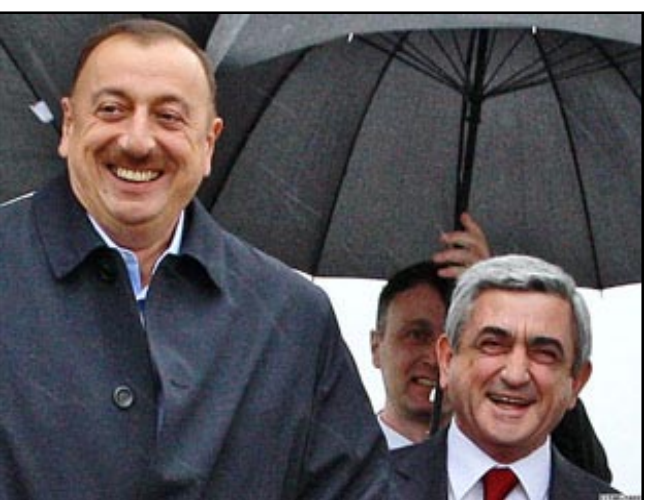
Ալիևը եւ Սարգսյանը համաձայնութեան ժայի՞տ

Ատրպէյճանի նախագահ Իլհամ Ալիևը ռուսաստանեան «Վեստի» հեռատեսիլի ընկերութեան տրուած հարցազրոյցի մը ընթացքին անդրադարձած է նաեւ Ղարաբաղեան բանակցութիւններուն, բացառապէս յայտելով ստորագրուելիք համաձայնութեան որոշ պայմանները: Բարձր գնահատելով Ռուսաստանի դերը հակամարտութեան կարգաւորման եւ հայ-ատրպէյճանական յարաբերութիւններու հարցով, Ատրպէյճանի նախագահը ասաց, որ կան որոշակի արդիւնքներ, եւ բանակցութիւնները կ'ընթանան ճիշդ ուղիով: Նոսելով հակամարտութեան կարգաւորման նպատակով գործողութիւններու յաջորդականութեան մասին, Ալիևը ասաց, - «Գոյութիւն ունի որոշակի յաջորդականութիւն կայ նաեւ Մինսկի խումբի համանախագահներու առաջարկներուն մէջ: Նոսքը Ղարաբաղէն դուրս գտնուող գրաւուած տարածքներու մասին է: Այսինքն, առաջին փուլով՝ համաձայնագրի ստորագրումէն անմիջապէս յետոյ, հայկական զօրքերը պէտք է հեռանան 5 շրջաններէն: Այն երկու տարածքներէն, որ անմիջականօրէն կը գտնուին Հայաստանի եւ Ղարաբաղի միջեւ (Քելբաջարի եւ Լաչինի շրջանները), հայկական զօրքերու դուրսբերումը պէտք է