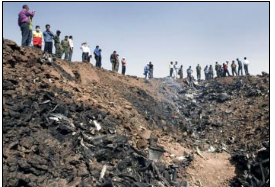
Թեհրան-Երեւան օդանաւի կործանումէն յառաջ եկած փոսը

Ի տարբերութիւն երեք տարի առաջ Սոչիի մատուցներում աւիաթարի ենթարկուած Ա-320 օդանաւի, Թեհրան-Երեւան չուերթի Տու-154 օդանաւի աղէտը կարծես թէ հանրութեան ուշադրութիւնից դուրս մնաց շատ արագ: Գուցէ պատճառն այն է, որ այդ օրերին հանրութեան ուշադրութիւնը կենտրոնացած էր Ղարաբաղի հակամարտութեան շուրջ առկայ զարգացումների վրայ, եւ մի քանի օրով շեղուելով կամ կիսուելով օդանաւի աղէտի ուղղութեամբ, հասարակութիւնը կրկին «վերադարձաւ» Ղարաբաղի կարգաւորման, մասնաւորապէս Սարգսեան-Ալիեւ հանդիպման վրայ: Գուցէ նաեւ պատճառն այն էր, որ Թեհրանից թռչող օդանաւում չկային յայտնի անուններ, չկային օրէնքով գողեր, նախկին բարձրաստիճան պաշտօնեաներ կամ բարձրաստիճան պաշտօնեաների հարազատներ: