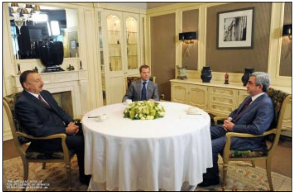
Ձախէն աջ՝ Իլհամ Ալիև, Տմիթրի Մետվետել եւ Սերժ Սարգսեան Մոսկուայի մէջ կայացած հանդիպման ընթացքին

«Ազատության» ռատիոկայանի հարցին, թէ քննարկուած է արդեօք բանակցութիւններուն Լեռ-