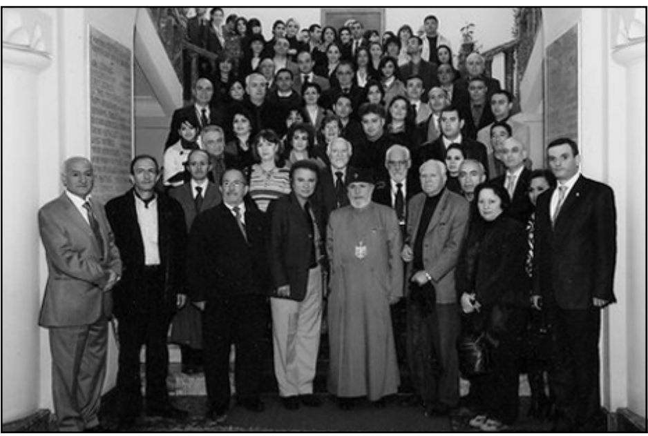
ճարտարապետական խորհրդատուութեամբ Միացեալ Նահանգներու մէջ:

1980ին Սարաֆեան իր ընտանիքին հետ կը տեղափոխուի Միացեալ Նահանգներու Տիթթոյթ քաղաքը եւ իբր փոխ նախագահ կ'աշխատի աշխարհահռչակ ճարտարապետ Մինօրօ Փամպալիի ընկերութիւնը: Իր այդ պաշտօնով Սարաֆեան մինչեւ 1994 թուական կը նախագծէ ու կը վերահսկէ տարբեր բնոյթի ճարտարապետական ծրագրեր ու շինութիւններ Թուրքիոյ, Սէուտական Արաբիոյ, Սպանիոյ, Ճափոնի, Քանադայի եւ այլ վայրերու մէջ: 1994էն ետք ան կը զբաղի