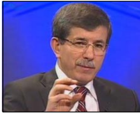
Թուրքիայի արտգործնախարար Ահմեդ Դավութօղլու

Ըստ Today's Zaman թերթի, Դավութօղլուն ասել է, թե մինչև երկու երկրների ֆուլթայլի հաղթականների միջև կայանալիք հերթական հանդիպումը, որը տեղի է ունենալու հոկտեմբերին, պաշտօնական Անգարան դրական զարգացումներ է սպասում թուրք-հայկական շարաքերութիւնների կարգաւորման առումով: