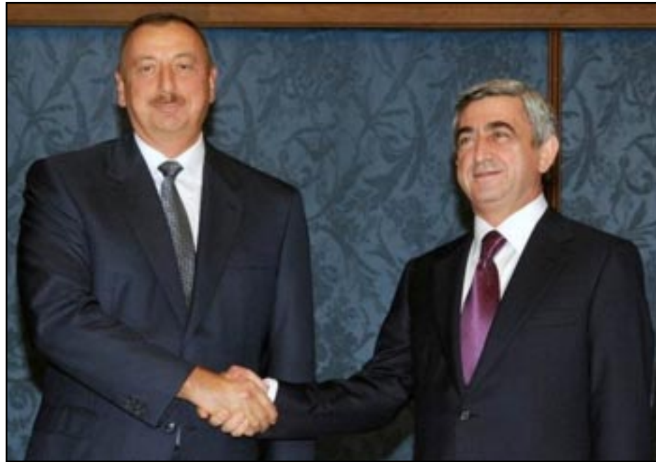
Aliiev and Sarkisian shaking hands

That joint statement listed six of those principles proposed by the mediators as a basis for further negotiations. They, in particular, call for the "return of the territories surrounding Karabakh to Azerbaijani control" and