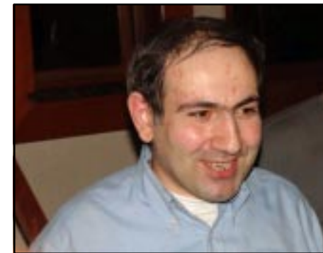
Political prisoner Nikol Pashinian

Armenia's media organizations on Tuesday expressed their bewilderment over the detention of Pashinian in the context of the government dec-