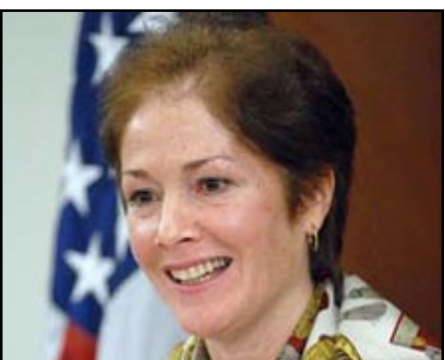
ԱՄՆ-ի դեսպան Մարի Եովանովիչ

Պատասխանելով ԱՄՆ-ում Հայոց ցեղասպանութեան ճանաչման գործընթացի վերաբերեալ հարցին՝ Մարի Եովանովիչը յիշեցրեց նախագահ Բարաք Օբամայի ապրիլ քսանչորսեան ելոյթը. - «Ես ձեր ուշադրութիւնը կ'ուզեի հրաւիրել նախագահ Օբամայի Ապրիլի 24-ին արած յայտարարութեանը այս հարցի շուրջ: Նա շատ յստակ արտայայտեց թէ՛ իր անձնական դիրքորոշումը եւ թէ՛ իր տեսակէտը գործընթացի վերաբերեալ: Եւ այժմ, երբ կարեւոր բանակցութիւններ են ընթանում հայերի եւ թուրքերի