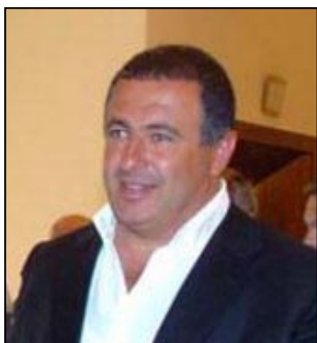
ԲՀԿ նախագահ Գազիկ Ծառուկեան

ԵՐԵՒԱՆ, «ԱՅԲ-ՖԷ»: ԲՀԿ նախագահի մամուլի գրասենեակը հերքում է այն տեղեկատուութիւնը, թէ Գազիկ Ծառուկեանի մերձաւոր շրջապատից որեւէ մէկը մասնակցութիւն է ունեցել Մարտի 1-ի դէպքերին: