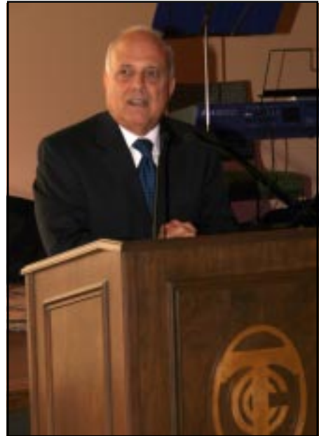
Կլենտէյլ քաղաքապետ Ֆրէնք Գինթերօ

Տեղի ունեցան սրտաբուխ նուիրատուութիւններ: Արդարեւ «Մասիս»ի տարեկան դրամահա-