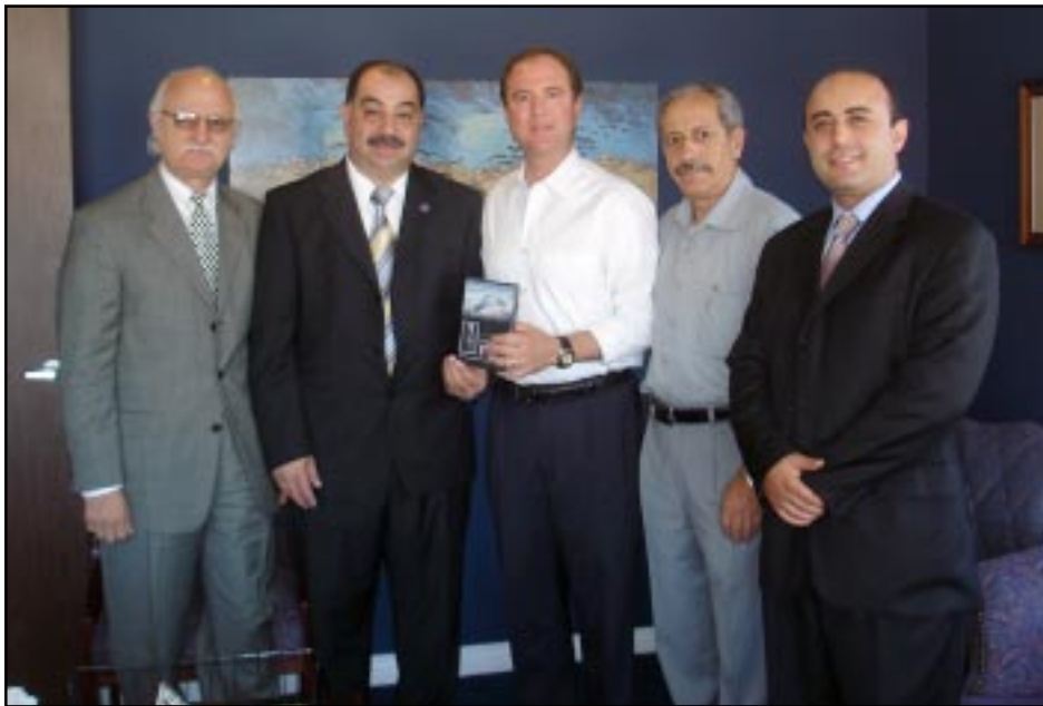
ACA delegation presenting a copy of "The Morgenthau Story" to Congressman Schiff

PASADENA -- Armenian Council of America (ACA) representatives met with Congressman Adam Schiff and discussed recent developments on the Armenian Genocide resolution, US-Armenia relations, Armenia-Turkey relations; and the Obama administration's policies toward Armenia and Artsakh.