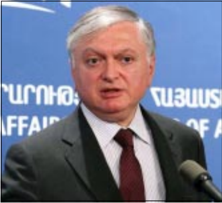
Հայաստանի արտգործնախարար Էդուարդ Նալբանդեան

«Փորձելով կապել այդ երկու գործընթացները՝ կարելի է ձախողել թէ մէկը, թէ միւրը: Նոյն դիրքորոշումն ունեն բազմաթիւ երկրներ, այդ թւում՝ Միւսկի իմքի համանախագահ երկրները, որոնք բազմիցս յայտարարել են, որ Հայաստանի եւ թուրքիայի միջեւ յարաբերութիւնների կարգաւորումը պէտք է լինի առանց նախապայմանների», - նշում է արտգործնախարարութեան հաղորդագրութիւնում: - «Այս փոխըմբռնմամբ ենք մենք սկսել եւ վարել բանակցութիւններն ու եկել փոխհամաձայնութիւնների, որոնք արտացոլում են նախաստորագրուած արձանագրութիւններում», - իր արձագանգում ասել է Էդուարդ Նալբանդեանը: «Եթէ թուրքիայի դեկալա-