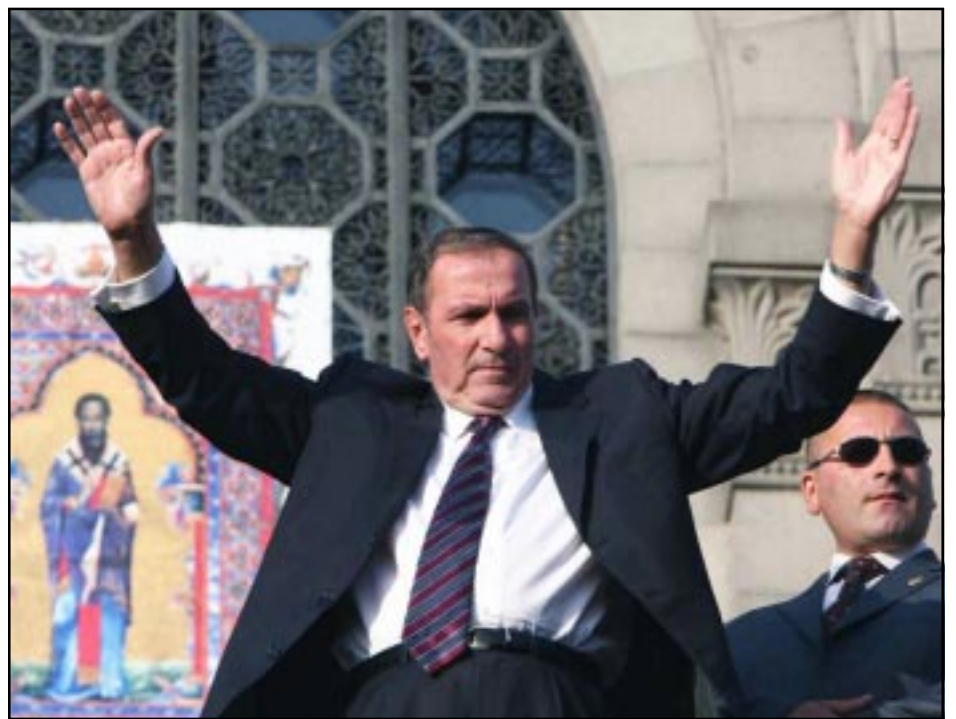
Ընդդիմութեան առաջնորդ Լեւոն Տէր-Պետրոսեան

Սեպտեմբեր 18-ին Երեւանի մէջ տեղի ունեցաւ Հայ Ազգային Գոնկրէսի հերթական հանրահաւաքը: Մատենադարանի առջեւ հաւաքուած հազարաւոր ժողովուրդի առջեւ ելոյթ ունենալով, ընդդիմութեան առաջնորդ Լեւոն Տէր-Պետրոսեան աւելի քան մէկ ժամ տեւած իր ելոյթի ընթացքին, քննադատելով հայ-թրքական յարաբերութիւններու եւ դարաբաղեան