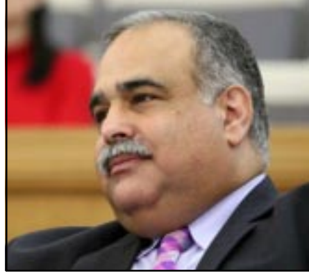
«Ժառանգութիւն» կուսակցութեան հիմնադիր Րաֆֆի Յովհաննիսեանը

Նախապայմանները, որոնց Հայաստանը դիմակայել է եւ որոնք մերժել է 18 տարի շարունակ, այսօր արդէն մտել են Հայաստանի եւ Թուրքիայի միջեւ նախաստորագրուած արձանագրութիւնների մէջ: Այդ մասին յայտարարել է Հայաստանի Հանրապետութեան առաջին արտգործնախարար, «Ժառանգութիւն» կուսակցութեան հիմնադիր Րաֆֆի Յովհաննիսեանը: