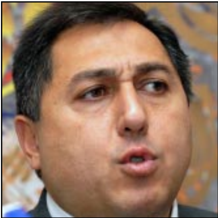
Հայաստանի մարդու իրավունքների պաշտպան Արմեն Յարուժիկյանը

Սեպտեմբեր 18-ին Հայաստանի մարդու իրավունքների պաշտպան Արմեն Յարուժիկյանը լրագրողների հետ հանդիպմանը ներկայացրեց Մարտի 1-2-ի իրադարձություններն ուսումնասիրող խորհրդարանական ժամանակաշարի յանձնաժողովի պաշտոնական հեղակացությունը, մասնաւորապէս, նշելով՝ «փորձել են սկզբից մինչեւ վերջ խնայել դատախազութեանը»: