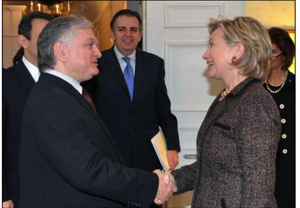
Հայաստանի արտգործնախարար Էդուարդ Նալբանդեան եւ ԱՄՆ պետքարտուղար Հիլարի Քլինթոն

Հայաստանի արտգործնախարար Էդուարդ Նալբանդեանը Սեպտեմբերի 28-ին ծաւալուն ելոյթով է հանդէս եկել Միաւորուած ազգերի կազմակերպութեան գլխաւոր ասամբլեայի 64-րդ նստաշրջանում: