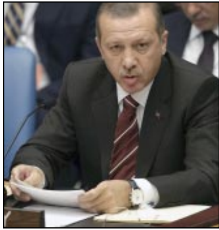
Թուրքիայի վարչապետ Ռեճեփ Թայիփ Էրտողան

«Հայաստանի հետ յարաբերությունների բարելավման գործընթացում թուրքիան չի կարող հաշուի չառնել Ատրպեյձանի շահերը», երկն Նիլ Երթում տեղի ունեցած ասուլիսում յայտարարել է թուրքիայի վարչապետ Ռեճեփ Թայիփ Էրտողանը: