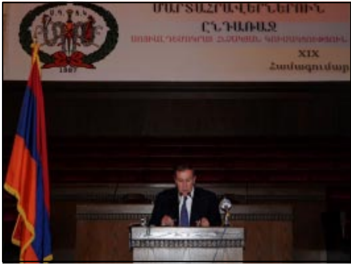
Հայաստանի առաջին նախագահ Լեւոն Տէր-Պետրոսեան

Շարունակելով իր խօսքը Ընկ. Աճէմեան ըսաւ.- «Ըսինք, որ ժամանակը բախտորոշ է: Հայաստան կը դիմագրաւէ ներքին ու արտաքին բազմաթիւ դժուարութիւններ, որոնց յաղթահարումը կը կարօտի Հայաստանաբնակ մեր ժողովուրդի եւ սփիւռքահայութեան միացեալ ջանքերու մէկտեղման ու կեդրոնացման: Սակայն դժբախտաբար, հեռու ենք այդ նպատակէն: Այսօր կը կրենք ծանր հետեւանքները այն ճեղքին որ վերջին տասնամեակին յառաջացաւ Հայաստանի ժողովուրդին ու իշխանութեան միջեւ: Ասոր վրայ, վերջին պատմական միջոցն էր աւելնալու պատմական մի նոր ազդակ մը, որ յառաջ եկաւ Հայաստանի եւ Թուրքիոյ միջեւ վարուող բանակցութիւններուն պատճա-