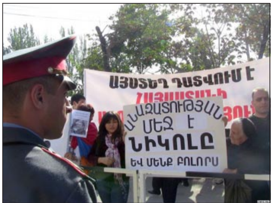
Նիկոլ Փաշինեանի դատավարութեան առթիւ հաւաքուած ցուցարարներ

Երեքշաբթի, Հոկտեմբեր 20-ին Երեւանի Շէնգաւիթ համայնքի ընդհանուր իրաւաստութեան դատարանէն ներս սկսաւ «Հայկական Ժամանակ» օրաթերթի գլխաւոր խմբագիր Նիկոլ Փաշինեանի դատավարութիւնը, որ կը նախագահէր Կենտրոն եւ Նորք-Մարաշ համայնքներու ընդհանուր իրաւաստութեան դատարանի դատաւոր Մնացական Մարտիրոսեան: