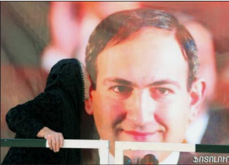
An elderly woman kisses a billboard of opposition leader Nikol Pashinian outside a Yerevan court

YEREVAN -- Nikol Pashinian, an outspoken newspaper editor and opposition figure, went on trial on Tuesday, accused of organizing last year's deadly clashes in Yerevan between security forces and opposition protesters demanding a re-run of a disputed presidential election.