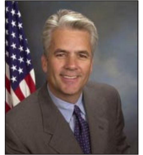
Senators John Ensign

WASHINGTON, DC -- Senators Robert Menendez (D-NJ) and John Ensign (R-NV) have introduced the Armenian Genocide Resolution in the U.S. Senate on Wednesday. The measure is similar to legislation in the U.S. House, H.Res.252, introduced earlier this year by Representatives Adam Schiff (D-CA), George Radanovich (R-CA), and Congressional Armenian Caucus Co-Chairs Frank Pallone (D-NJ) and Mark Kirk (R-IL). This measure already has more than 130 co-sponsors.