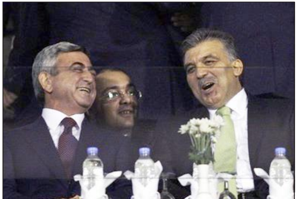
Թուրքիա-Հայաստան ֆուքայոլի խաղի ընթացքին՝ երկու երկիրներու դեկավարները բարձր տրամադրութեան մէջ...

Անցնող շաբաթավերջին, Թուրքիոյ նախագահը հեռաձայնային զրոյց մը ունեցած է Միացեալ Նահանգներու նախագահ Պարաք Օպամայի հետ, որու ընթացքին, այլ հարցերու շարքին