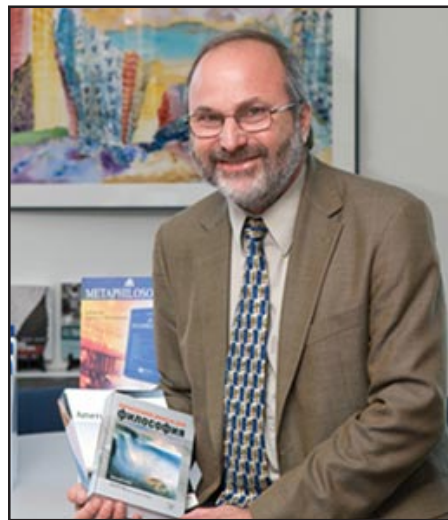
Prof. Armen T. Marsoobian

The photographs extend over a period of time that illustrates the growth and prosperity of the college and its tragic end, in the summer months of 1915, when Armenian staff and students of the college, along with most of the Armenian population of the city, were sent on the death marches of the