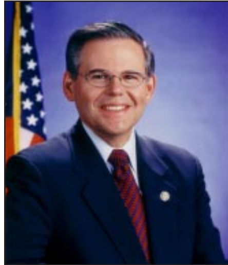
Senator Robert Menendez