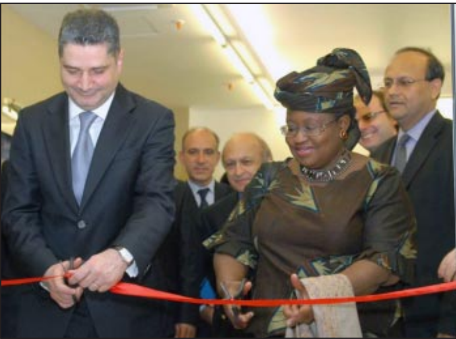
Համաշխարհային Բանկի կառավարիչ-տնօրենը եւ ՀՀ վարչապետ Տիգրան Սարգսյանն քաջուժկր կատարեն Երևանի մէջ ՀԲ գրասենեակի շէնքի

«Հայաստանի տնտեսութիւնն ունի օլիգոպոլ կառուցուածք, եւ մենք էլ հենց խօսում ենք դրա մասին, որ անհրաժեշտ է ինչ-որ բան անել», - Կիրակի, Հոկտեմբեր 18-ին հրաւիրած ասուլիսում յայտարարել է Համաշխարհային Բանկի (ՀԲ) կառավարիչ-տնօրեն Նգոզի Օկոնջո-Իվիլյան: