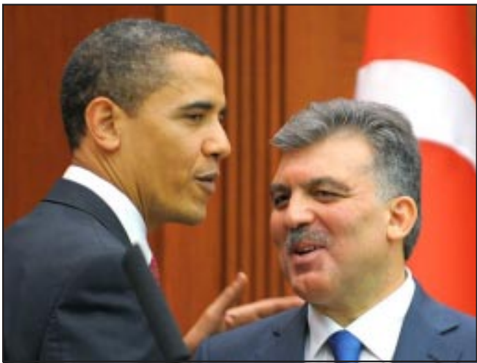
Obama and Gul discussed Armenia during a telephone conversation

The White House said Obama and Gul discussed on Saturday a range of issues of mutual interest, including the