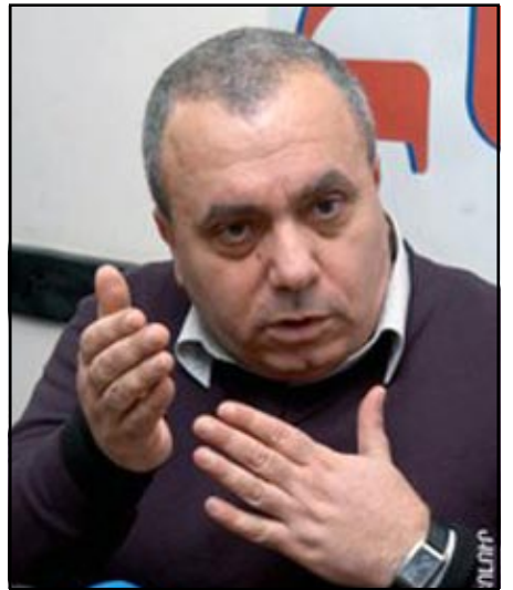
ՀՀ նախկին վարչապետ Հրանդ Բագրատեան

«Հայաստանը կարիք ունի նոր, մասշտաբային, արմատական բարեփոխումների: Այս կառավարման ախպը չի բերում որեւէ արդիւնքի», - լրագրողների հետ հանդիպման ժամանակ ասել է ՀՀ նախկին վարչապետ, ՀԱԿ ներկայացուցիչ Հրանդ Բագրատեանը: Որպէս օրինակ Հ. Բագրատեանը մատնանշել է, թէ հարկաւոր է «պրոգրեսիւ» եկամտահարկ, սակայն, ըստ նրա, իշխանութիւնները դա չեն ընդունի: