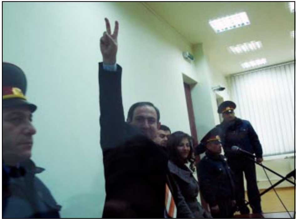
Նիկոլ Փաշինեան դատավճիռէն ետք կը պարզէ յաղթանակի նշանը

«Մենք գիտենք, որ այս դատավճիռը անձամբ Սերժ Սարգսեանն է ընդունել, բայց նրանք, ովքեր կատարում են նրա հրամանները, դահիճներ են... եւ բոլորը