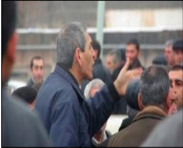
Շիրակի մարզի անհատ տաքսի վարորդները կը բողոքեն

«Ա1»: Դեկտեմբեր 18-ին Շիրակի մարզի մօտ 800 անհատ տաքսու վարորդներ բողոքի ակցիա էին կազմակերպել Գիւմրում: Պատճառն իրենց նկատմամբ կիրառուող սուղանքներն են (ընդ որում, տաքսու վարորդների խօսքերով, իրենց սուղանել են դեռեւս 2009-ին, երբ օրէնքի կիրառումը կասեցուած էր):