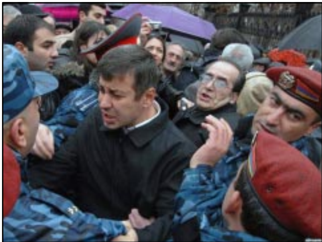
opposition supporters assaulted by riot police