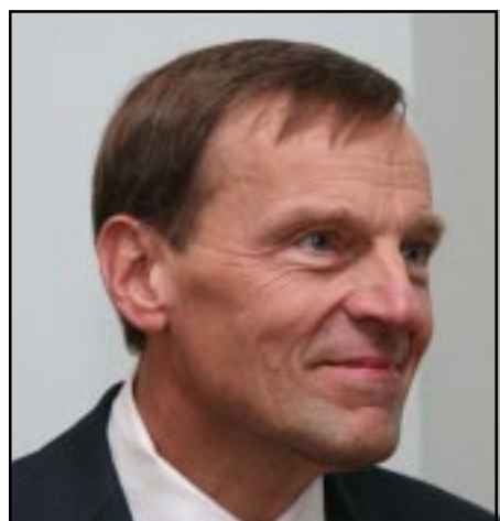
ԵԱՀԿ-ի Միսնկի խմբի ամերիկացի համանախագահ Ռոբերդ Բրադկէն

ԵԱՀԿ-ի Միսնկի խմբի ամերիկացի համանախագահ Ռոբերդ Բրադկէն Յունուար 17-ին Ստեփանակերտում Լեւոնային Ղարաբաղի նախագահ Բակո Սահակեանի հետ հանդիպումից յետոյ յայտարարեց, որ իր տարածաշրջանային այցի նպատակն է նախապատրաստել Հայաստանի նախագահ Սերժ Սարգսեանի եւ Ադրբեջանի նախագահ Իլհամ Ալիեւի միջեւ այս շաբաթ կայանալիք հանդիպումը: