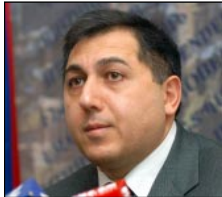
Հայաստանի մարդու իրաւունքների պաշտպան Արմէն Յարութիւնեան

Նա նաեւ տեղեկացրեց, որ կարողացել է եւ ծանօթ է Փաստահաւաք խմբի անդամների վերջին