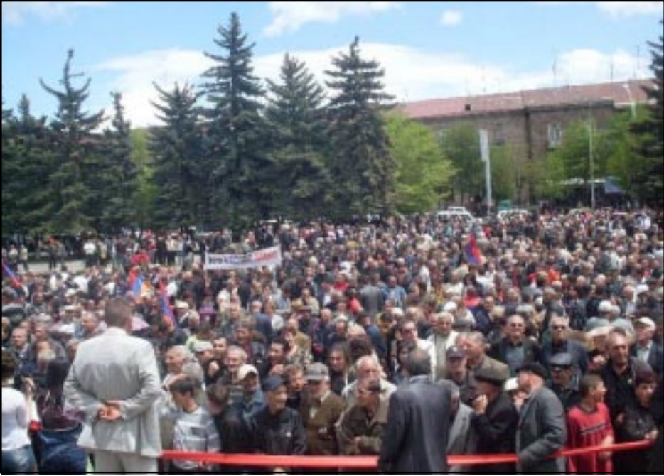
Thousands of opposition supporters in Gyumri's central square

GUMRI-- Members of Armenia's main opposition alliance held a public rally in the country's second largest city of Gyumri on Monday during which they again denounced the policies of the current government and called for snap elections.