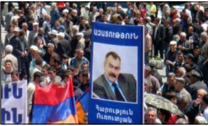
Բազմամարդ հանրահաւաք Գիւմրիի մէջ

Մայիս 24-ին Կիւմրիի Թատերական հրապարակը վաղ առաւօտից բազմամարդ էր: ՀԱԿ-ը մեկնարկեց մարզային իր հանրահաւաքների շարքը: Մարդիկ պաստառներով եւ դրօշներով եկել էին հրապարակ արտայայտելու իրենց մտահոգութիւնները եւ լսելու ընդդիմութեան ներկայացուցիչներին: