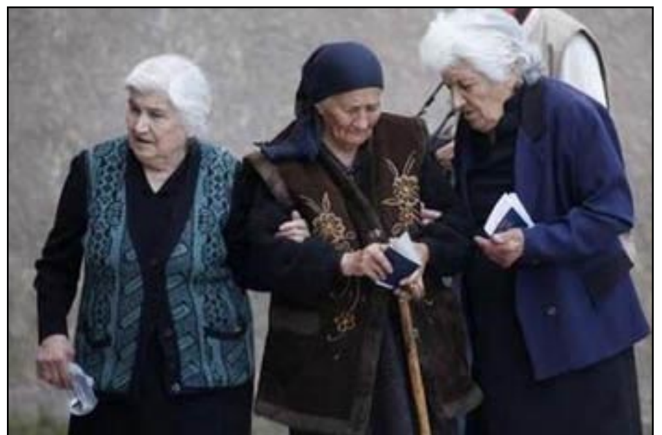
Women hold their passports as they go to a polling station

STEPANAKERT -- Voters in Karabakh went to the polls on Sunday to elect their fifth parliament since the unrecognized Armenian republic broke free from Azerbaijan's control in the early 1990s. More than 70 percent of some 95,000 eligible voters turned out to vote in the elections, according to Karabakh's central election commission.