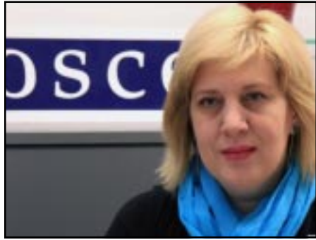
OSCE representative Dunja Mijatovic

Mijatovic stressed on Tuesday that the final version of the bill passed by the Armenian parliament on Thursday "fails to promote broadcast plural-