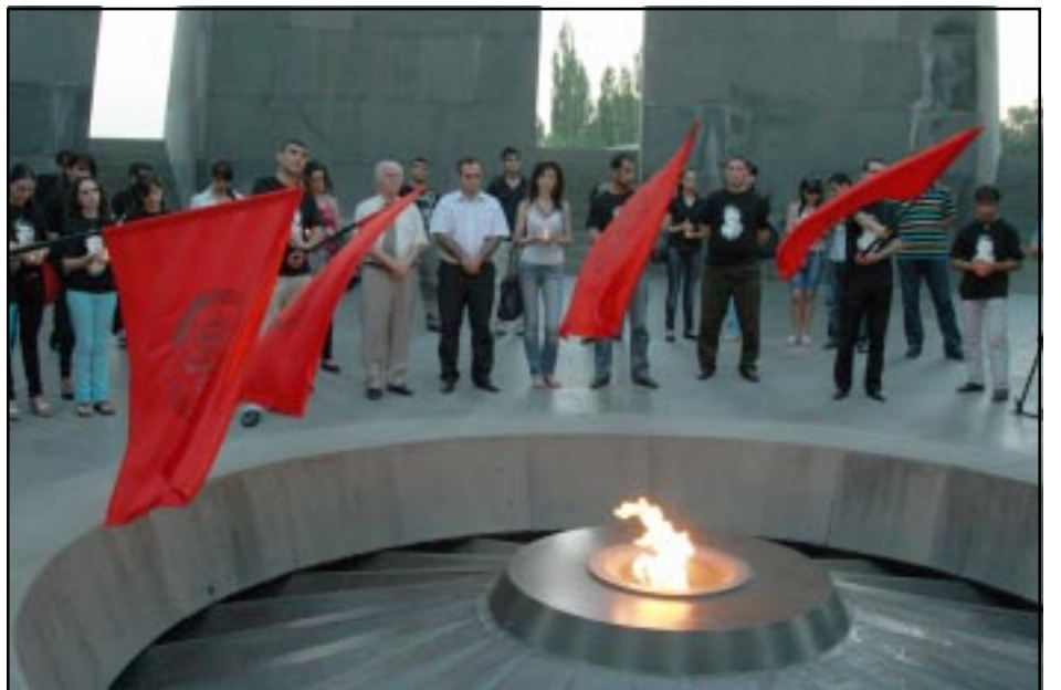
Հնչակեան երիտասարդները կը յարգեն Քսաններուն յիշատակը՝ Ծիծեռնակաբերդի եղեռնի Յուշարձանի անմահ կրակի մօտ

1915 թուականի Յունիս 15-ին Պոլսոյ մէջ թրքական կառավարութեան կողմէ կախաղան բարձրացած Հնչակեան քան դեկավարներու նահատակութեան 95-ամեակին առթիւ, ՄԴՀԿ «Սարգիս Տիւրունի ուսանողական-երիտասարդական միութիւնը Յունիս 14-ի երեկոյեան Ծիծեռնակաբերդի եղեռնի Յուշարձանի անմահ կրակի մօտ կազմակերպած էր մոմավառութիւն՝ յաւերժացնելու հերոսներու յիշատակը: