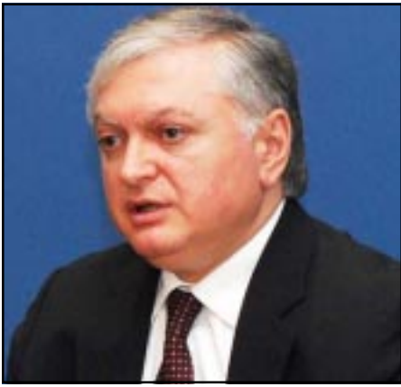
ՀՀ արտգործ նախարար Էդուարդ Նալբանդյան

Արտգործնախարարի խօսքով, Ադրբեջանը դէմ է գլխաւոր սկզբունքներին. - «Այն պնդումները Ադրբեջանի կողմից, որ իրենք կարող են Ղարաբաղին տալ բարձր մակարդակի ինքնավարութիւն»