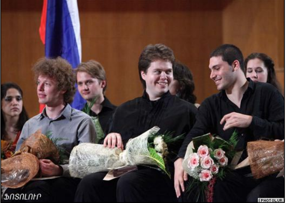
Արամ Խաչատրեանի անուան միջազգային մրցոյթի յաղթողները

Երեւանում աւարտուեց Արամ Խաչատրեանի անուան միջազգային մրցոյթը, որին այս տարի մասնակցում էին 21 երկրներից ժամանած աւելի քան յիսուն երիտասարդ ջութակահարներ եւ թաւջութակահարներ: Յաղթողներն ու լաւագոյն մասնակիցները գալա համերգով հանդէս եկան «Արամ Խաչատրեան» համերգասրահում: