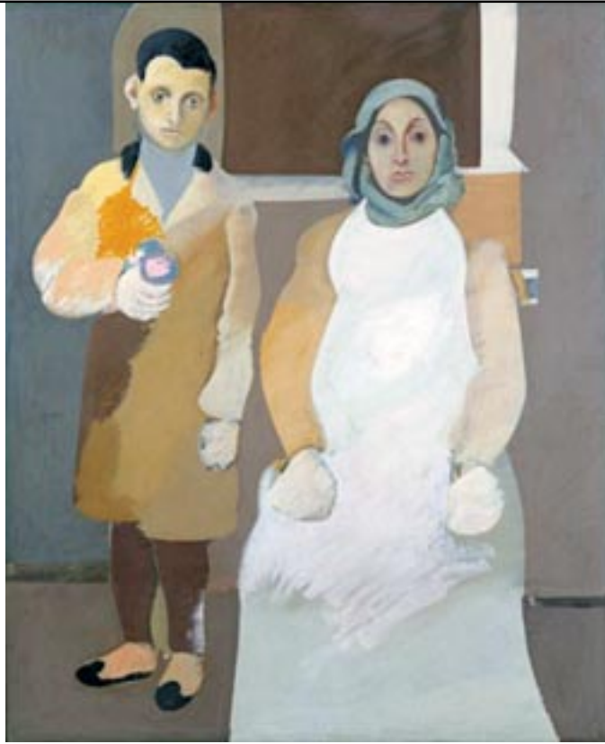
Արշիլ Կորքիի «Մայր եւ Տղան»

գնովը, Կորքիին եւ անոր շուրջ համախմբուած սրբազան խենթ տղոց, որոնց, ամերիկեան կարծր նիւթապաշտ հասարակութիւնը ժամանակին չգիտցաւ արժանին մատուցանել, զանոնք դատապարտելով չբաւորութեան, մոռացութեան եւ ապա հուսկ ուրեմն՝ անձնասպանութեան: Այդ սերունդէն չորսը ինքնասպան եղան: Իսկ երկուքը՝ ալքոլամոլութեան գոհ գացին: Կորքիին կեանքն ու ճակատագիրը սակայն, իր անաւոր բարդութիւններով հասաւ աներեւակայելի դաժանութեան, առաւել՝ իր հայու եւ եղեռնապուրծի տառապանքն ու հոգեկան խռովքը: Դժբախտ պատահարներու երկար ու անվերջանալի օղակներու շղթայում մը բաժին ինկաւ իր կարճատեւ կեանքին: