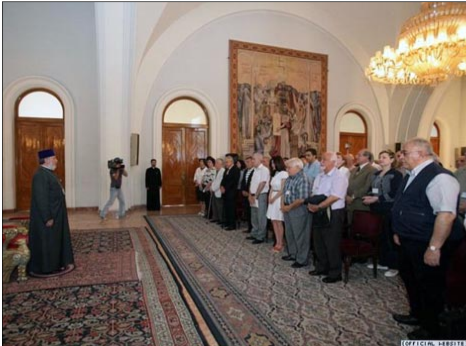
Գրողների համահայկական 5-րդ համաժողովի մասնակիցներում էջմիածնի մէջ ընդունեց Ամենայն Հայոց Գարեգին Բ. Կաթողիկոս

Հայաստանի Գրողների Միության Մարտի 29-ին բացուեց Գրողների համահայկական 5-րդ համաժողովը, որին մասնակցում են 300-ից ավելի պատուիրակներ: