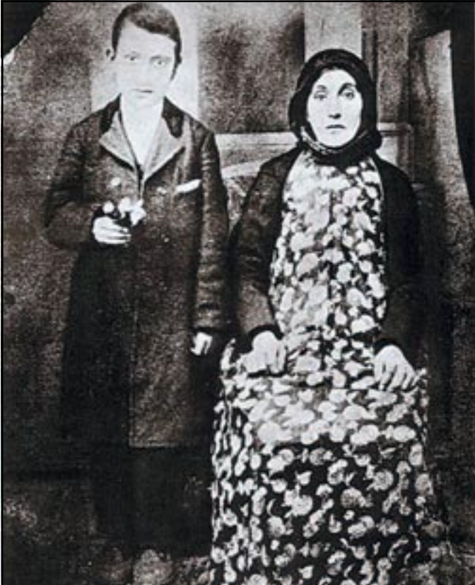
Արշիլ Կորքի եւ մայրը մկարուած Վահի մէջ

Զարմանալի ժողովուրդ ենք. 2004-ին, երբ Արշիլ Կորքի-Ոստանիկ Ատոյեանին ծննդեան հարիւրամեակն էր, մեր հանրային կարծիքն ու մշակութային մարմինները, բացառութեամբ Կորքիին կեանքին եւ գործերուն նուիրուած վէպիս շնորհահանդէսէն, մնաց անտարբեր, հակառակ անոր որ ամերիկեան արուեստաբանական մարզէն ներս, երեսուէ աւելի հատորներով գովերգուած ու փառաբանուած էր Արշիլ Կորքիին անմահական գործը, եւ մենք, որ ընդհանրապէս կը սիրենք հպարտանալ մեր արժէքներով, մանաւանդ երբ անոնք արժանացած են արդէն օտարներու հիացումին ու գովեստին՝ տարօրինակ լուծութեամբ մը գլացանք մեր յարգանքի տուրքը վճարել Կորքիին: Բարեբախտաբար, այս օրերուն, Կորքիի գործերուն յետահայեաց ցուցադրութիւնը Ֆիլատելֆիայի եւ Լոնտոնի մէջ բազմութիւններուն ուշադրութեան եւ գնահատանքին արժանանալէն ետք երբ կը հասնի Լոս Անճելըս, Արդի Արուեստի թանգարանը, կարծէք յանկարծ կը վերագտնենք մեր հին ունակութիւնը՝ հետեւելու համար գնահատանքի եւ յարգանքի միջազգային շարժումին, մեծարելու համար յիշատակն ու անգնահատելի վաստակը մեր ամենէն տաղանդաւոր եւ համաշխարհային հռչակի տիրացած նկարիչ Արշիլ Կորքիին: Այդ երկար հանդիսութեանց մէկ օղակն է այսօրուայ այս ձեռնարկը, որուն համետ իմ բաժինս բերելու հրաւիրուած եմ Պոլսահայ միութեան եւ ՆԱԱՍՐ-ի կողմէ: Ծնորհակալութիւն՝ գոյգ միութիւններուն: