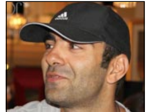
Turkish origin film director Fatih Akin