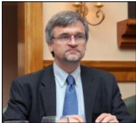
Եւրամիութեան յատուկ ներկայացուցիչ Փիթըր Սեմնեպին

Հարաւային Կովկասը շարունակում է մնալ փոփոխականութեամբ եւ անկայունութեամբ բնութագրուող տարածաշրջան, յայտարարել է Հարաւային Կովկասում Եւրամիութեան յատուկ ներկայացուցիչ Փիթըր Սեմնեպին: