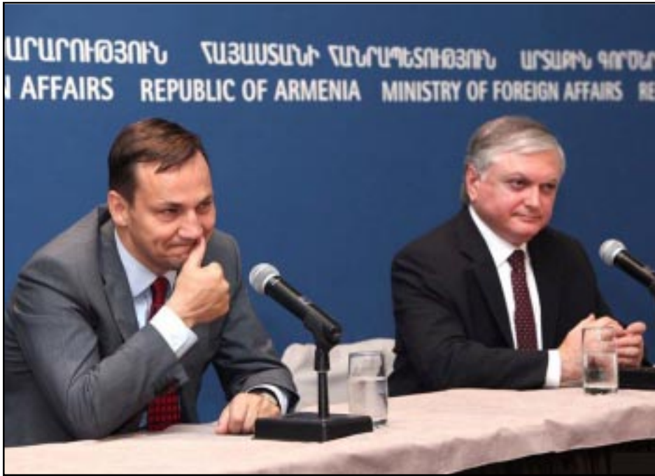
Armenian Foreign Minister Eduard Nalbandian (R) and his Polish counterpart Radoslaw Sikorski at a press conference in Yerevan

YEREVAN -- Foreign Minister Edward Nalbandian insisted on Wednesday that the Armenian and Azerbaijani presidents did receive a freshly amended international plan to resolve the Nagorno-Karabakh conflict at their most recent meeting in Russia last month.