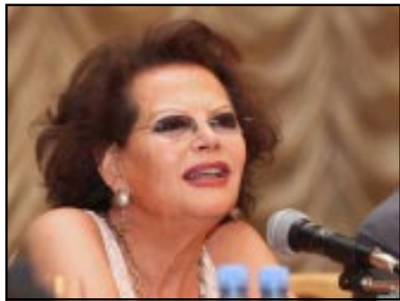
Հանրահայտ դերասանուհի Կլաուդիա Կարդինալե

Յիշեցնենք, որ այս տարի փառատոնի շրջանակներում նշուած է աշխարհահռչակ ռեժիսոր Անրի վեռնոյի 90-ամեակը, ինչի կապակցութեամբ էլ այս տարի փառատոնի բացումը կատարուել է ռեժիսորի «Մայրիկ» ֆիլմով: Բացման արարողութեանը «Մայրիկ» ֆիլմի գլխաւոր դերասա-