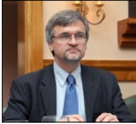
EU Special Representative Peter Semneby

South Caucasus are the primary threats to the region's stability since the status quo is inherently unstable and contains dangers of escalation. This was demonstrated by the August 2008 war in Georgia. The Nagorno-Karabakh conflict is of particular concern; there are recurring deadly incidents along the line of contact," he said. "The protracted conflicts also undermine EU efforts to promote political reform and economic development in its Eastern neighbourhood."