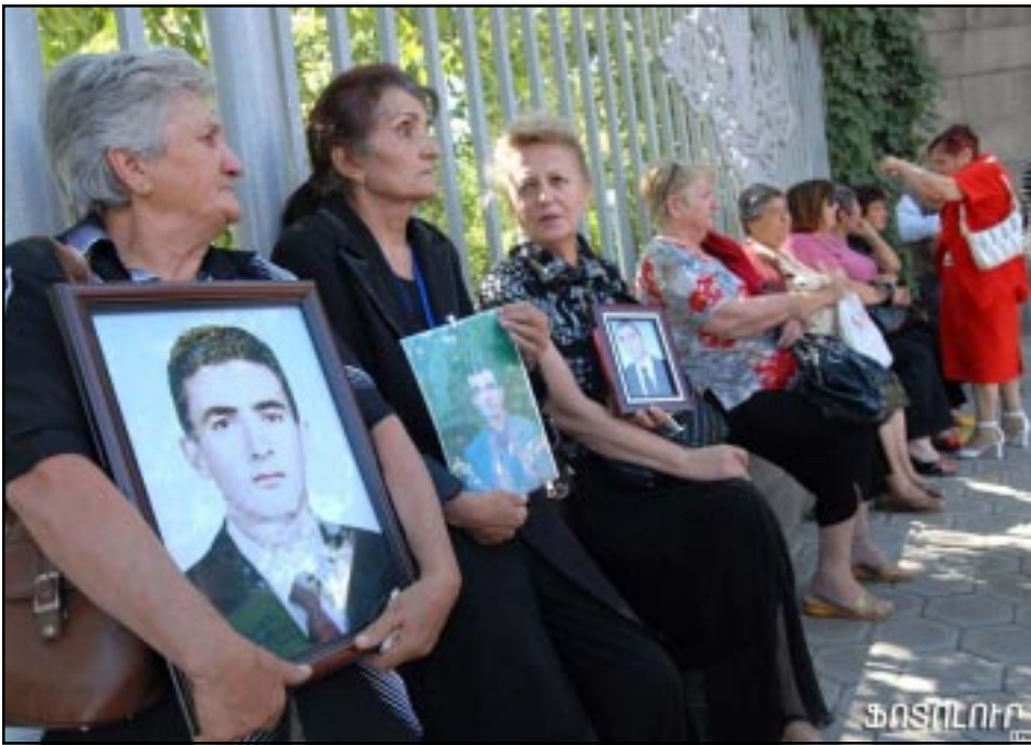
Relatives of the victims of the March 2008 unrest protest outside parliament

YEREVAN -- Armenia's Court of Appeals on Tuesday upheld the rejection of a lawsuit against law-enforcement authorities filed earlier this year by relatives of Armenians who died in the March 2008 post-election violence in Yerevan.