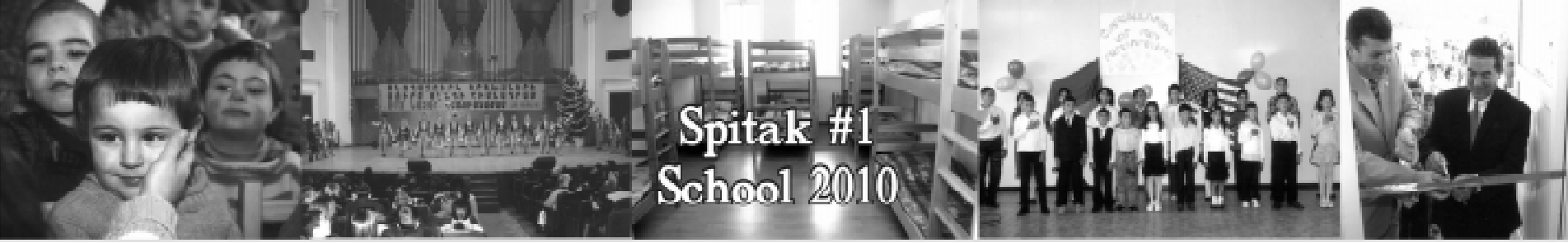
Spetak #1 School 2010

P.o. Box 250038 • Glendale, CA 91225 • Tel: 818-246-0125 • 818-239-6880 or 818-606-2070 E-mail: Forourkids99@gmail.com Non-profit Organization A Tax-exempt 501 (c)3 Charity