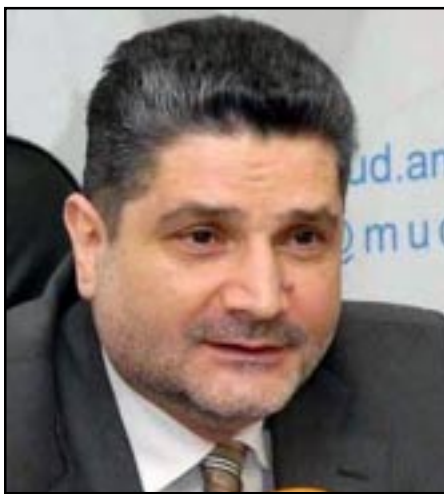
Հայաստանի վարչապետ Տիգրան Սարգսյան

Հայաստանի վարչապետ Տիգրան Սարգսյանն չորեքշաբթի 18-ին մի շարք կանխատեսումներ է հնչեցրել Ազգային ժողովում ընթացող բիզնեսային քննարկումների ընթացքում: Առաջին հերթին, ըստ վարչապետի, կը գերակատարուի եկամուտների 2010 թ. պլանը: «Այս պահին 40 մլրդ դրամի եկամուտների գերակատարում ունենք եկամուտների մասով: Հարկային մուտքերը վկայում են այն մասին, որ ունենք աւելի բարձր տնտեսական աճ, քան կանխատեսում էինք: Ամենայն հավանականությամբ՝ 2010 թ. բիզնեսի հիմքում դրուած ՀՆԱ աճի 1,2 տոկոս մակարդակը կը գերազանցենք 2 անգամ», - նշեց Տիգրան Սարգսյանը: