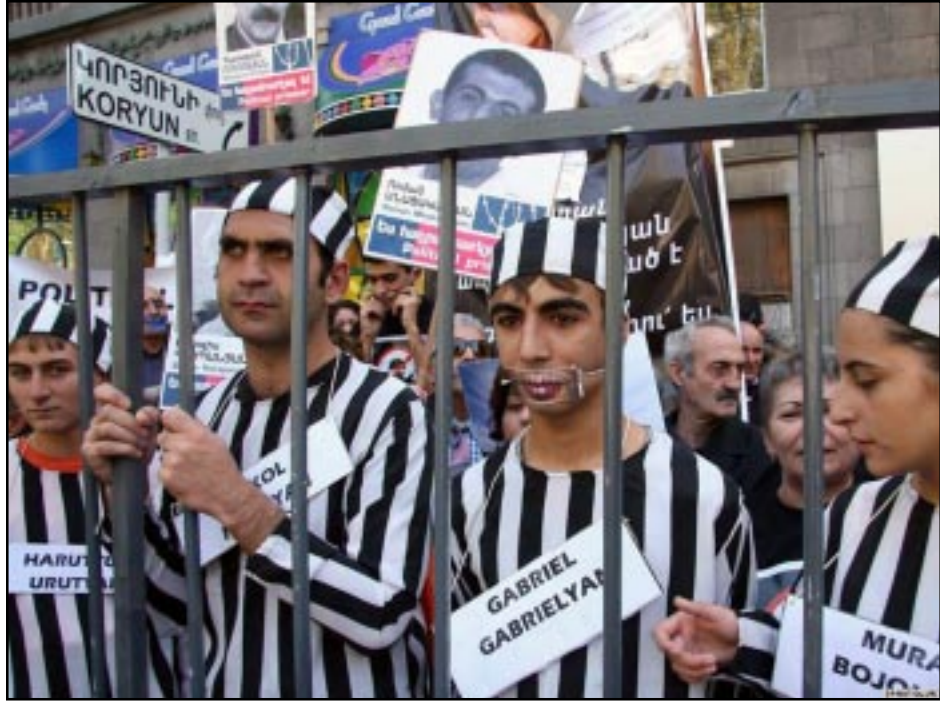
Ընդդիմադիր երիտասարդները կը պահանջեն քաղաքական բանտարկեալներու ազատ արձակումը

Շարունակուած էջ 1-էն էին՝ «Մարտի 1-ի» մեղաւորներու բացալալուծումը, անկախ հեռուստաընկերութեան վերաբացումը, արտահերթ նախագահական եւ խորհրդարանական ընտրութիւններու կայացումը եւ քաղաքական բանտարկեալներու ազատ արձակումը: