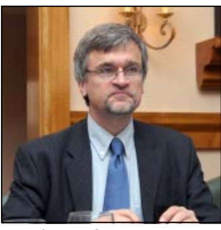
Եւրամիութեան յատուկ ներկայացուցիչ Փիթեր Սեմբերի

«Շատ ողբերգական կը լինի, եթե ղարաբաղեան հակամարտութիւնը չլուծուի եւս 40 տարուայ ընթացքում», - «Կոմերսանտ»-ի հարցազրոյցում յայտարարել է Հարաւային Կովկասում Եւրամիութեան յատուկ ներկայացուցիչ Փիթեր Սեմբերին՝ նշելով, որ Լեւոնային Ղարաբաղի հակամարտութիւնը «արդէն չափազանց երկար է շարունակուած, վտանգ է ներկայացնում տարածաշրջանի երկրներին համար, տարածաշրջանի հարեւանների համար»: