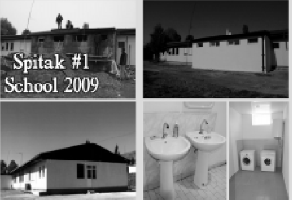
Spetak #1 School 2009