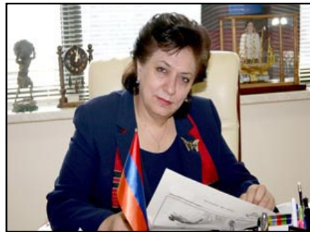
ՀՀ Սփիւռքի նախարար Հրանուշ Յակոբեան

Հրանուշ Յակոբեան այս առթիւ յայտարարած է, «Հանրապետութեան նախագահը, քննարկելով խնդիրը, եկել է եզրակացութեան եւ անում է առաջարկութիւն, որ այս պէտք է Հայաստանի պետական կառավարման համար