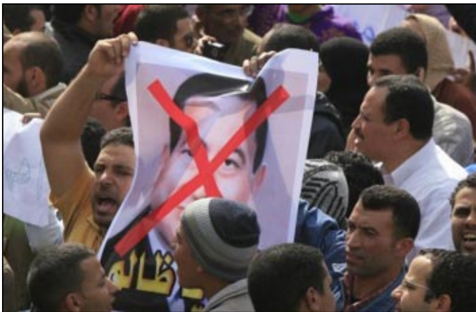
Գահիրէի մէջ ցուցարարներ կը պահանջեն Մուպարաֆի հրաժարականը

Այս օրերուն Եգիպտոսի մէջ տեղի կ'ունենան բողոքի հսկայ ցույցեր, պահանջելով նախագահ Հուսնի Մուպարաֆի հրաժարական: Ոստիկանութեան եւ ցուցարարներու միջեւ տեղի ունեցած բախումներու ընթացքին զոհուած են աւելի քան հարիւր հոգիներ: Բազմաթիւ վաչրերու մէջ սպահովութեան ուժերը հեռացած ըլլալով իրենց դիրքերէն, թաղամասերը պաշտպանելու նպատակով կազմուած են ժողովրդային խումբեր, որոնք կը հսկեն իրենց բնակարաններն ու գործատեղերը: Բազմաթիւ երկիրներ կը փորձեն իրենց քաղաքացիները դուրս բերել Եգիպտոսէն: