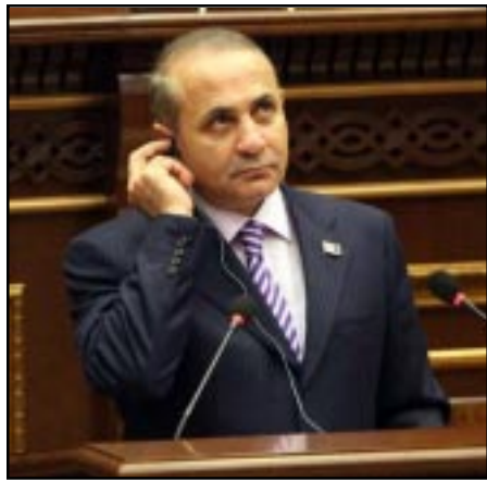
ՀՀ Ազգային ժողովի նախագահ Հովիկ Արրայասեան

Ազգային ժողովի նախագահ Հովիկ Արրայասեանը Երկուշաբթի, Փետրուար 7-ին յայտարարել է, որ եթէ կուսակցութիւնը (ՀՀԿ) որոշի, որ ինքը պէտք է հրաժարական տայ, «կ'ենթարկուի կուսակցութեան պահանջին»՝ շտապելով յաւելել, որ «նման պահանջ դեռեւս չկայ»: