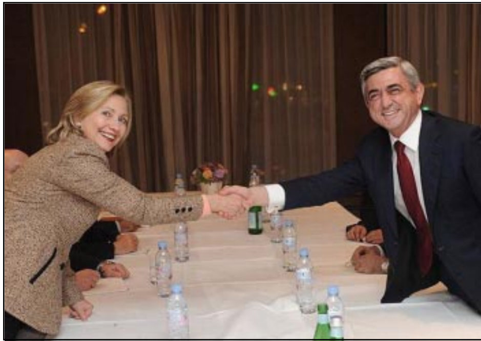
Հիլըրի Քլինթոն եւ Սերժ Սարգսեան Միւնիխի մէջ տեղի ունեցած հանդիպումի ընթացքին

Անվտանգութեան քաղաքականութեան հարցերով Միւնիխի մէջ տեղի ունեցած համաժողովի ծիրէն ներս, Հայաստանի գործող նախագահ Սերժ Սարգսեանի փետրուար 5-ին հանդիպումն ունեցած է Ամերիկայի Միացեալ Նահանգներու պետական քարտուղար Հիլըրի Քլինթոնի հետ: