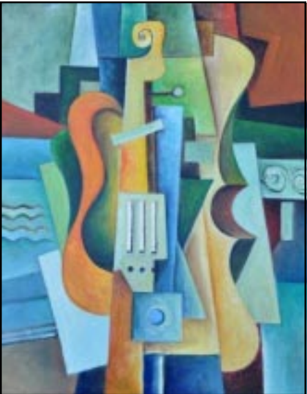
արտայայտել արուեստի ճամբով: «Երազի աղջիկը» երկար տարիներ կ'ապրի երիտասարդ եւ ապա հասուն մարդու ենթագիտակիցին