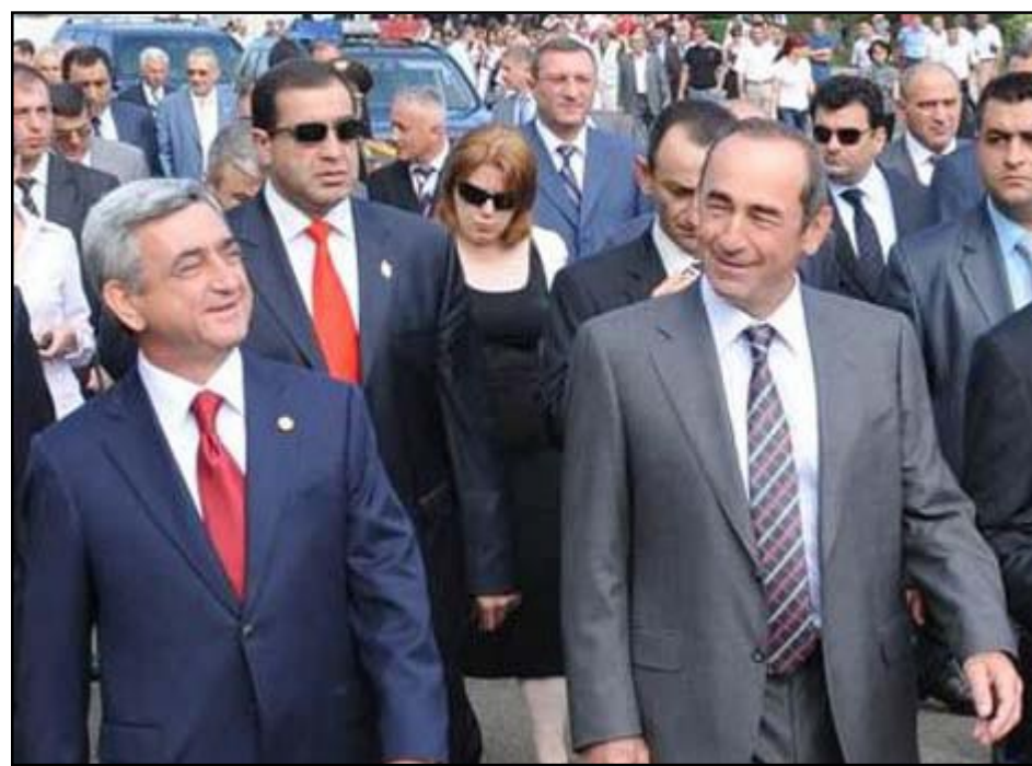
Sarkisian and Kocharian: Happy days are gone?

"But all this is history now, and it doesn't matter who could have done what but hasn't, or vice versa. What I find imperative now is the need for fair political competition in the upcoming parliamentary elections," he said.