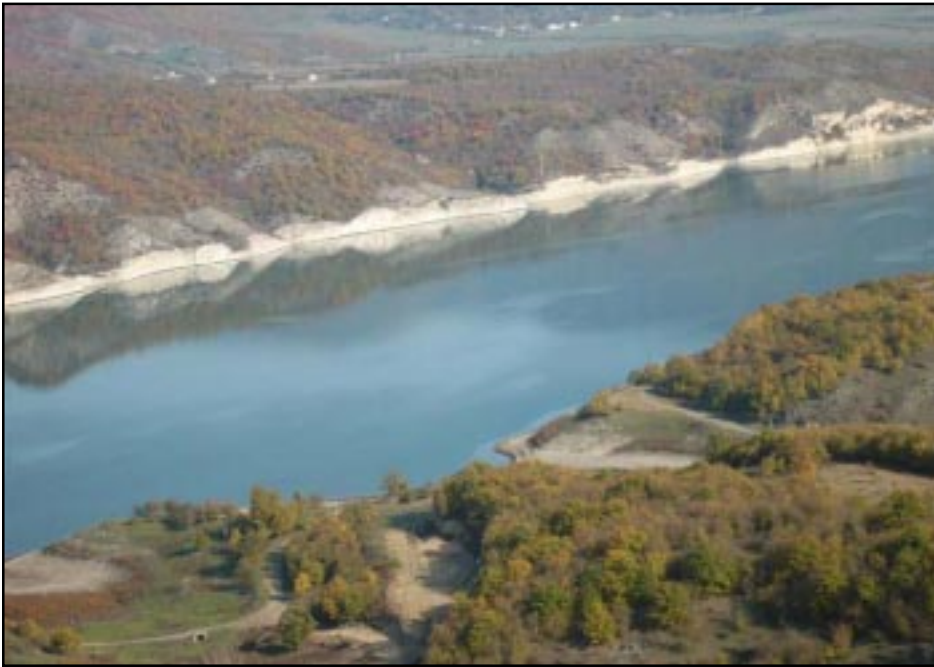
Sarsang reservoir in Karabakh feeds the territory's largest hydro-electric station

STEPANAKERT -- A group of entrepreneurs from Austria, the Czech Republic and Slovakia offered to invest millions of dollars in Nagorno-Karabakh's economy during a visit to Stepanakert on Friday.