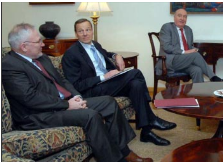
OSCE Minsk Group co-chairmen in Yerevan

YEREVAN -- The U.S., Russian and French diplomats co-chairing the OSCE Minsk Group met with Armenia's leaders on Wednesday at the start of a fresh round of regional shuttle diplomacy aimed at brokering a solution to the Nagorno-Karabakh.