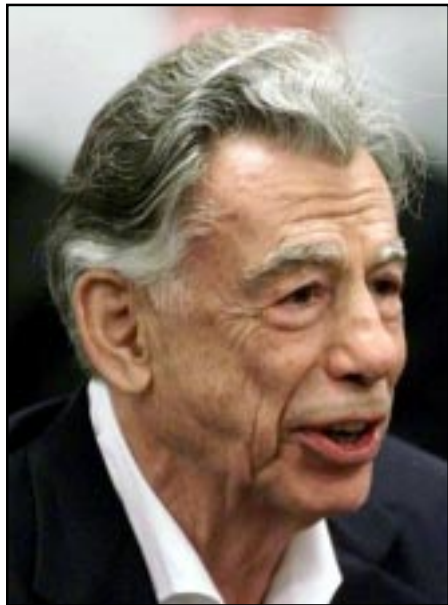
MGM's Kirk Kerkorian

The Lincy Foundation was established in 1989 to benefit charitable organizations in the U.S. and around the globe. Since it began, it has made major gifts of over $1.1 billion to schools, hospitals, scientific research