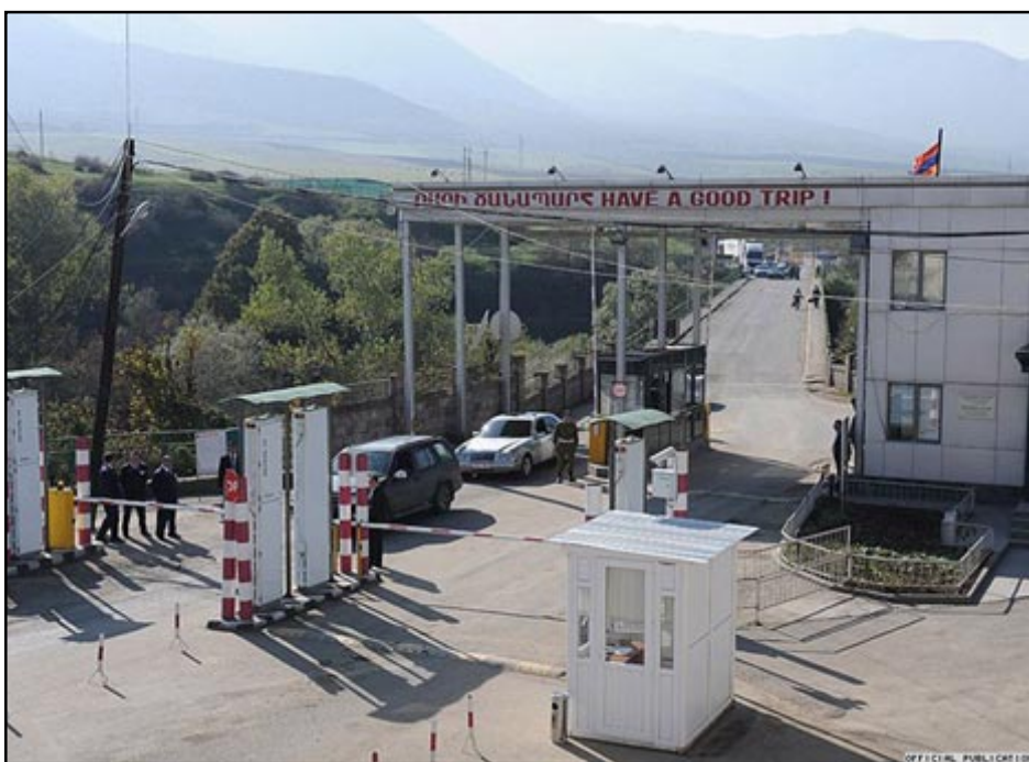
The Bagratashen border crossing with Georgia

YEREVAN -- Armenia and Georgian formalized on Wednesday plans to jointly operate Georgian-Armenian border crossings in an effort to facilitate and expand transport communication between the two neighboring states.