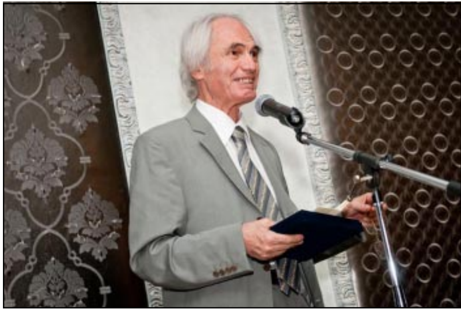
ՏՕՔԹ. Ա. ԳԱԶԱՆՃԵԱՆ

«ԼԱՐՔ» երաժշտանոցը, հաւատարիմ՝ միջազգային թատերաբեմէն ներս դասական եւ ժամանակակից նորարար երաժշտութիւնը տարածելու եւ անոր ստեղծագործութեան հասարակութեան ծանօթացնելու իր նուիրական առաքելութեան՝ արժանաւորապէս, շատուկ ճաշկերպութեան հանդիսութեամբ մը նշեց հայրենի տաղանդաշատ եւ սիրուած երգահան՝ Տիգրան Մանսուրեանի յոբելինական 72-րդ տարեդարձը, որ տեղի ունեցաւ 23 Յունուար 2011-թ. կ.վ. ժամը 6-ին, «Pandora on Green» շքեղ ճաշարանին մէջ, Փաստիւնա: