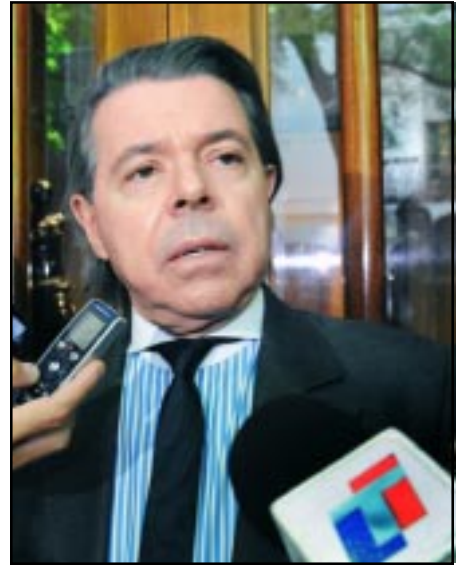
Դատաւոր Նորայրու Օիարպիթէ

եան դատարանի կայացուցած որոշումը որեւէ պատիժ չի նախատեսեր թուրքիոյ համար, սակայն ան կարելիութիւն կ'ընձեռէ հայկական կազմակերպութիւններուն՝ միջազգային հարթակներու վրայ եւ դատարաններու մէջ այդ որոշումը օգտագործել իբրեւ հիմք», - այս առթիւ կը գրէ թրքական «Հիւրընդէմ» թերթը: