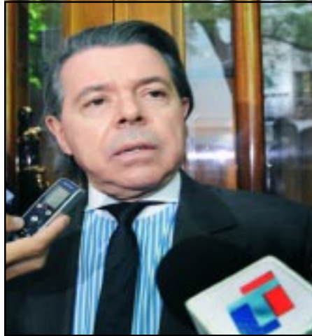
Judge Norberto Oyarbide

In 2002, Justice Oyarbide officially requested the Turkish authorities to transfer archive documents on