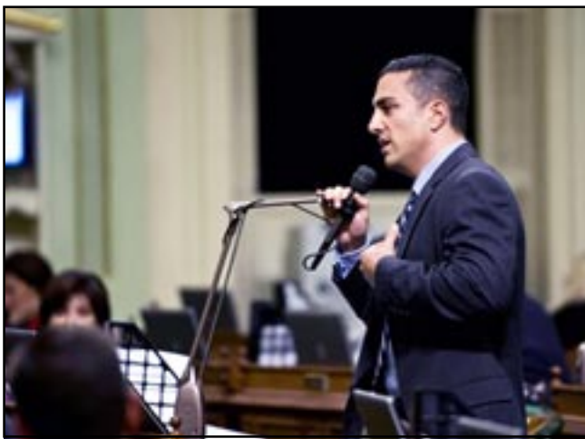
Assemblyman Mike Gatto

173, authored by Assemblyman Gatto, a substantive bill that can affect thousands of Armenians in California. Gatto's bill extends the time by which victims of the Armenian Genocide or their heirs or beneficiaries can file suit in California court against insurance companies for claims on policies purchased in Europe and Asia before the Armenian Genocide.