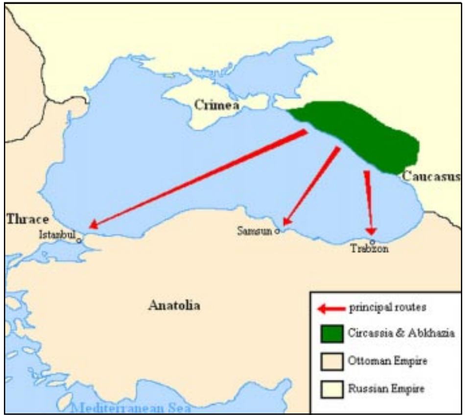
Չերքեզ ժողովրդի արտագաղթը Օսմանեան կայսրութիւն

Աշխարհաքաղաքական շահերի ծիրում ուղարկական Գոլդոնից յետոյ չերքեզական ցեղասպանութեան ակտուալացումն այս օրերին Կրեմլի համար Արեւմուտքից եկող հերթական բարոյական հզօր հարուածի տպաւորութիւն է թողնում: Այլ երկրների համար այն կարող է ծառայել նոր մարտահրաւէրների դէմ պայքարելու՝ Ռուսաստանի ունակութիւնը որոշելու ծանրաչափ եւ ցուցանել արտաքին քաղաքականութեան մեջ Կրեմլի ներկայիս հարաւորութիւնների սահմանը: Ուստի Մոսկուան ստիպուած է քաղաքական նոր լծակներ գտնել այս ցեղասպանութեան ճանաչման յետագայ տարածումը կանխելու համար: Յատկապէս, որ դեռեւս թարմ է աշխարհի աւելի քան երկու տասնեակ երկրների