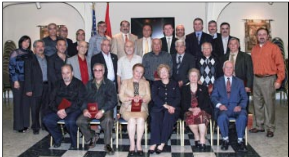
Մեծարանքի արժանացած վաստակաւոր ընկերները Ս.Դ.Հ.Կ.ի Կեդրոնական վարչութեան եւ շրջանի վարիչ Մարմնի ներկայացուցիչներուն հետ

Հարաւային Գալիֆորնիոյ Սոցիալ Դեմոկրատ Հնչակեան Կուսակցութեան «Փարամագ», «Սպաս Գիւլ» եւ «Արսէն Կիտուր» մասնաձեւերը կազմակերպութեամբ եւ Ս.Դ.Հ.Կ. Արեւմտեան Ամերիկայի վարիչ Մարմնի հովանաւորութեամբ, Ուրբաթ Մայիսի