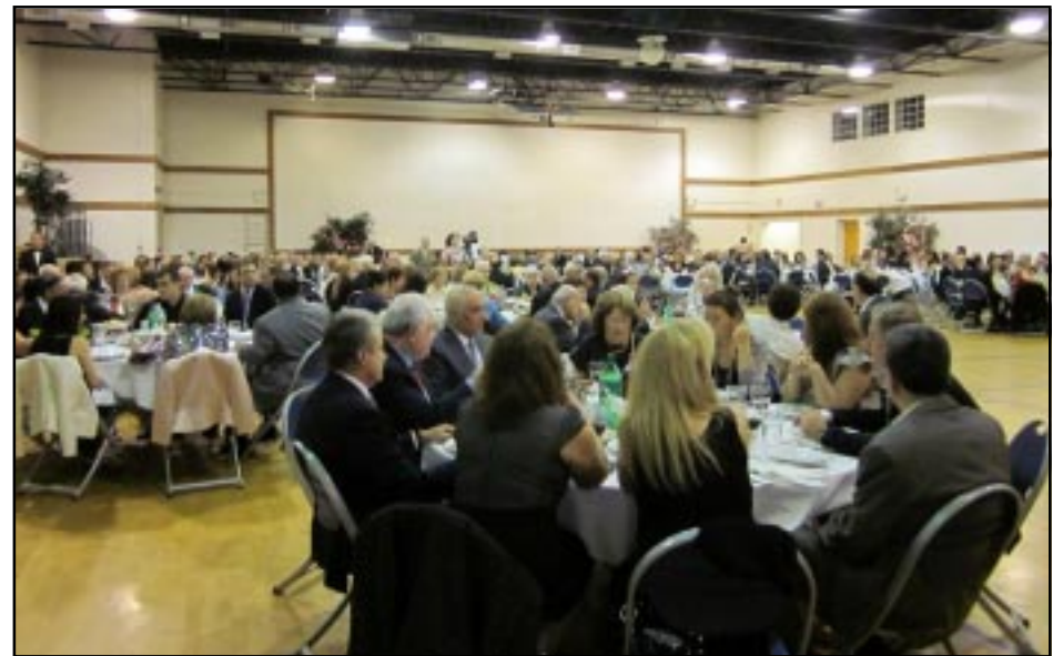
Guests gathered in the Hovnanian Armenian School Banquet Hall