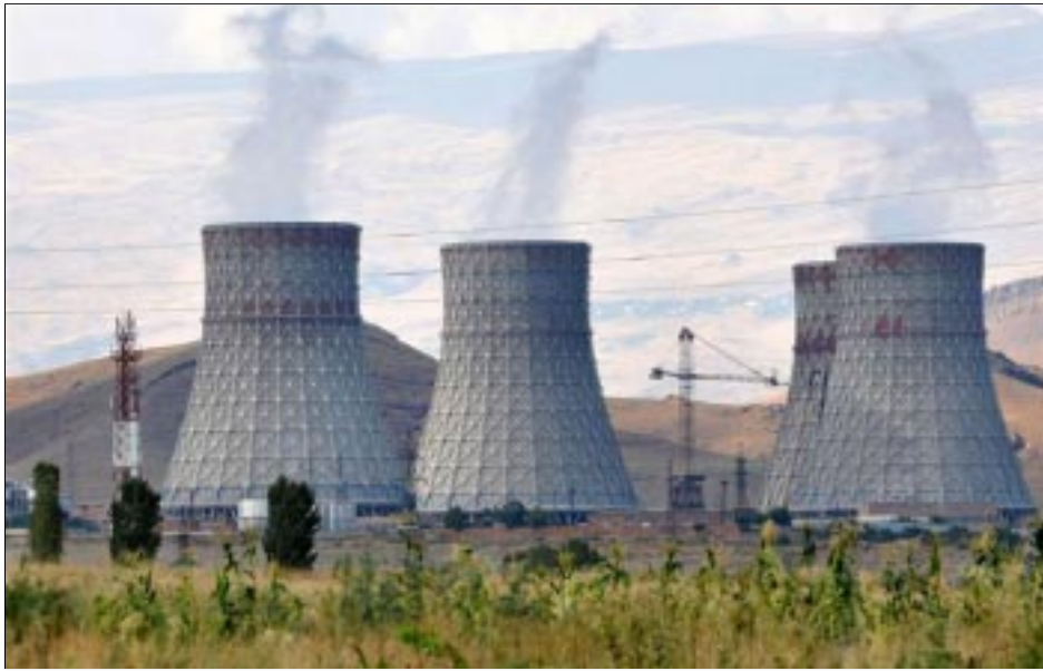
Metsamor nuclear power station

YEREVAN -- The International Atomic Energy Agency (IAEA) began a two-week inspection of the nuclear power station at Metsamor on Monday amid renewed domestic and international concerns about its safety fueled by the recent nuclear disaster in Japan.