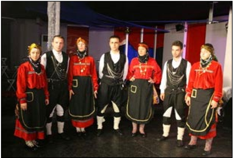
Համշէնահայեր իրենց ազգային տարագով

Օրերս Ռուսաստանի հայերու «Երկրամաս» թերթը գրած էր, որ Խրիւրզիստանի մէջ ապրող համշէնահայերու ընտանիքներ ցանկութիւն յայտնած են բնակութիւն հաստատել Լեռնային Ղարաբաղի մէջ: