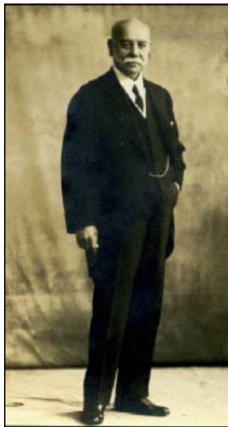
Sir Catchick Paul Chater

Anyone who has travelled in the Far East would have stayed in the chain of hotels that the Armenian Sarkies broth-