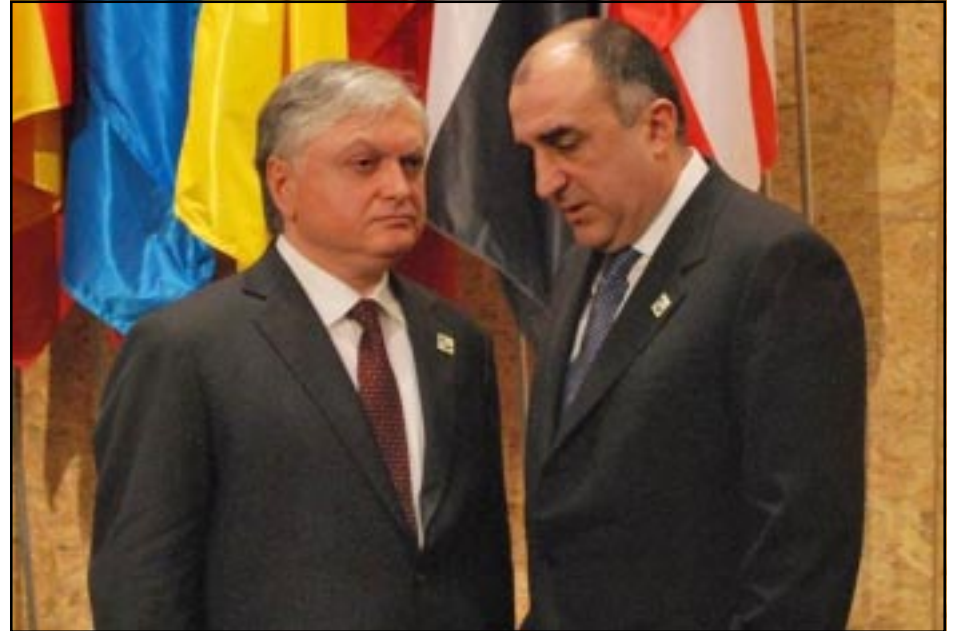
Edward Nalbandian and Elmar Mammadyarov in Moscow

MOSCOW -- Armenia and Azerbaijan reported significant progress towards the resolution of the Nagorno-Karabakh conflict following a meeting of their foreign ministers held in Moscow on Saturday.