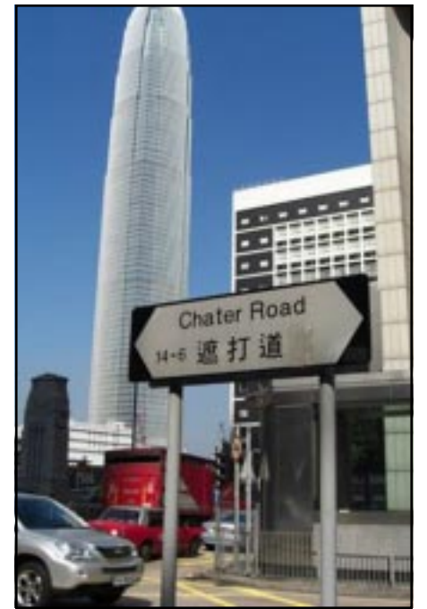
Chater Road, Hong Kong

community of immigrants from a small country in West Asia can make such a footprint in history in the rest of Asia, you begin to understand the importance and opportunities of globalisation.