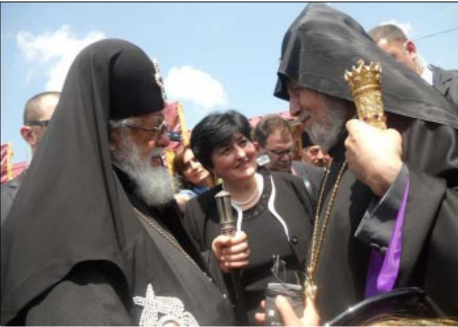
Գարեգին Երկրորդ եւ Իլիա Երկրորդ կաթողիկոսները Ախալցխա այցելութեան ժամանակ

Ամենայն Հայոց կաթողիկոս Գարեգին Երկրորդը եւ Վրաց կաթողիկոս Իլիա Երկրորդը Երկուշաբթի, Յունիս 13-ին այցելեցին Ախալցխա: Քաղաքի կենտրոնում 2 տարի առաջ թամարա թագուհու անուամբ կառուցուած եկեղեցու բակում հաւաքուել էին հազարաւոր հայեր ու վրացիներ՝ դիմաւորելու հոգեւոր առաջնորդներին: