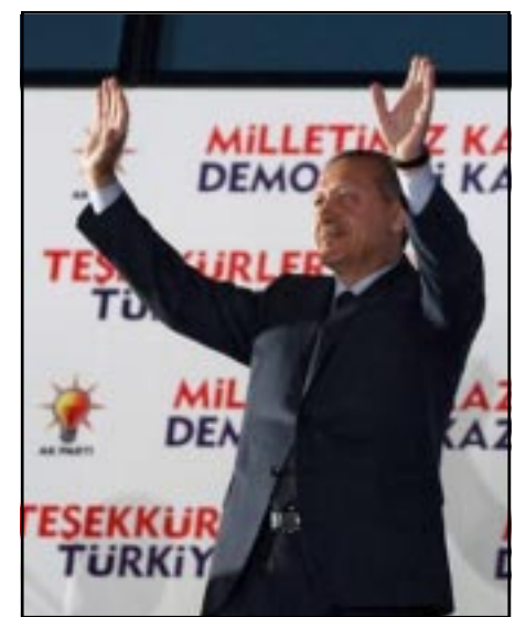
Erdogan celebrating his victory

lieved to have been planning to create a presidential system in which he would be elected president, cementing his already formidable power.