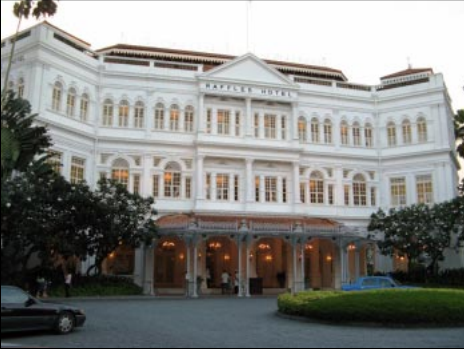
Raffles hotel, Singapore