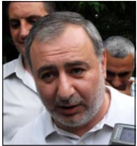
ՀՀՇ նախկին ղեկավար Արարատ Զուրաբեան

Արարատ Զուրաբեանը ՀՀՇ-ի վարչութեան նախագահի պաշտօնից հրաժարական էր տուել մէկ տարի առաջ՝ 2010 թուականի Յունիսին, բայց մնացել էր իբրեւ վարչութեան անդամ: Փաստօրէն ուղիղ մէկ տարի անց լքեց նաեւ