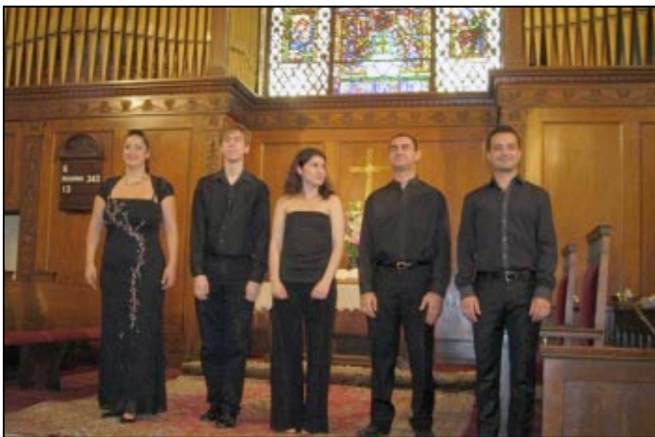
The young performers

One of the most eagerly anticipated events sponsored by the Armenian Missionary Association of America (AMAA) each year is the Spring Concert held at the Armenian Evangelical Church of New York. Benefitting the AMAA's Summer Camps in Armenia and Karabagh, the Concert was held on May 15 and featured a varied program of classical and Armenian music.