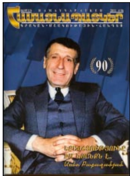
տեղութիւն բազմաբովանդակ եւ հետաքրքրական «Համայնապատկեր»-ին:

Հանդէսի առաջին էջի վրայ գետեղուած է տաղանդաւոր երգահան-ղաշնակահար Աննօ Բաբաջանեանի մեծադիր նկարը, երաժշտագէտի ծննդեան 90-ամեակի առթիւ: Հանդէսի այս թիւով ներկայացուած է մի քանի տասնեակ հայ գրողներ, նկարիչներ եւ մշակույթի անուանի գործիչներ, իրենց գունաւոր նկարներով եւ ստեղծագործութեանց ընտրանիով: «Համայնապատկեր»-ից տեղեկացանք, որ Յունիս 14-ին լրացել է նրա կորովի իմբբադիր, բանաստեղծ, հրապարակախօս Սարօ Գողակեանի (Ս. Գիւմրեցի) ծննդեան 60-ամեակը: Նորանոր յաջողութիւններ մեր սիրելի գրչակից ընկերոջը եւ յարա-