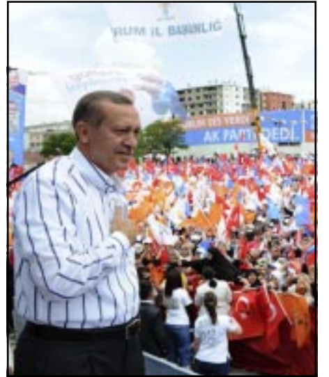
Նակցութիւնների նստել այլ ուժերի հետ՝ պահանջուող 367 քուէն ապահովելու համար: - «Իսկ ինքը այս ընտրութիւններից յետոյ ունի 327 պատգամաւոր»:

«Այս խորհրդարանական ընտրութիւններից յետոյ Թուրքիան մտնում է մէկ այլ փուլ, էլի ընտրական փուլ, որի նպատակն է անցկացնել սահմանադրական փոփոխութիւններ: Եւ եթէ նկատենք, իշխող կուսակցութիւնը, խորհրդարանական ընտրութիւններում չնայած յաղթանակ է տարել զգալի տոկոսով, սակայն չի ապահովել պատգամաւորական քուէների այն քանակը, որը թոյլ կը տար իրեն միանձնեայ կատարել եւ անցկացնել սահմանադրական փոփոխութիւնները», - ասաց նա՝ յաւելելով, թէ էրդողանը ստիպուած պէտք է լինի սահմանադրական փոփոխութիւնների անցկացման համար բա-