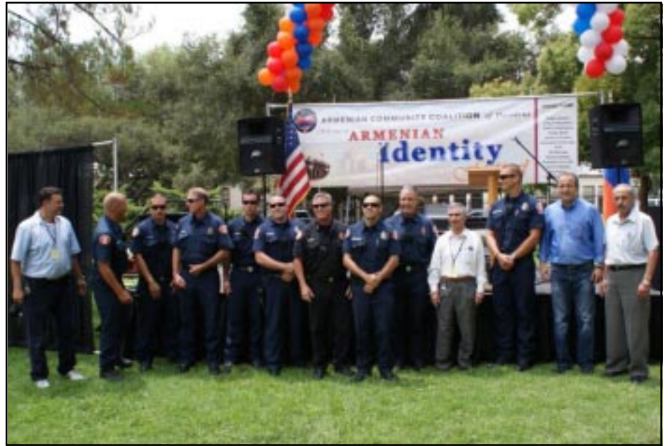
Pasadena Fire Department members and Armenian Community Coalition representatives