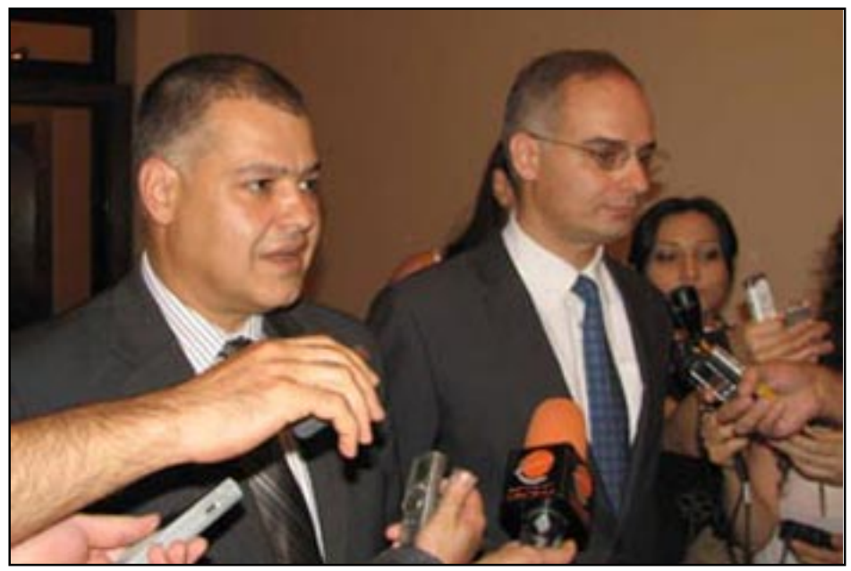
Դաւիթ Յարութիւնեան եւ Լեւոն Զուրաբեան

Երեքշաբթի, Օգոստոս 16-ին տեղի ունեցաւ Հայաստանի իշխանութիւններու եւ Լեւոն Տէր-Պետրոսեանի գլխաւորած Հայ Ազգային Գոնկրէսի (ՀԱԳ) միջեւ ընթացող երկխօսութեան 5-րդ փուլը: Երկու կողմերու ներկայացուցիչներուն միջեւ կայացած հանդիպումը տեւեց մօտ երկու ժամ: Աւարտին՝ իշխանութեան եւ ՀԱԳ-ի պատուիրակութիւններու ղեկավարները՝ Դաւիթ Յարութիւնեան եւ Լեւոն Զուրաբեան լրագրողներուն յայտնեցին, որ իրենք որոշած են հանդէս գալ համատեղ հաղորդագրութեամբ: