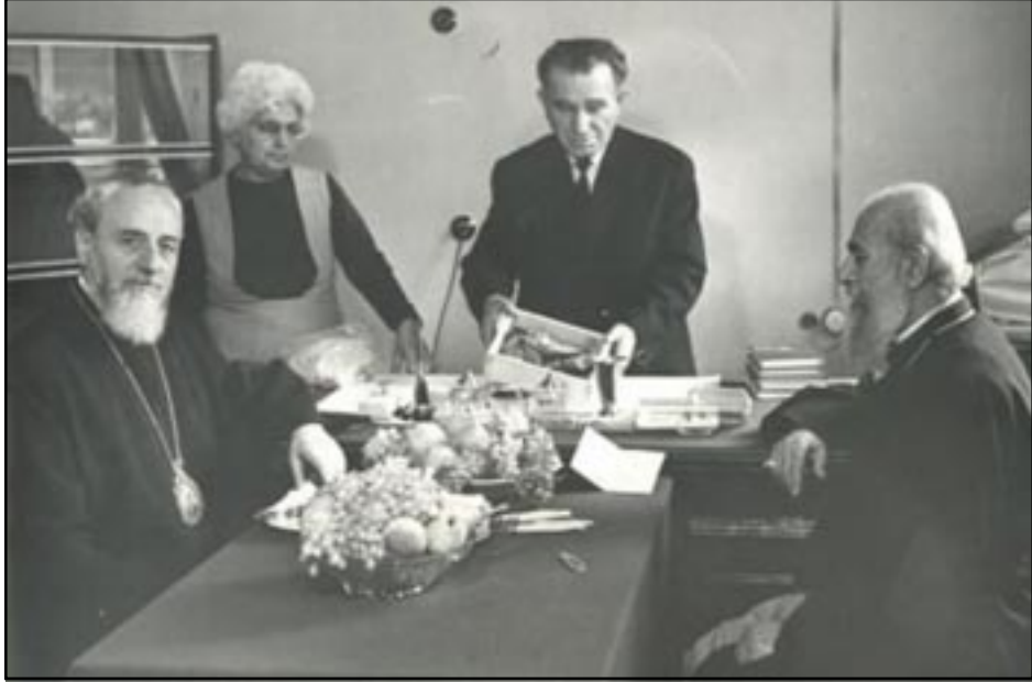
Վազգէն Ա. Կաթողիկոս եւ Պատրիարք Շնորհաբք Գալուստեան

Ոսկեան այս աշխատանքի ժամանակ բանուորի մը ձեռքին կը նկատէ գանկը, զոր կ'առնէ ու ցոյց տալով ժամանակուան պատրիարքին՝ Գարեգին արք. Խաչատուրեանին (որ ներկայ է ու կը հետեւի սիրելի ուսուցչին՝ Եղիշէ արք. Դուրեանի եղբոր, տիրամօր ու իր տիրամօր մասունքներու տեղափոխման աշխատանքին), կ'առաջարկէ «այս գանկը փոխանակ փոսին մէջ լքեալ փոշիացնելու» լաւերժացնել՝ նուիրելով Ս. Խաչ Դպրեվանքի գրադարանին, որպէսզի նոր սերունդը ունենայ «չօ-