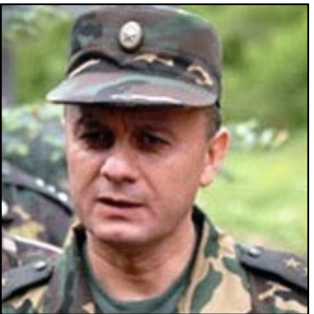
Հայաստանի պաշտպանութեան նախարար Մէյրան Օհանեան

րի ռեժիմի խախտումներն արդբեջանական կողմից ակնյայտօրէն աւելի շատ են, նախարարը պատասխանել է, թէ հայկական զինուած ուժերն իրենց առջեւ նպատակ չեն դնում խախտել հրադադարի ռեժիմը: