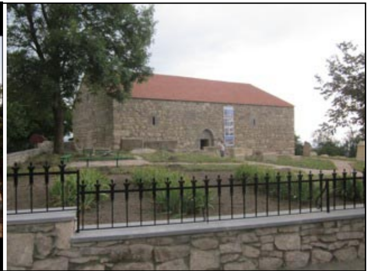
Sourp Astvatzatzin Church Before Renovation and after Completion

were performed by the clergy from the local town of Kapan.