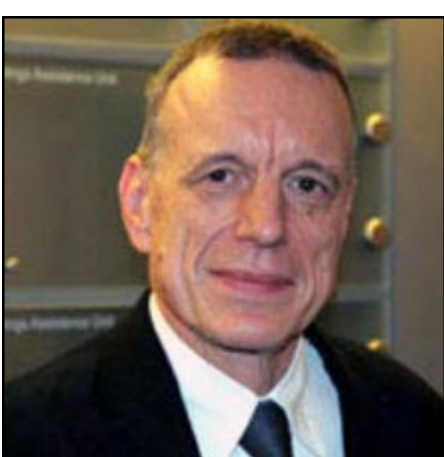
Գերմանիայի դեսպան Հանս Եոհեն Ծմիդտ

Հայաստանում Գերմանիայի դեսպան Հանս Եոհեն Ծմիդտն Հոկտեմբերի 3-ին, այցելել է Ազատութեան հրապարակ, որտեղ շուրջօրեայ հանրահաւաքներ է անցկացնում Հայ ազգային կոնգրէսը: Նա հանդիպել է Հայաստանի առաջին նախագահ Լեւոն Տէր-Պետրոսեանին: Նշենք, որ նախկինում եւս Գերմանիայի դեսպանն այցելել է ՀԱԿ-ի հանրահաւաքներին, ինչը տարբեր մեկնաբանութիւնների առիթ էր տուել քաղաքական շրջանակներում: