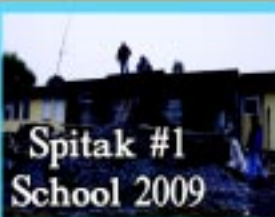
Spitak #1 School 2009