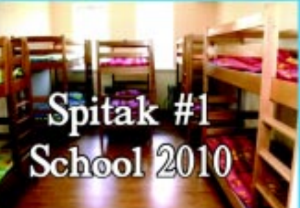
Spitak #1 School 2010

P.o. Box 250038 • Glendale, CA 91225 • Tel: 818-246-0125 • 818-239-6880 or 818-606-2070 E-mail: Forourkids99@gmail.com Non-profit Organization A Tax-exempt 501 (c)3 Charity