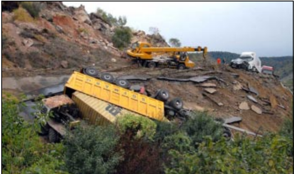
Տաւուշի մարզում տեղի ունեցած սողանքի հետեւանում անյայտ կորել է 7 անձ

Տաւուշի մարզի վանաձոր-Բագրատաշէն ճանապարհին, Հոկտեմբերի 2-ի երեկոյեան՝ ժամը 19.00-ի սահմաններում, տեղի ունեցած սողանքի հետեւանքով անյայտ կորել է 7 անձ: Տուժել է նաեւ 7 մարդ, ովքեր ստացել են առաջին բուժօգնութիւն եւ դուրս են գրուել հիւանդանոցից: