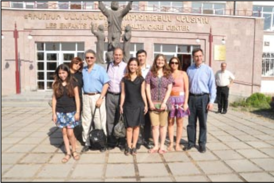
Group photo of AAHPO medical mission participants

In an effort to continue to contribute to the improvement of the healthcare system in Armenia, the Armenian American Health Professional Organization (AAHPO) organized its first medical mission that took place in conjunction with the Third International Medical Congress in Armenia