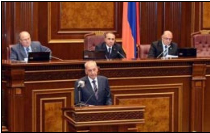
Լիբանանի Խորհրդարանի նախագահ Երայիկ Նունեանյ Ազգային ժողովէն ներս

Լիբանանը ցանկանում է, որպէսզի թուրքիան վաւերացնի հայ-թուրքական արձանագրութիւնները, երկու երկրների միջեւ յարաբերութիւնները կարգաւորուեն եւ տարածաշրջանում հաստատուի խաղաղութիւն: Այդ մասին Հոկտեմբերի 4-ին, Լիբանանի Խորհրդարանի նախագահ Սերժ Սարգսեանի հետ հանդիպման ժամանակ ասել է Լիբանանի Ազգային ժողովի նախագահ Նաբիհ Պըրրին: