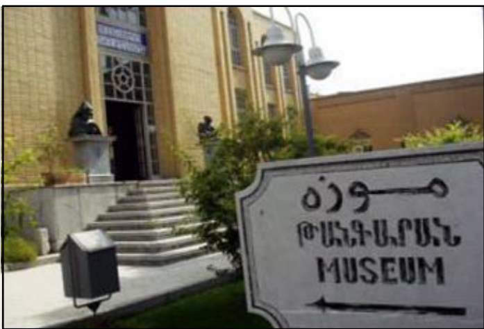
Նոր Ջուղայի Սբ. Ամենափրկիչ վանքի թանգարանը

Թեհրանի «Արաքս» շաբաթաթերթը գրում է, որ ոչ պաշտօնական տեղեկութիւնների համաձայն, ձերբակալուածները կասկածուում են Նոր Ջուղայի Սբ. Ամենափրկիչ վանքի թալանի գործով: Նոր Ջուղայում տարածուած լուրերի համաձայն, կասկածեալները մէկ միլիարդ ուիալ (մօտ 85 հազար ԱՄՆ դոլար) երաշխիքի դիմաց ազատ են արձակուել: