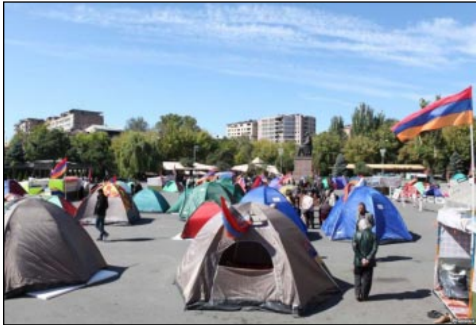
Նստացոյցի մասնակիցները Ազատութեան հրապարակի վրայ

Հոկտեմբեր 30-ին, Երեւանի Ազատութեան հրապարակին վրայ տեղի ունեցած Հայ Ազգային Գոնկորէսի (ՀԱԿ) հերթական հանրահաւաքէն ետք, Հայաստանի առաջին նախագահ Լեւոն Տէր-Պետրոսեան յայտարարեց որ, ընդառաջելով ինքնաբերական ժողովուրդի ցանկութեան, տեղի պիտի ունենայ մէկ շաբաթ տեւող նստացոյց՝ նոյն