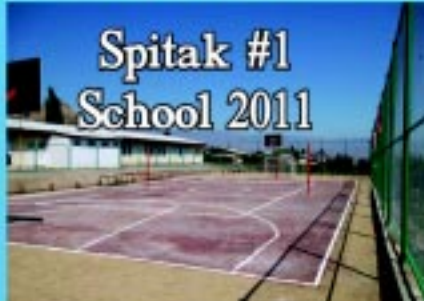
Spitak #1 School 2011