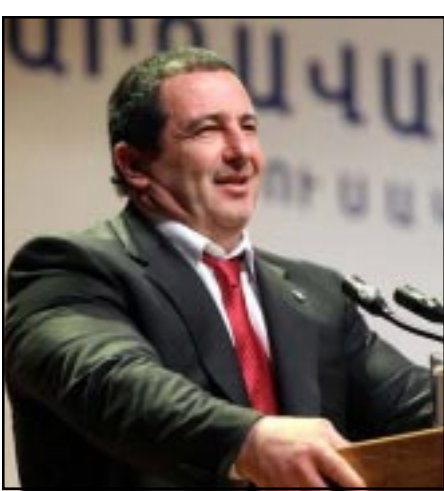
ԲՀԿ առաջնորդ Գագիկ Ծառուկեան

Ռոբերդ Քոչարեանը ունի քաղաքականութիւն վերադառնալու բարոյական եւ քաղաքական իրաւունքը: Այս մասին յայտարարել է Բարգաւաճ Հայաստան կուսակցութեան (ԲՀԿ) առաջնորդ Գագիկ Ծառուկեանն անդրադառնալով խօսակցութիւններին, թէ Ռուսաստանում Վլադիմիր Պուտինի նախագահ դառնալով պայմանաւորուած, քաղաքականութիւն կարող է վերադառնալ նաեւ Ռոբերդ Քոչարեանը: