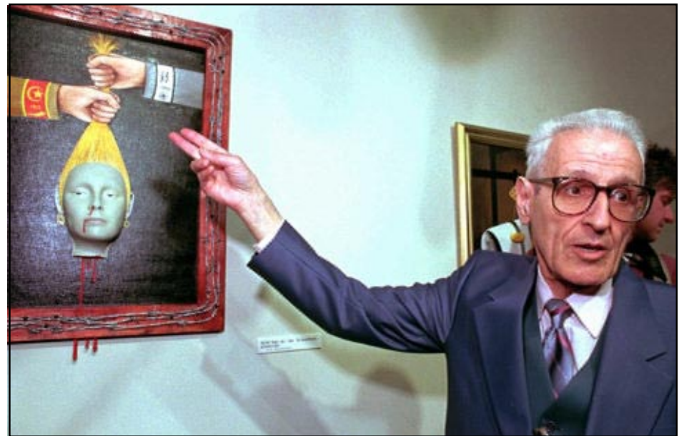
Dr. Jack Kevorkian with his painting, 'Genocide,' in 1997

Paintings, Sweaters, 'Death Machine' for Sale in NY