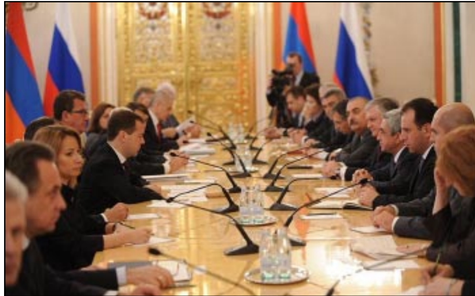
Հայաստանի եւ Ռուսաստանի պատուիրակութիւններու մասնակցութեամբ ընդլայնուած կազմով հանդիպում Վրեմլիմի մէջ

Հոկտեմբեր 24-ին, առաջին անգամ ըլլալով պետական այցով Մոսկուա այցելած Հայաստանի նախագահ Սերժ Սարգսեանի հետ կայացած միատեղ ասուլիսի ժամանակ, Ռուսաստանի նախագահ Դմիտրի Մեդվեդեւ վերահաստատած է Ռուսաստանի մտադրութիւնը՝ շարունակել աջակցիլ զարբաղեան հակամարտութեան կարգաւորման բանակցութիւններուն: