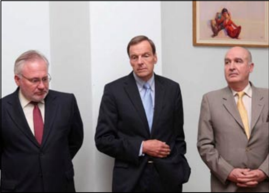
ԵԱՀԿ-ի Մինսկի խմբի համանախագահները. ձախեցն աջ՝ Իգոր Պոպով և Ռոբերտ Բրադկեյ, եւ Բեռնար Ֆասիէ

Չորս ամսուայ ընդմիջումից յետոյ ԵԱՀԿ-ի Մինսկի խմբի համանախագահներ Ռոբերտ Բրադկեյն, Բեռնար Ֆասիէն եւ Իգոր Պոպովը՝ ԵԱՀԿ-ի գործող նախագահի անձնական ներկայացուցիչ Անջէլ Կասպրշիկի ուղեկցութեամբ, Շաբաթ, Հոկտեմբեր 21-ին այցելեցին Լեռնային Ղարաբաղ: