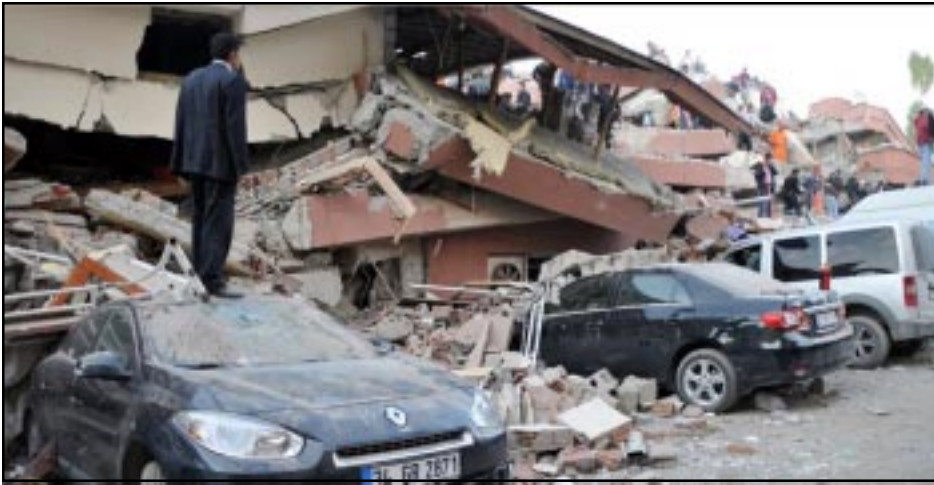
Թուրքիայ մէջ տեղի ունեցած երկրաշարժի պատճառաւ փլատակ շէնք մը

Վանի մէջ տեղի ունեցած երկրաշարժին պատճառաւ, բազմաթիւ երկիրներու շարքին Հայաստան եւս օգնութիւն առաջարկած է Թուրքիային, սակայն արժանացած է մերժումի: