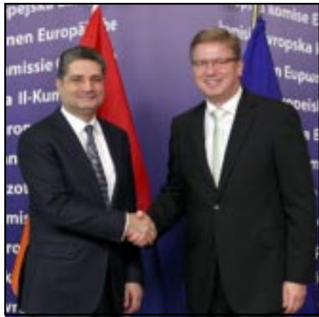
Տիրգրան Սարգսյան եւ Շտեֆան Ֆիլչի

Բրիտանացի կատարած այցի շրջանակներում, Հայաստանի վարչապետ Տիրգրան Սարգսյանը հանդիպել է ԵՄ ընդլայնման եւ Եւրոպական հարեւանութեան քաղաքականութեան հարցերով յանձնակատար Շտեֆան Ֆիլչին, ում հետ քննարկել է Հայաստանում իրականացող բարեփոխումների եւ համատեղ ծրագրերի վերաբերեալ հարցերը: