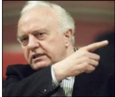
Վրաստանի նախկին նախագահ էդուարդ Շեւարդնաձէ

Յիշեցնենք, որ նախորդ շաբաթ Հայաստանի նախագահ Սերժ Սարգսյանը Վրաստան կատարած այցի ընթացքում իր գործընկեր Միխայիլ Սահակաշվիլիի հետ քննարկել է ճանապարհի շինարարութեանն առնչուող հարցեր: Նրանք պայմանաւորուել են արագացնել Հայաստանն ու Բաթումին միացնող ճանապարհի շինարարութեան գործ Շեւարդնաձէ. Հայերը կարող են փոխել Աջարիայի ժողովրդագրական իրավիճակը