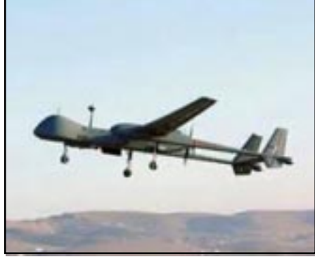
Հայկական արտադրութեան անօդաչու թռչող սարք

Լեռնային Ղարաբաղի Պաշտպանութեան բանակը գորավարժութիւնների ընթացքում հետախուզական տեղեկութիւններ հաւաքագրելու նպատակով աւանդական մեթոդներից բացի կենսականնօրէն օգտագործել է նաեւ անօդաչու թռչող սարքերի հնարաւորութիւնները: Այդ մասին NEWS.am-ին յայտնեց ԼՂՀ պաշտպանութեան բանակի մամուլի քարտուղար Սենոր Հասրաթեանը: