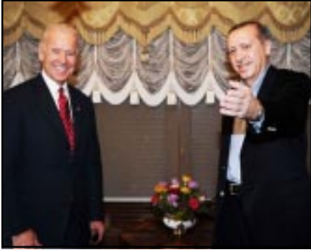
ՄՆ փոխնախագահ Պայտըն եւ Թուրքիոյ վարչապետ էրտողան

Միացեալ Նահանգներու փոխնախագահ Ճօ Պայտըն Թուրքիա կատարած այցի ընթացքին՝ հանդիպած է նաեւ Թուրքիոյ վարչապետ Ռեճէպ Թայիփ էրտողանի հետ: Հանդիպման ընթացքին Պայտըն յոյս յայտնած է, որ Թուրքիոյ խորհրդարանը յառաջիկայ ամիսներուն գործնական քայլեր պիտի ձեռնարկէ՝ հայ-թրքական արձանագրութիւններու վաւերացման գործընթացը առաջ մղելու ուղղութեամբ: