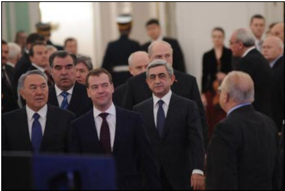
ՀԱՊԿ-ի անդամ երկիրներու ղեկավարները Մոսկուայի հանդիպումի ընթացքին

Աշխատանքային այցով Մոսկուայում գտնուող Նախագահ Սերժ Սարգսյանն Դեկտեմբեր 20-ին մասնակցել է Հաւաքական անվտանգութեան պայմանագրի կազմակերպութեան (ՀԱՊԿ) Հաւաքական անվտանգութեան խորհրդի նստաշրջանին: