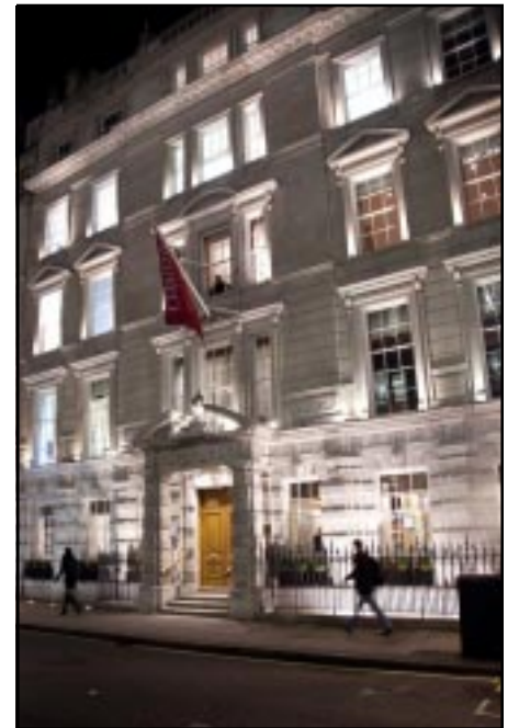
Christie's world headquarters in London

and disadvantaged families. Following the successful fundraising in Windsor Castle (2010) and Buckingham Palace (2011), three buildings in the vicinity