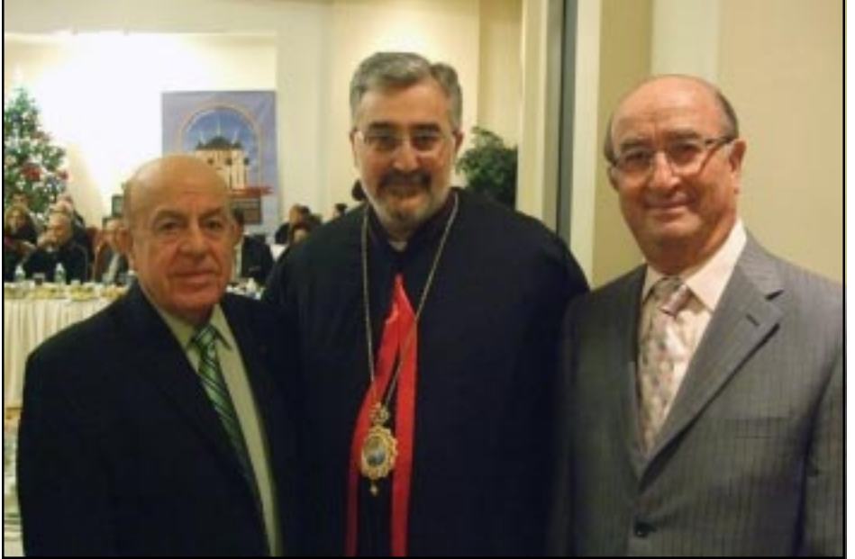
Արև. Միքայէլ Եպս. Մուրատեան Տօթ. Արշակ Գազանճեանի եւ Գաբրիէլ Մալոյեանի հետ

Այս օրերուն Հարաւային Գալիֆորնիա կը գտնուի Հիւսիսային Ամերիկայի Հայ Կաթողիկէ առաջնորդ Արհիպատիւ Միքայէլ Եպս. Մուրատեան: