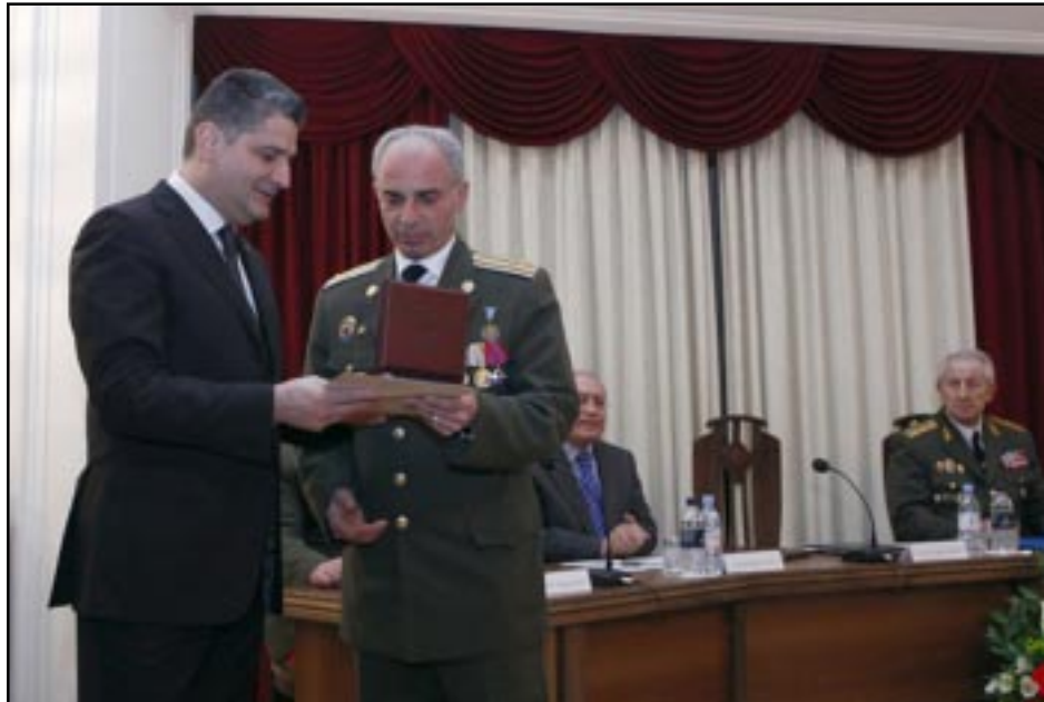
ՀՀ վարչապետ Տիգրան Սարգսյան պարգևներ կը յանձնէ ԱԱԾ ղեկավարներուն

Հայաստանի ազգային անվտանգութեան աշխատակիցներն «ԱԱԾ» Դեկտեմբերի 20-ին, նշել են իրենց մասնագիտական տօնը: