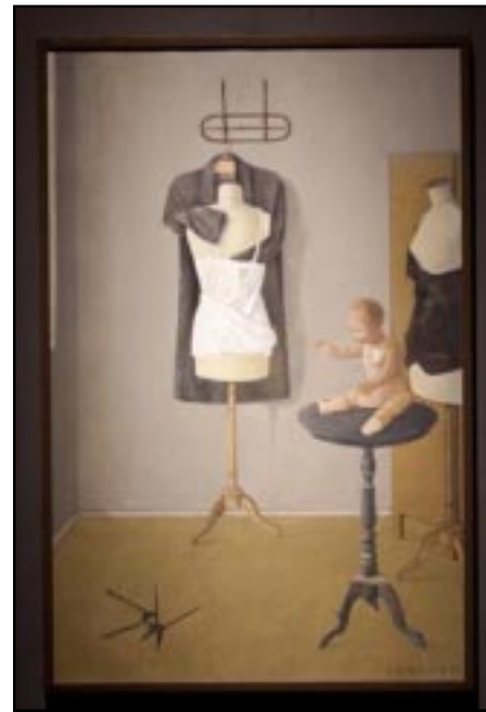
"The Family" by Hagop Hagopyan

'Yerevan My Love' is dedicated to preserving architecturally significant buildings in Yerevan and putting them to use to improve the life experience of disabled children, young people