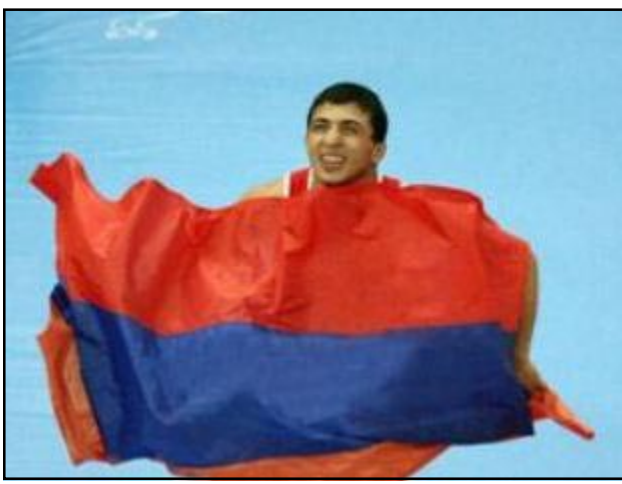
Հայաստանի 2011ի լաւագոյն մարզիկ Ռոման Ամոյեան

Մարզական լրագրողներու հանրապետական դաշնութեան հարցման արդիւնքներով՝ որոշուեցան մրցաշրջանի 2011ի տասը լաւագոյն մարզիկները: Հարցման մասնակցած են զանազան մարզային լրատուամիջոցներու 42 ներկայացուցիչներ: Իբրեւ արդիւնքով Հայաստանի լաւագոյն մարզիկ ճանչցուած է Եւրոպայի յունահունական ըմբշամարտի ախոյեան Ռոման Ամոյեան: