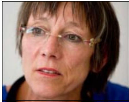
Բունդեսթագի անդամ Աննեթէ Գրոթի

Գերմանիայի Բունդեսթագի Մարզու իրաւունքների եւ հումանիտար օգնութեան յանձնաժողովում «Ձախ» կուսակցութեան խմբի ղեկավար Աննեթէ Գրոթի «News.am»-ի թղթակցի հետ գրոցում ներկայացրել է Հայոց ցեղասպանութեան ժխտումը քրէականացնող օրինագծի մասին իր տեսակետը: