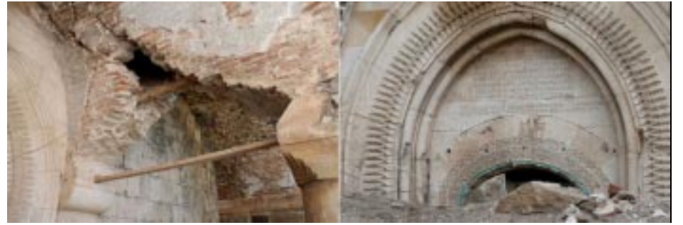
Serious damage outside porch evident (2010); Collapse of entire porch (2011 after earthquake)