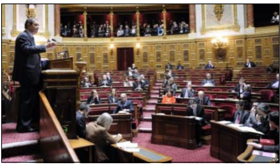
Յունուար 23-ին Ֆրանսայի Մերակոյտէն ներս ընթացող քննարկումներու ընթացքին

Թուրքիոյ վարչապետ Ռեճեփ Թայյիպ էրտողան յայտարարեց, որ վերոյիշեալ օրինագիծը ուղղուած է Թուրքիոյ պետութեան, Թուրք ժողովուրդի եւ Ֆրանսայի մէջ ապրող թրքական համայնքին դէմ: «Կ'ուզեմ բացայայտ կերպով յայտարարել, որ նման քայլերը շատ