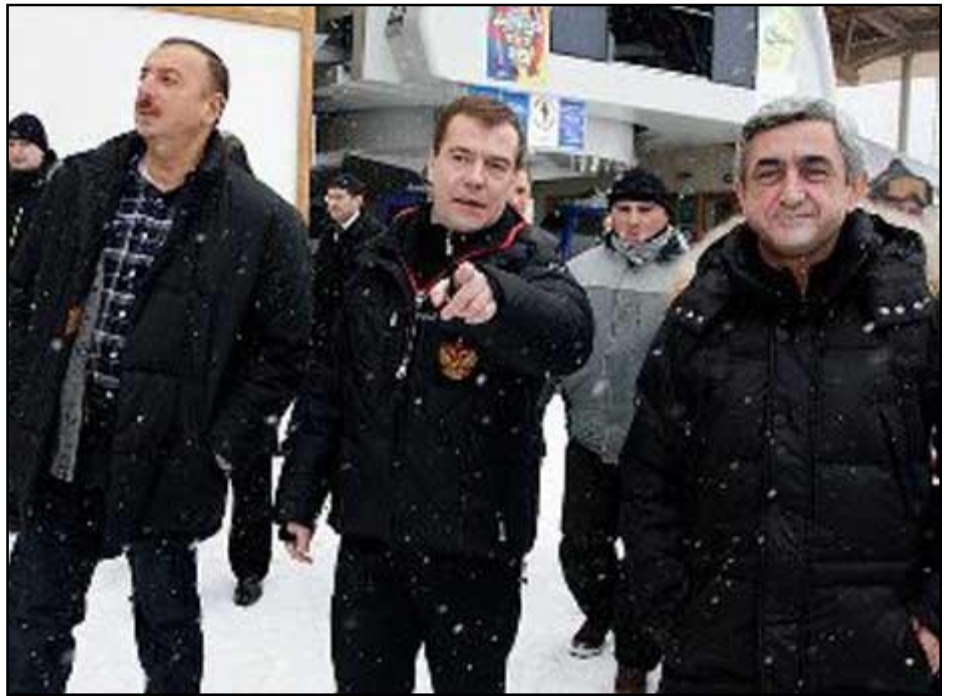
Ալիեւ, Մետվետեւ եւ Սարգսեան Սոչիի մէջ կայացած հանդիպման ընթացքին

Սոչիի մէջ Ռուսաստանի նախագահին մասնակցութեամբ եւակողմ հանդիպման ընթացքին, Հայաստանի եւ Ատրպէյճանի նախագահները յայտարարած են ծայրայեղ դիրքորոշումներէն հրաժարելու եւ իրենց դիրքորոշումները մերձեցնելու ջանքերը շարունակելու անհրաժեշտութեան մասին, Ռուսաստանի արտաքին գործոց նախարար Սերկէյ Լաւրովի այս խօսքերը կը փոխանցէ «Ռիա Նովոստին»: