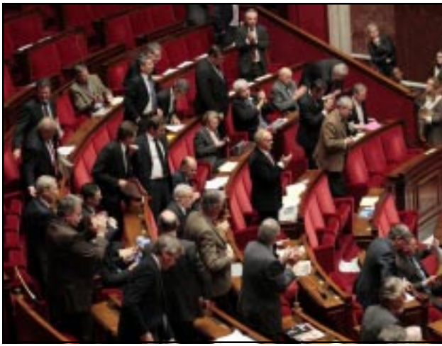
French National Assembly deputies applaud after adopting the Armenian Genocide bill

"Denial is the supreme insult to the collective memory that we share," he said. "It sweeps away the peoples' suffering and condemns the victims to be forgotten. Those who encourage it are fomenting hatred that could have been and should have been extinguished