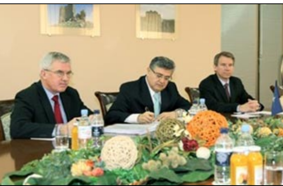
ՆԱԹՕ-ի ներկայացուցիչները Սէյրան Օհանեսանի հետ հանդիպման ընթացքին

Հայաստանի պաշտպանութեան նախարար Սէյրան Օհանեսան Փետրուար 29-ին, ընդունած է ՆԱԹՕ-ի գլխաւոր քարտուղարի օգնական, դեսպան Հուսէյն Դիրիոզի գլխաւորած պատուիրակութիւնը: ՀՀ Պաշտպանութեան Նախարարութեան մամուլի ծառայութիւնը այս կապակցութեամբ տեղեկացուց, որ պատուիրակութեան այցը կապուած է ՆԱԹՕ-ի կառուցներու համատեղ խումբի Հայաստան կատարած այցին, որ պաշտպանութեան նախարարութեան համապա-