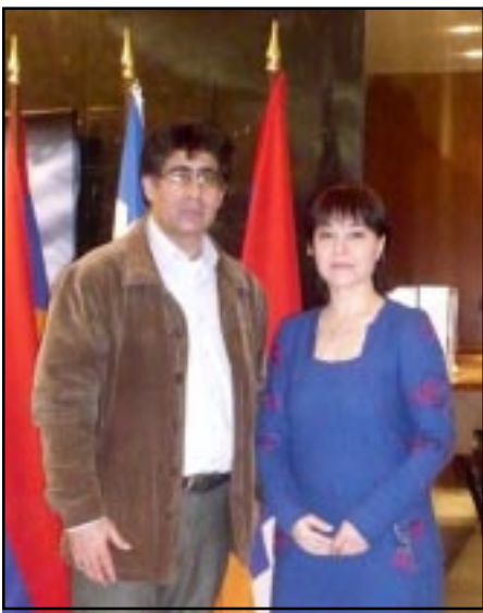
Հատ տարօրինակ թուաց դա, որ մարդիկ իրար ականջի փսփսում էին, «ինչ որ սարսափելի բան է կատարուել»: Որպէս վաւերագրող ցանկացայ գնալ եւ իմանալ թէ ի՞նչ է այդ իրականութիւնը:

- Այն ժամանակ ես արդէն ստացել էի իմ առաջին բարձրա- գոյն կրթութիւնը եւ ուսանում էի Կինեմատոգրաֆիայի համամիու- թեանական ինստիտուտի ասպիրան- տուրայում: 1990 թուին ես տեսայ Վրաստանի եւ Հարաւային Օսեթի- այի առաջին պատերազմը եւ հասցրեցի մի քանի ռեպորտաժներ ու նաեւ մի վաւերագրական ֆիլմ նկարել, բայց այդ պատերազմը չուտ աւարտուեց: Եւ յետոյ, երբ Մոսկուայում լսեցի Ղարաբաղեան հակամարտութեան, Գետաշէնի եւ Մարտունաշէնի բնակչութեան տե- ղահանման մասին, որոնց մասին այդ ժամանակ Մոսկուայում ոչինչ չէին ասում եւ հաղորդում, բացար- ձակապէս ոչ մի տեղեկատուութիւն չկար Գորբաչովեան ժամանակաշր- ջանի «զլաստնոստի եւ պերեստ- րոյկայի» ժամանակ, իմ համար