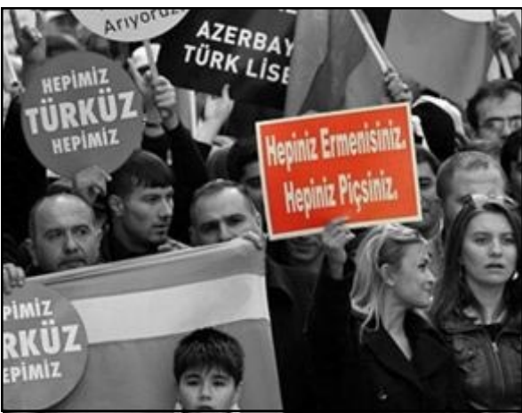
Հակահայ պատահարով ցուցարարներ՝ Պոլսոյ մէջ

Կիրակի, Փետրուար 26-ին Պոլսոյ մէջ տեղի ունեցած է Հակահայ ցոյց՝ նշելու համար Ղարաբաղեան պատերազմի ընթացքին խոշալուրի մէջ գոհուած 600 ատրպէյճանցիներու 20-րդ տարելիցը: