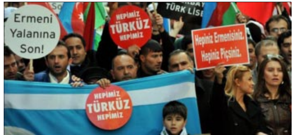
Far right protest sign: "You Are All Armenian, You Are All Bastards"

More than 10,000 Turks have rallied in Istanbul on the anniversary of the liberation of Khojalu by Armenian forces during the Nagorno Karabakh liberation war in 1992. Azerbaijanis claim that hundreds of civilians were killed, in what they describe as "genocide," while fleeing the village.