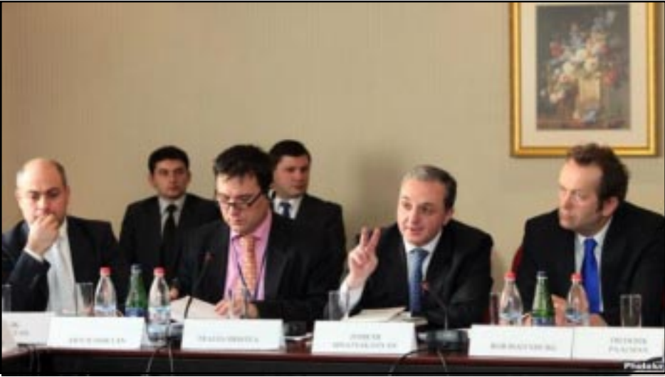
Եւրոպայի եւ Հայաստանի միջեւ Վիզայի դիւրացման բանակցութիւններու մասնակիցները Երեւանի մէջ

«Եւրամիութիւնը միշտ էլ նշել է, որ առաջիկայ ընտրութիւնները պէտք է դիտարկուեն իբրեւ Հայաստանի համար հիմնական ստուգում՝ Հայաստան-Եւրամիութիւն հետագայ յարաբերութիւնների առումով: Սակայն սպասուող խորհրդարանական, ապա եւ նախագահական ընտրութիւններն այսօր մեկնարկած բանակցութիւնների հետ կապելը՝ ենթադրելով, թէ դրանք կարող են ազդել բանակցութիւնների ընթացքի վրայ, շահարկումների ոլորտից է», - պատասխանելով «Ազատութիւն» ռադիոկայանի հարցին՝ յայտարարեց Հայաստանում Եւրամիութեան պատուիրակութեան ղեկավար, դեսպան Տրաիան Հրիստեան Հայաստանի ու Եւրամիութեան միջեւ մոտաքի արտոնագրերի դիւրացման եւ ռեադմիսիայի համաձայնագրերի շուրջ մեկնարկած բանակցութիւնները՝ Մնացականեանը չափազանց կարեւոր դնալով զանազան չափերի քաղաքական նշանակութիւնը: