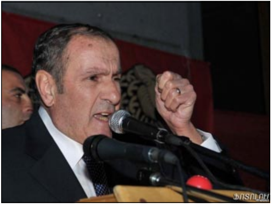
Լեւոն Տէր-Պետրոսեան ելոյթ կ'ունենայ հանրահաւաքի մը ընթացքին

«Ազատութիւն» ռադիոկայանի հարցազրոյցը Հայ ազգային կոնգրէսի առաջնորդ Լեւոն Տէր-Պետրոսեանի հետ: