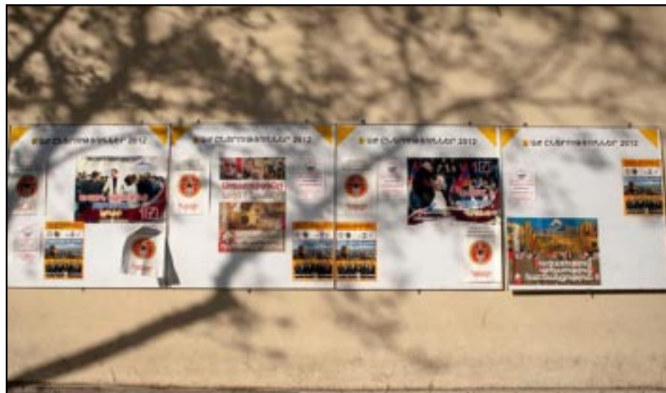
Ընտրական ցուցապաստառներ Երեւանի պատերուն վրայ

Հիմնական պայքարը կ'ընթանայ երեք ուժերու՝ Սերժ Սարգս-