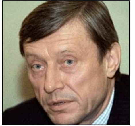
ՀԱԿՊ ԳԼԽԱԼՈՐ ՔԱՐՏՈՒԳԱՐ ՆԻՔՈՂԱ ՊՈՐՏՈՒԺԱ

Եթէ Ատրպէյճան ոչ բարեկամական քայլեր ձեռնարկէ Հայաստանի նկատմամբ, Հաւաքական Անվտանգութեան Պայմանագրի Կազմակերպութիւնը (ՀԱՊԿ) անհրաժեշտ օգնութիւն պիտի տրամադրէ Հայաստանին: Այս մասին Երեւան-Ասթանա-Քիւն-Քիշնեւ տեսակաժողովի ժամանակ ըսած է ՀԱԿՊ Գլխաւոր քարտուղար Նիքոլա Պորտիւժա: