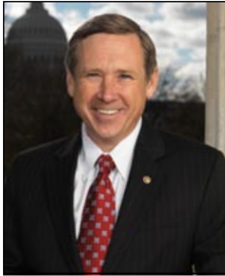
Senator Mark Kirk

Sources familiar with the Bill noted that funding for Armenia in terms of economic and military assistance mirrors the President's request, which included the following: $27.22 million in Economic Support Funds, $2.5 million in Global Health Programs, and $2.82 million in International Narcotics Control and Law Enforcement. The Administration's request also called for $2.7 million in Foreign Military Financing (FMF) for Armenia and allocates $600,000 each in International Military Education Training (IMET).