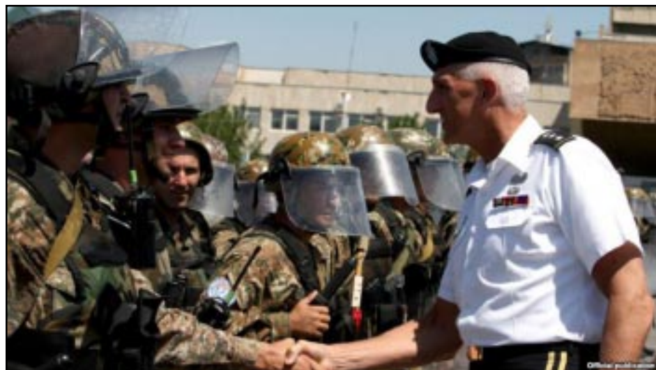
The commander of the U.S. Army in Europe, Lieutenant General Mark Hertling, inspects Armenian peacekeeping troops in Yerevan

YEREVAN -- The commander of U.S. Army troops stationed in Europe, Lieutenant General Mark Hertling, met with Armenia’s top military leaders and discussed growing U.S.-Armenian military ties during a visit to Yerevan on Wednesday.