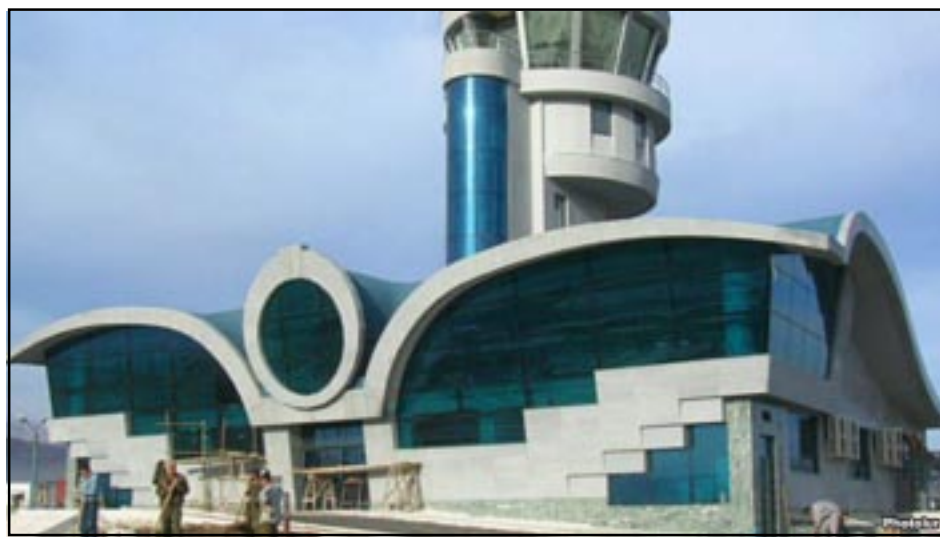
New Karabakh airport building

BAKU/YEREVAN -- Azerbaijan appeared to have renewed on Monday its threats to shoot down civilian aircraft that would carry out flights between Armenia and Nagorno-Karabakh without its permission.