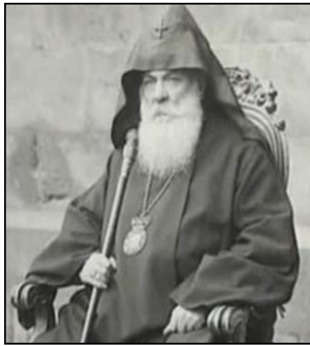
հարկ ըլլայ կեանքս տալ անոր», այն պահուն երբ հայ գուևդի գորավարը էջմիածին գալով կը թելադրէր Գեորգ Ե. Կաթողիկոսին որ ապահովութեան համար Սեւանայ վանքը փոխադրուէր առժամաբար:

Այդ կը նշանակէր մէկ բան. Մայր Աթոռը ստիպուած էր հեռատեսութեամբ, իրապաշտօրէն, իմաստութեամբ եւ ներքին արիութեամբ դիմագրաւելու Խորհրդային կարգերու ստեղծումն ու ներթափանցումը, նկատի առած Գեորգ Ե. Կաթողիկոսի վճռական պահերը երբ Մարդարապատի կռիւը տեղի կ'ունենար միայն երեք տարի առաջ, 1918-ին, ու հայրողիք Հայրապետի օրհնութեամբ կը վտարէին թուրք թշնամին հայրենի հողէն, էջմիածնէն ու Երեւանէն, որոնց դռներուն հասած էր թշնամին: Հայրապետը այն ատեն ըստ էր «Կը մնամ այստեղ ու Մայր Աթոռի առաջ եւ պաշտպան կը կանգնիմ եթէ նոյնիսկ