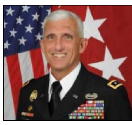
Զօրավար Մարք Հարթլինկ

Յուլիս 18-ին տարածաշրջանային այցի շրջագիծէն ներս Հայաստանի Հանրապետութիւնն այցելեց Եւրոպայի մէջ Միացեալ Նահանգներու ցամաքային զօրքերու հրամանատար զօրավար Մարք Հարթլինկի գլխաւորած պատուիրակութիւնը: