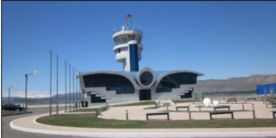
Ստեփանակերտի օդանավակայանի գլխաւոր շէնքը