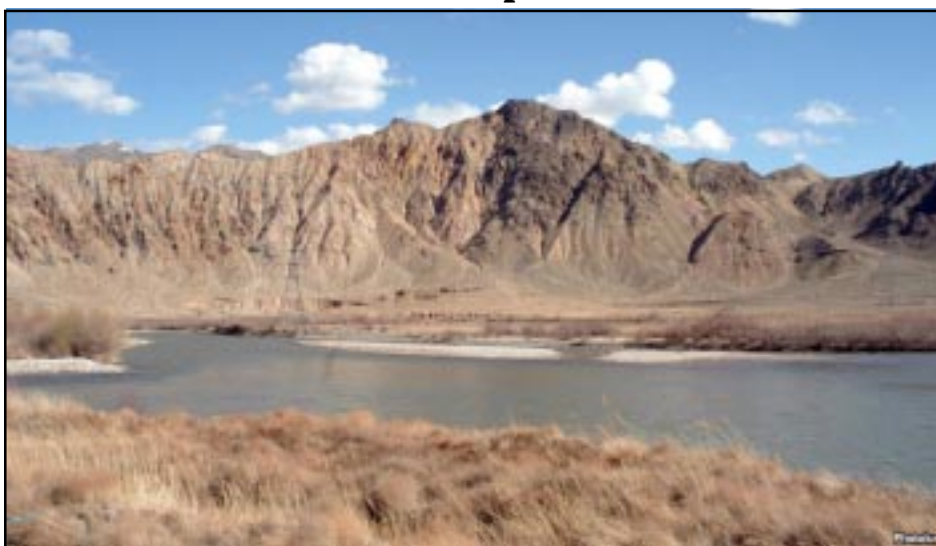
The Arax river separating Armenia and Iran.

YEREVAN -- Armenia and Iran fleshed out on Tuesday plans for the establishment of a natural reserve on either side of their border, which is meant to symbolize and cement growing cooperation between the two neighboring states.