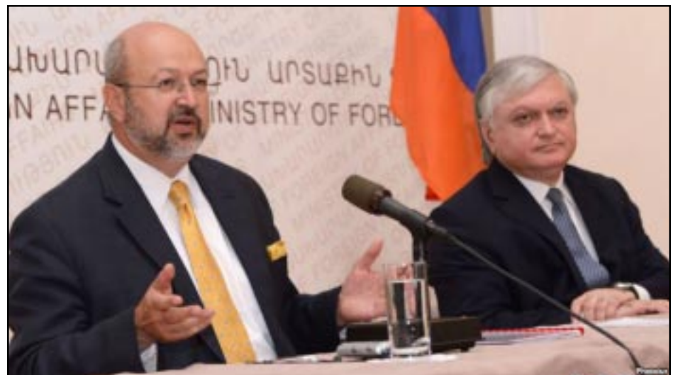
Lamberto Zannier and Edward Nalbandian

ARMENIA -- The Organization for Security and Cooperation in Europe on Thursday renewed its calls for the parties to the Nagorno-Karabakh conflict to withdraw snipers from the frontlines and agree to joint investigations of growing truce violations there.