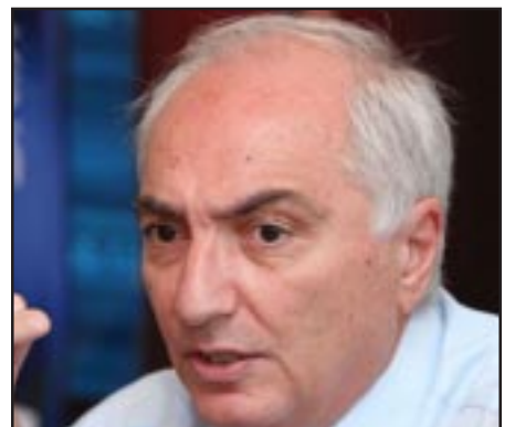
Հայաստանի Դեմոկրատական կուսակցութեան նախագահ Արամ Սարգսեան

«Եթէ այսօր իշխանութիւնը ցոյց տայ, թէ ի՞նչ փոփոխութիւններ է անում, ի՞նչ է արդէն սկսել անել ու դրա հետեւանքով ի՞նչ կը փոխուի երկրում, կարծում եմ, էլ ոչ մի հարց չի առաջանայ: Այդ ժամանակ, ինչո՞ւ է՞ ՀԴԿ-ն եւս կը սատարի գործող նախագահին: 20 տարուայ ընթացքում բոլոր հանրահաւաքային շարժումներով անցել ենք, բայց այս պահին չեմ տեսնում հնարաւորութիւն, որ այնպիսի մի ալիք բարձրանայ,