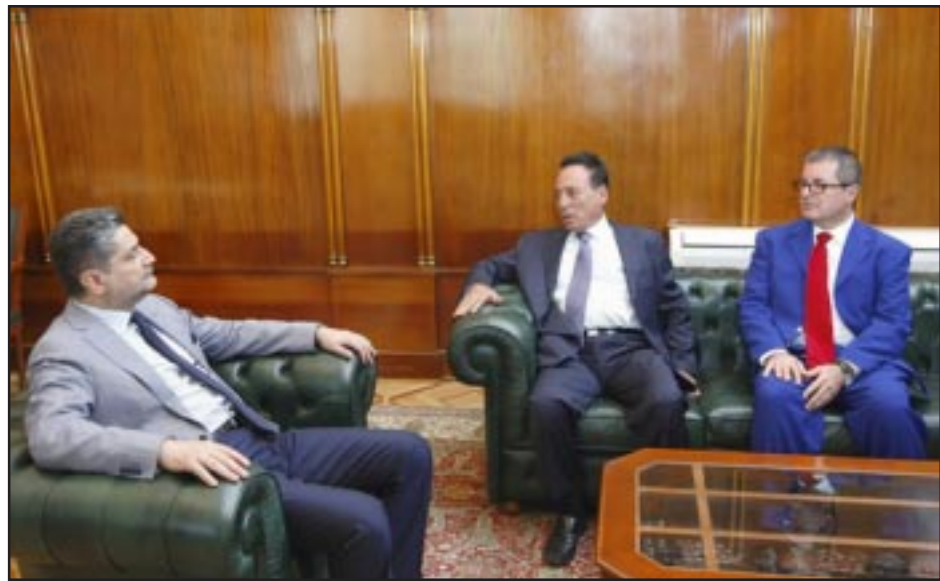
Ձախէն աջ՝ Վարչապետ Տիգրան Սարգսեան, Սեդրակ Անէւեան եւ Վազգէն Գալթագինեան

Օգոստոս 17-ին Հայաստանի Վարչապետ Տիգրան Սարգսեան հանդիպում ունեցաւ Սոցիալ Դեմոկրատ Հնչակեան Կուսակցութեան Կեդրոնական վարչութեան ատենապետ Սեդրակ Անէւեանի եւ զիւանի անդամ Վազգէն Գալթագինեանի հետ: Հանդիպման ընթացքին քննարկուեցաւ յատկապէս Սուրիայէն Հայաստան տեղափոխուած հայերուն առնչուող հարցերը: Տիգրան Սարգսեան անդրադարձաւ Սուրիոյ մէջ տիրող իրավիճակին եւ ներկայացուց այնտեղի հայ համայնքի անվտանգութեան ապահովման հետ կապուած կառավարութեան ձեռնարկած քայլերը: ՍԴՀԿ անդամները իրենց գոհունակութիւնը յայտնեցին սուրիահայ համայնքին օգտակար ըլլա-