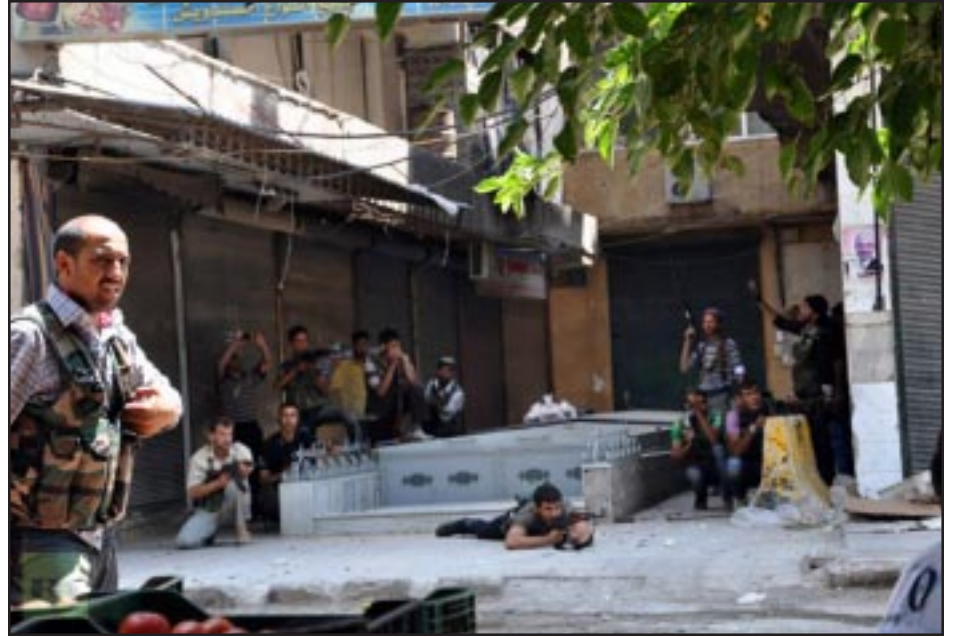
Anti-Government fighters in Aleppo's Armenian District

ALEPPO -- Two ethnic Armenians have been killed in Syria's Damascus and Aleppo during the recent days as a result of clashes between Syria's governmental forces and rebels.