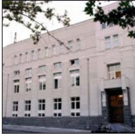
The Central Bank of Armenia