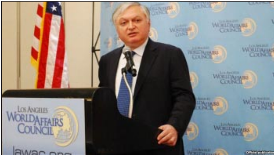
Foreign Minister Edward Nalbandian addressing Los Angeles World Affairs Council

LOS ANGELES -- On September 24 Armenian Foreign Minister Edward Nalbandian delivered a speech on Armenia's foreign policy at the Los Angeles World Affairs Council. The event was attended by diplomats accredited in Los Angeles, political scientists, representatives of the Department of State, journalists.