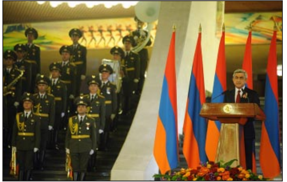
Սերժ Սարգսեան ելոյթ կ'ունենայ Հայաստանի անկախութեան տօնին առթիւ

Կարէն Դեմիրճեանի անուան մարզահամերգային համալիրում Սեպտեմբեր 21-ին տեղի ունեցաւ տօնական ընդունելութիւն՝ Հայաստանի անկախութեան հռչակման 21-րդ տարեդարձի առթիւ: