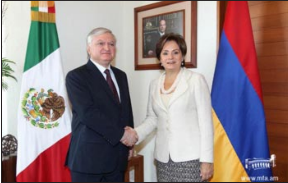
Edward Nalbandian greeted by Patricia Espinosa

MEXICO CITY -- On a visit to Mexico on Monday Foreign Minister Edward Nalbandian voiced his concern over adoption of distorting resolutions by Mexican parliament over Nagorno Karabakh.