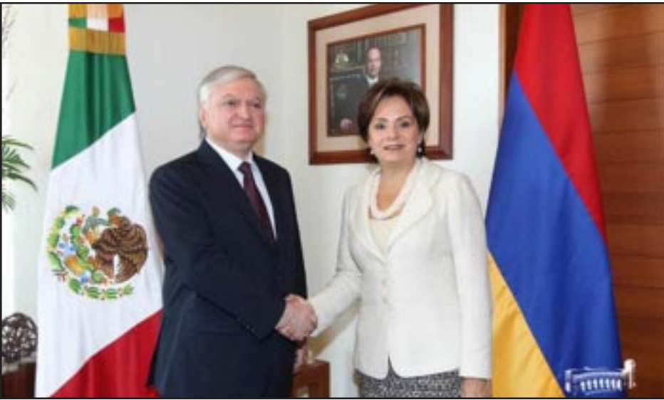
Էդուարդ Նալբանդեան եւ Պատրիսիա Էսպինոսա Մեքսիկայի մէջ կայացած հանդիպումի ընթացքին

Հոկտեմբերի 22-ին Մեքսիկա այցելութեամբ մեկնարկեց արտգործնախարար Էդուարդ Նալբանդեանի այցը լատինամերիկեան երկրներ: