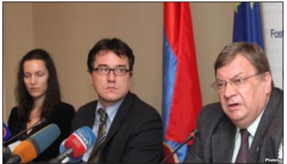
Դեսպաններ՝ Անտրէյ Սորոկին եւ Տրայըն Հրիսթիան Երեւանի մէջ կայացած մամուլայ ասուլիսի ընթացքին

ԵԱՀԿ երեւանեան գրասենեակի ղեկավար, դեսպան Անտրէյ Սորոկին եւ Եւրոպայի Միութեան հայաստանեան պատուիրակութեան ղեկավար, դեսպան Տրայըն Հրիսթիան Երեւանի մէջ կայացած մամուլայ ասուլիսի մը ընթացքին յայտարարեցին, որ Հայաստան-ԵՄ հետագայ համագործակցութիւնը կախուած կ'ըլլայ, թէ ինչպէս կը կազմակերպուին 2013-ի նախագահական ընտրութիւնները: