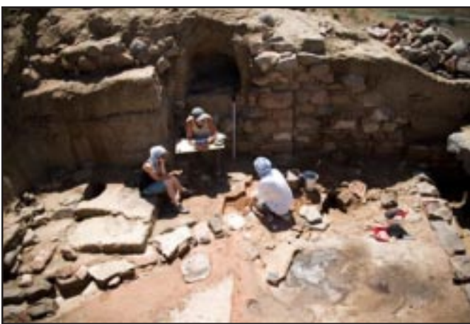
Massis excavation site