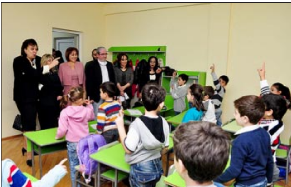
Diaspora Minister Hranush Hakobian visiting with Guiligian school students

YEREVAN -- Armenia's Minister of Diaspora Hranush Hakobian visited on Monday the Guiligian school, which was opened for Syrian-Armenian children about three weeks ago.