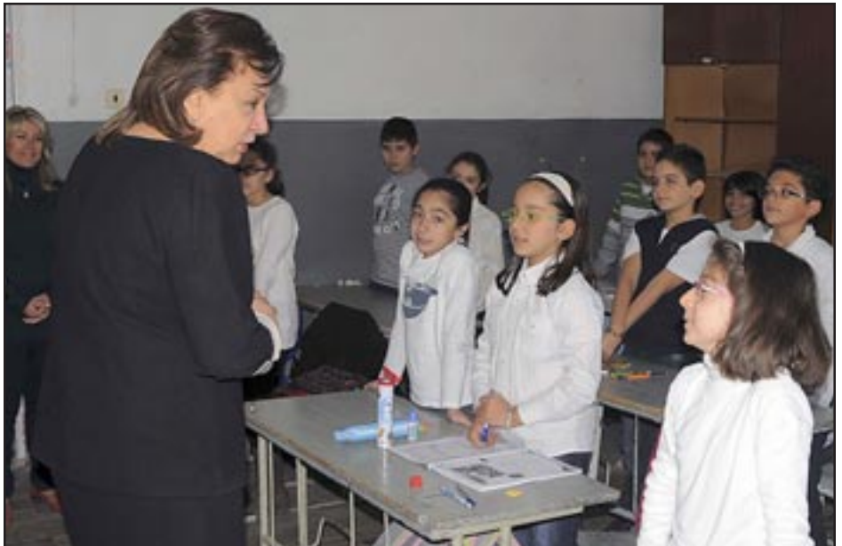
Սփիւռքի նախարար Հրանոյշ Յակոբեան Երեւանի «Կիրիկեան» դպրոց այցելութեան ընթացքին

ՀՀ Սփիւռքի նախարար Հրանոյշ Յակոբեանն այցելած է շուրջ 3 շաբաթ առաջ Հայաստանում բացուած եւ սիրիական կրթական ծրագրով դասաւանդուող «Կիրիկեան» դպրոց, այս մասին տեղեկացնում են Սփիւռքի նախարարութիւնից: