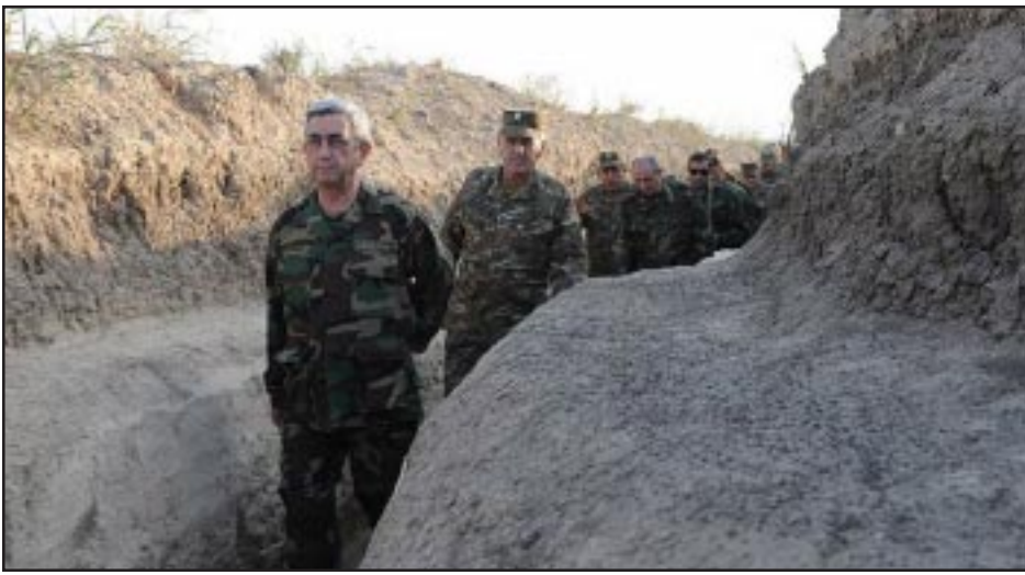
Presidents Sarkisian and Sahakian inspecting Karabakh frontlines

STEPANAKERT -- President Serzh Sarkisian visited Armenian front-line positions near Nagorno-Karabakh and discussed the tense situation along the Armenian-Azerbaijani "line of contact" with the NKR's top military commanders on Monday. Sarkisian was accompanied by Karabakh president Bako Sahakian and Defense Minister Seyran Ohanian.