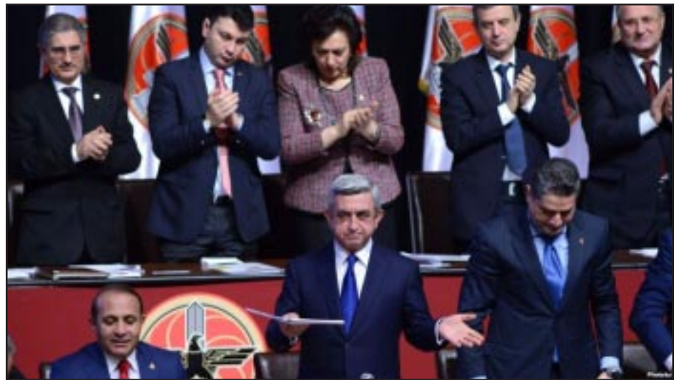
Սերժ Սարգսեան ՀՀ4 համագումարի ընթացքին

Հայաստանի իշխող Հանրապետական կուսակցութիւնը Դեկտեմբեր 15-ին կայացած իր 14-րդ համագումարի ընթացքին, միաձայն նախագահի թեկնածու առաջադրեց երկրի գործող նախագահ եւ Կուսակցութեան նախագահ Սերժ Սարգսեանին: