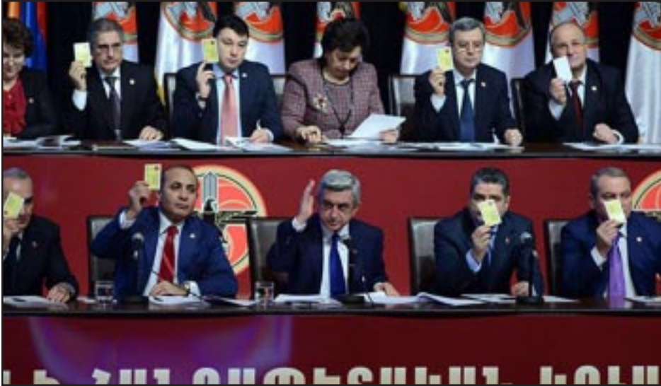
Republican Party leadership nominating Serzh Sarkisian for president

YEREVAN -- President Serzh Sarkisian has been unanimously nominated as a candidate for reelection by his ruling Republican Party of Armenia that held its 14th convention in Yerevan on Saturday. Presidential elections of the Republic of Armenia will take place on February 18, 2013.