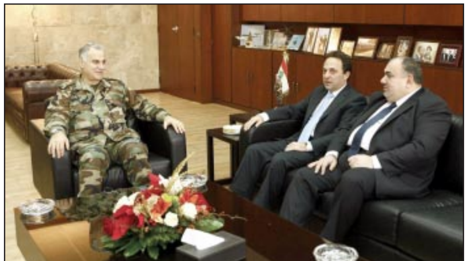
Զօրավար Ժամ Քահուաժի, Երեսփոխաններ Սերժ Թուրսարգիսեան եւ Սեպուհ Գալիֆաբեան

Սոցիալ Դեմոկրատ Հնչակեան Կուսակցութեան պետական երեսփոխաններ Ընկ. Սեպուհ Գալիֆաբեան եւ Սերժ Թուրսարգիսեան այցելեցին Լիբանանեան Բանակի ընդհանուր հրամանատար զօրավար Ժամ Քահուաժիին, որուն հետ քննարկեցին երկրի ապահովական ընդհանուր կացութիւնը եւ տարբեր շրջաններու անվտանգութիւնը ապահովելու գծով՝ զինուորական հաստատութեան դերակատարութիւնը: