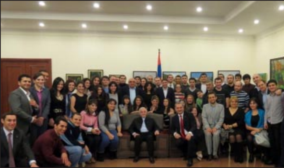
Շառլ Ագնալուրի հանդիպումը Պեկինի հայութեան հետ

Չինաստանում Հայաստանի Հանրապետության դեսպանությունում Դեկտեմբերի 13-ին կազմակերպուել է ֆրանկոֆոնիայի շրջանակներում կայացած Չինաստանում ֆրանսերէն լեզուի տարուայ փակման առիթով Պեկինի ժամանած Հայագրի մեծանուն երգիչ Շառլ Ագնալուրի հանդիպումը Պեկինում բնակվող հայութեան հետ, տեղեկացնում են Արտգործնախարարությունից: