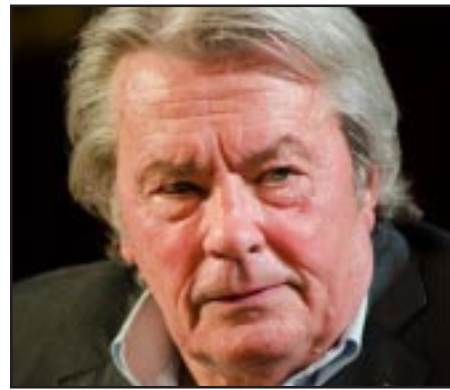
Ֆրանսացի նշանաւոր դերասան Ալէն Դելոն

Ֆրանսիացի անուանի դերասանը շնորհակալութիւն է յայտնել ՀՀ նախագահին՝ ջերմ խօսքերի եւ