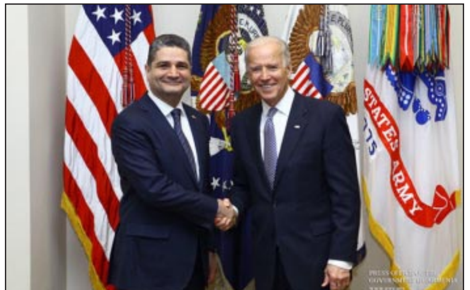
Prime Minister Tigran Sarkisian and Vice President Joe Biden at the White House

WASHINGTON, DC -- Prime Minister Tigran Sarkisian discussed his reform agenda with Vice President Joe Biden and sought greater U.S. economic assistance to Armenia as he ended a working visit to the United States late on Thursday.