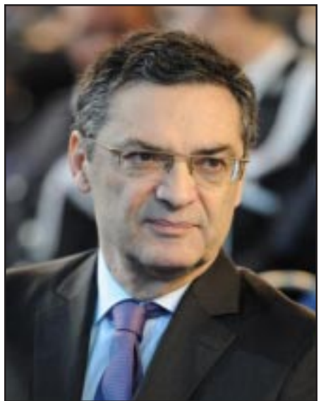
էր ձայներու 52,65%ը: (ՆՈՐ ՅԱՌԱՋ)

Դեկտեմբեր 16ին Ֆրանսայի երեսփոխանական մասնակի ընտրութիւններու Բ. շրջանին, Փաթրիք Տէվէճեան հաստատեց Դեկտեմբեր 9ի առաջին շրջանի իր յաջողութիւնը (49,8%) եւ ի տարբերութիւն Յունիսի սեղմ յաղթանակին (191 ձայնի տարբերութեամբ, որ ջնջուեցաւ, այս անգամ լայնօրէն պարտութեան մատնեց Արմատական կեդրոն շարժումի իր մրցակիցը) Ժիւլիէն Լանտֆրիտը ձայներու 60,04%-ով: Այսպէսով, Տէվէճեան, Հօ-տը-Սէն նահանգի 13րդ ընտրաշրջանէն կը վերընտրուի երեսփոխան: Այս ընտրաշրջանին մէջ քուէարկողներու տոկոսը կազմած է միայն 36,05%. նախագահական ընտրութիւններուն, Հոլանտ հոս ստացած