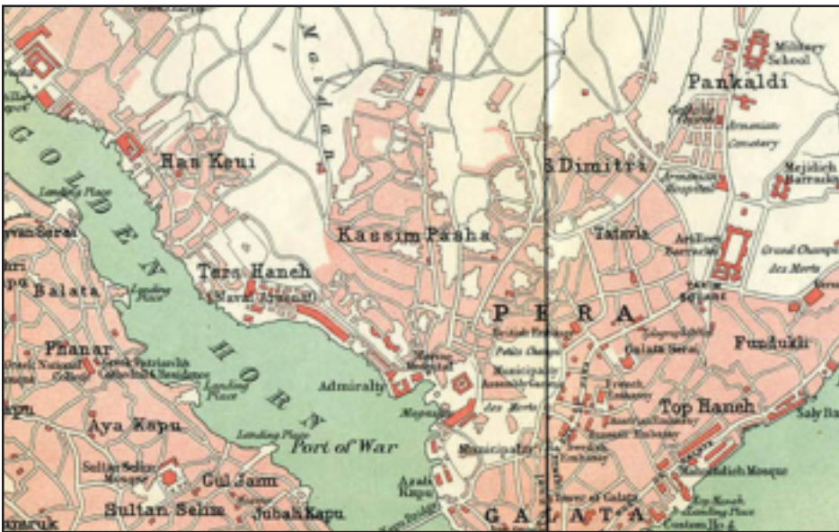
Illustration: from "Black's Guide: A Guide to Constantinople," by Demetrius Coufopoulos

Taksim Square, like Tahrir Square and Zuccotti Park before it, is just another space in a city: it could have been one more spot to meet friends, or to read a book under a tree. But Turkey's Prime Minister, Recep Tayyip Erdogan, decided he'd like to replicate the Ottoman-era Taksim military barracks on the site, and build it into a shopping mall and a mosque. In late May, several dozen environmentalists began protesting Erdogan's designs in Gezi Park, the island of trees within the Square, and were attacked by Turkish police with tear gas and water cannons. Soon, as Elif Batuman wrote, "only fifteen per cent were protesting the destruction of trees, while forty-nine per cent were protesting police violence against the kinds of people who were protesting the destruction of the trees." Since then, nearly eight thousand protesters have been injured. By now, the protest has broadened into an objection to Erdogan's religious agenda and authoritarian rule. Today, "Taksim Square" is no longer just a tangle of people and plazas but a byword for a clash of ideas, a movement, a battleground.