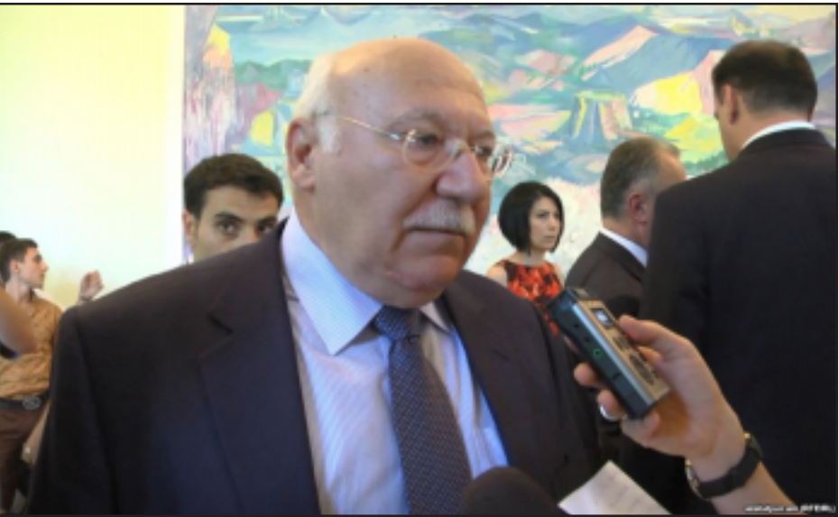
Կիպրոսի գլխավոր դատախազ Պետրոս Կլէրիդիս Երեւանի մէջ

Կիպրոսի գլխավոր դատա- խազ Պետրոս Կլէրիդիս Երեւան կատարած այցի ընթացքին, Հա- յաստանի գլխավոր դատախազ Ադ- ուան Յովսէփեանի ձեռքով անոր յանձնած է «օֆշորային» հաշիւնե- րու թղթածրարը: