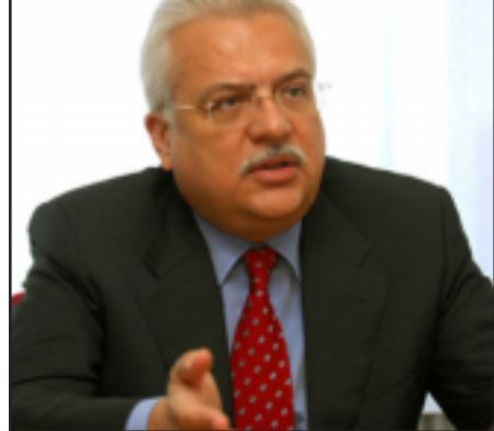
Հունգարիոյ Սահմանադրական Դատարանի նախագահ Պետր Պաշտայ

լու հարցը: Սակայն, ան շեշտեց, որ փաստը կը մնայ այն, որ Սաֆարով սպաննած է իր հայ գործընկերոջը եւ ուստի այդ պարագային նպա- տակայարմար չէ քննարկել անոր դէմ կայացուած որոշման խիստ ըլլալու հարցը: