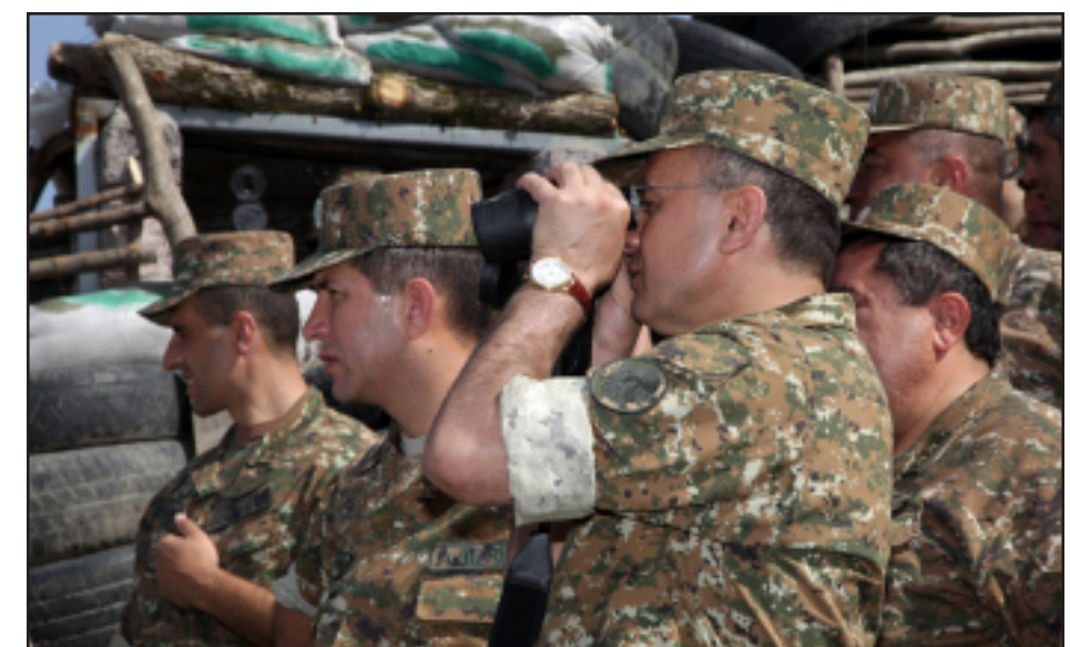
ՀՀ պաշտպանութեան նախարար Սէյրան Օհանեան կ'այցելէ հայկական դիրքերէն մէկը

ՀՀ պաշտպանութեան նախարար Սէյրան Օհանեանը մասնակցում էր Հայաստանի ռազմաօդային ուժերի հակաօդային պաշտպանութեան ռադիոէլեկտրոնային պայքարի ստորաբաժանումների ստեղծման 21-ամեակի կապակցութեամբ «Էրեբունի» օդանավակայանում անցկացուած տօնական միջոցառմանը, որի ընթացքում, բացի հանդիսաւոր քայլերից, եղան նաեւ ցուցադրական թռիչքներ: