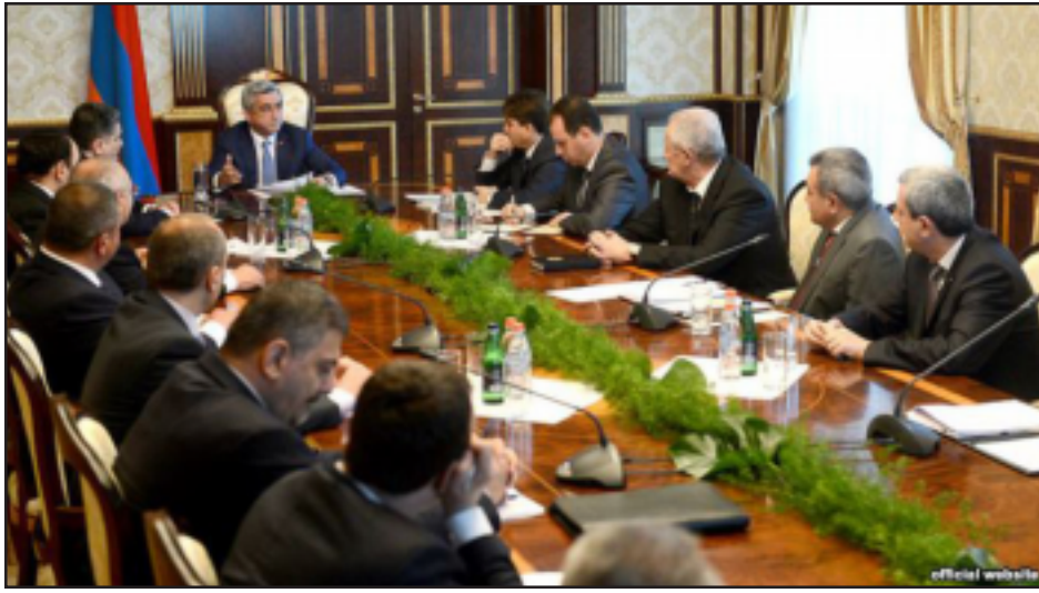
Սերժ ՍԱՐԳՍԵԱՆԻ կը գլխաւորէ խումբ մը բարձրաստիճան պաշտօնեաներու հետ ժողովը

Նախագահ Սերժ Սարգսեանի մօտ Յունիս 29-ին տեղի է ունեցել քննարկում բուժնոստրի միջոցների արդիւնաւէտ կառավարման, իրականացուող պետական ծրագրերի հանդէպ վերահսկողութեան ուսերգացման եւ կոռուպցիոն ռիսկերի նուազեցմանը միտուած հարցերի շուրջ: Սերժ Սարգսեանը որոշակի դիտարկումներ է ներկայացրել կառավարութեան ղեկավարին, գլխաւոր դատախազին եւ վերահսկիչ պալատի նախագահին: