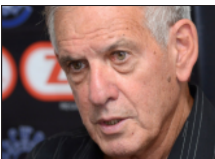
Իսրայէլացի պատմաբան եւ ցեղասպանագէտ Եաիր Էուրան

Հրեայ մտաւորականներէն շատերը միշտ կանգնած են հայ ժողովուրդի կողքին, կարեկից եղած են հայերու ցաւին եւ ողբերգութեան, հետաքրքրուած են մեր ժողովուրդի խնդիրներով: Այս մասին, Յուլիս 17-ին, Երեւանի մէջ յայտարարած է Հայաստանի նախագահ Սերժ Սարգսեան, իսրայէլացի պատմաբան եւ ցեղասպանագէտ Եաիր Էուրոնի հետ հանդիպման ժամանակ: