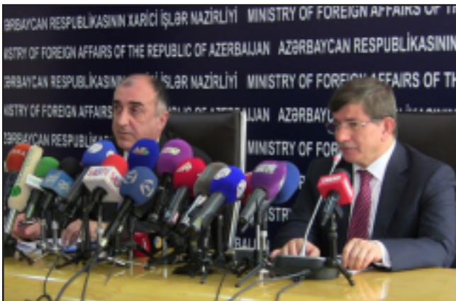
Ահմեթ Դավութօղլու եւ էլմար Մամեդբարովի մամլոյ ասուլիսի ժամանակ

Թուրքիոյ արտաքին գործոց նախարար Ահմեթ Դավութօղլու, Յուլիսի 17-ին ատրպէյճանցի իր պաշտօնակից էլմար Մամեդբարովի հետ միասնեղ մամլոյ ասուլիսի ժամանակ մասնաւորապէս յայտարարած է թէ, Թուրքիա միշտ սատարած է ու կը սատարէ Ատրպէյճանին եւ պատրաստ է նպաստելու Լեռնային Ղարաբաղի հակամարտութեան խաղաղ լուծման: