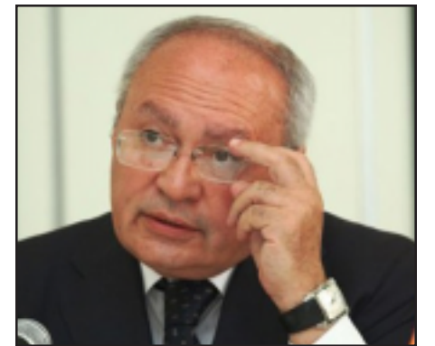
Հայաստանի գլխաւոր դատախազ Աղուան Յովսէփեան

Թուրքիոյ Արտաքին Գործոց Նախարարութիւնը հանդէս եկած է պաշտօնակալ յայտարարութեամբ մը, դատապարտելով Հայաստանի գլխաւոր դատախազ Աղուան Յովսէփեանի՝ Հայ Իրաւաբաններու Միջազգային Համաժողովի ընթաց-