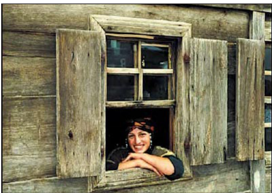
«Մողեռն» փոխակերպում՝ ուծացում

Այսօր Խոպայում եւ Քեմալփաշայում կան բազում համշենական գիւղեր. Բաշոբա/Ղիզոբա, Յուրդերէ/Ժիւրփիլի, Չառուշու/Չառուշին, Քոնիշուր/Չալուսնա, էշմաքայա/Արդալա, Գիւնեշլի/Ծաղիցա, Բալըքլը/Չենդիթ, Հենդեք/Գարձ, Փրնարլը/Անչուրող, Քայա Քեօիւ/Ղալվաշի, Չամուրլը/Չանչաղան, Շանա, Ուշքարդէշ, Քիւփրիլի, Օսմանիլի, Քարասմանիլի/Ղեցեղան, Աքդերէ/Չիլիլեքեթ, Քազիմիլի/Վէյի Սարփ: Թէեւ համշենական բոլոր գիւղերում միմեանց ազգակից ընտանիքներ/տոհմեր են ապրում, ենթադրում է, թէ Բաշոբա, Արդալա եւ Հենդեք գիւղերն իրար հետ ազգակցական կապ չունեցող ընտանիքներից է բաղկացած, հետեւաբար՝ յիշեալ գիւղերի բնակեցման գործընթացները եւս տարբեր ժամանակներում են եղել: Միայն Ուշքարդէշում եւ Քիւփրիլիում են համշենցիները լազերի եւ ռիզեցիների հետ միասին բնակում: Ազգակցական յարաբերութիւնների շուրջ մեր կողմից կատարուած ուսումնասիրութեան շնորհիւ պարզ է դառնում, որ Քեմալփաշայում ապրող համշենցիները Խոպայից են այդ կողմեր գնացել: Այսինքն՝ համշենցիները նախապէս Խոպայի գիւղերում բնակութիւն հաստատելուց որոշ ժամանակ անց են սկսել Քեմալփաշայում ապրել: Հասկացում է, որ այդ բնակեցումը մեկնարկել է գիւղատնտեսութեան եւ անասնապահութեան տեսանկիւնից աւելի ձեռնառու եղող Քեմալփաշայի հողատարածքներում գիւղատնտեսութեամբ կամ էլ հողի վարձակալութեամբ զբաղուող համշենցիների՝ հետագայում այդ տարածքները տէրերից գնելու միջոցով: Քեմալփաշայի գիւղերում ապրող տոհմերի մի մասը Խոպայում է, եւ այդ հատուածի ներկայացուցիչներն ասում են, թէ իրենց «մայր օճախը» Խոպայի գիւղերն են: