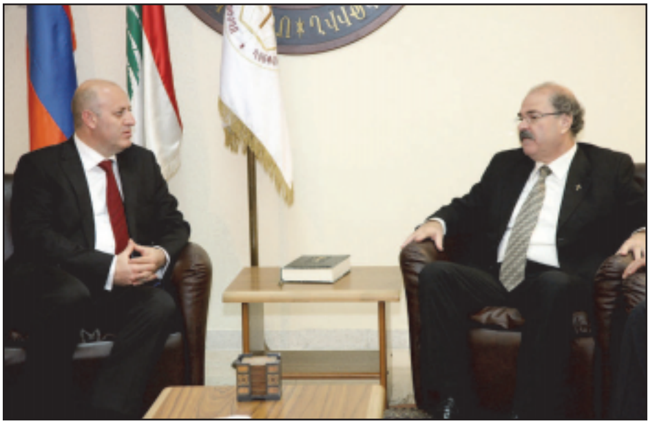
Շարունակուած էջ 1-էն

Կուսակցութեան պատուիրակութիւնը հոգեւոր պետերուն ներկայացուց Հայաստանի մէջ կացած ՄԴՅԿ Ընդհանուր համագործակցութեան անդամները: Հանդիպումներուն ընթացքին քննարկուեցան գլխաւոր երեք նիւթերը՝ Յեղասպանութեան 100 ամեակի ոգեկոչումը, Հայաստանի իրավիճակը եւ սուրիահայութեան խնդիրները: Կուսակցութեան պատուիրակութիւնը շեշտեց Մեծ Եղեռնի յիշատակի ոգեկոչման ձեռնարկները կազմակերպուած միջոցներով մշակելու եւ համագործակցութեան վրայ հիմնուելու կարեւորութիւնը՝ հասնելու համար ցանկալի արդիւնքներու: