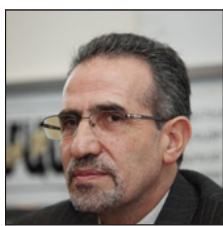
Հայաստանում Իրանի դեսպան Մոհամադ Ռեիսի

Անդրադառնալով Իրանական լրատեսների վերաբերեալ աղբբեջանական կողմի մեղադրանքներին, Մոհամադ Ռեիսին նշել է, որ