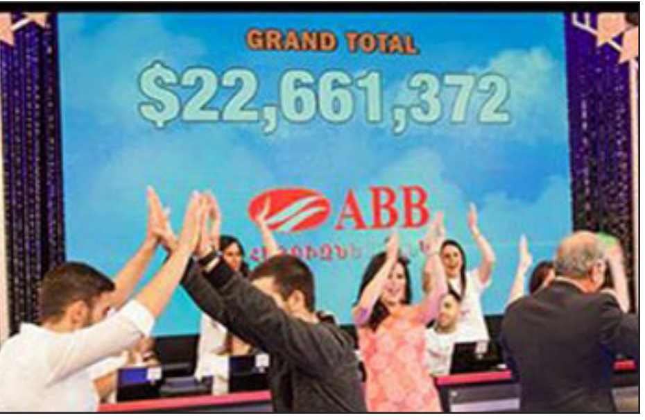
Թելեթոնի արարտին կը յայտարարուի հանգանակուած գումարը

Նոյեմբեր 28-ին՝ Միացեալ Նահանգներու Գոհաբանութեան Օրոտայ առթիւ տեղի ունեցաւ «Հայաստան» համահայկական հիմնադրամի 16-րդ թելեթոնը, որու ընթացքին հանգանակուեցաւ 22 միլիոն 661 հազար 372 Ամերիկեան Տոլար: