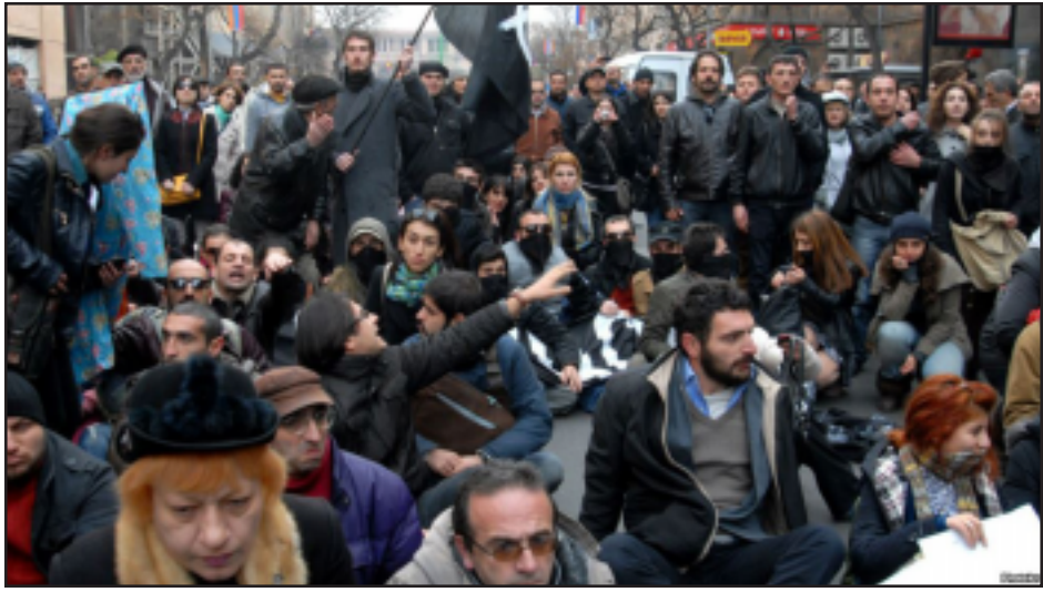
Տեսարան՝ Ռուսաստանի մախաբահի Հայաստան կատարած այցի առթիւ տեղի ունեցած ցոյցէն

Ռուսաստանի նախագահի Հայաստան կատարած այցից առաջ, այցի ընթացքում եւ այցից չետոյ ոստիկանութիւնում յայտնուած բոլոր 110 անձինք ազատ են արձակուել: