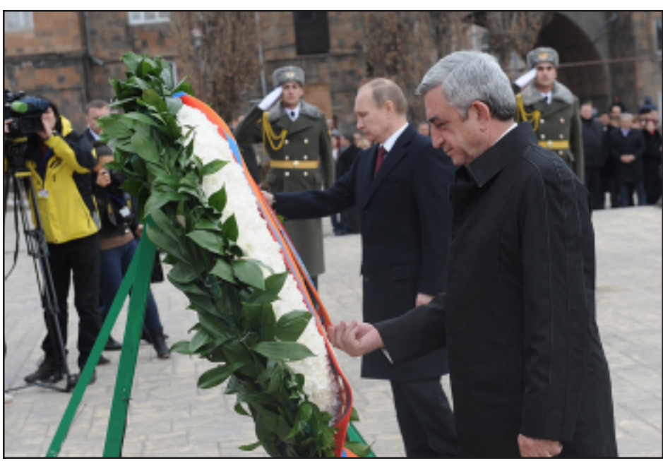
Ռուսաստանի եւ Հայաստանի նախագահները ծաղկեպսակ կը դնեն Հայոց Ցեղասպանութեան զգոհերու յուշարձանին

«Անցել է ընդամէնը երեք ամիս Մաքսային Միութիւն մտնելու Հայաստանի մտադրութեան մասին յայտարարութեան պահից, սակայն արդէն կատարուած է հսկայական աշխատանք: Ընդունուած է Եւրասիական տնտեսական բարձրագոյն խորհրդի համապատասխան որոշումը: Ստորագրուած է Հայաստանի Հանրապետութեան կառավարութեան եւ Եւրասիական Տնտեսական Յանձնաժողովի միջեւ յուշագիր: Ստեղծուած են քառերկու աշխատանքային խմբեր,