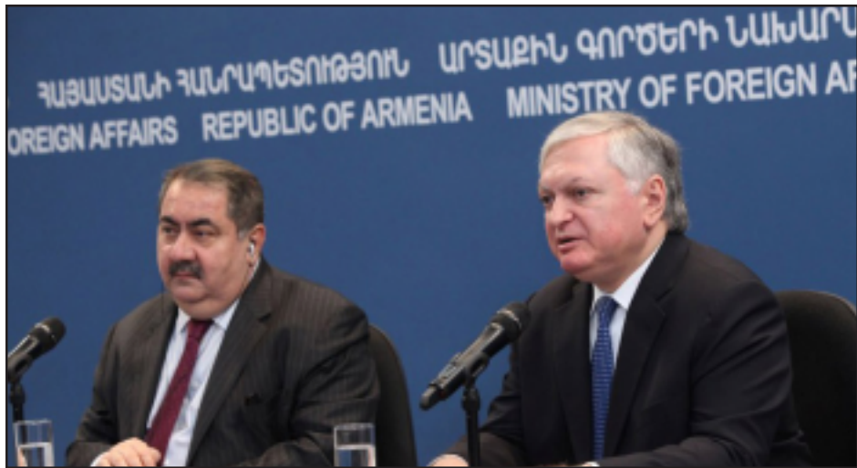
Իրաքի և Հայաստանի արտաքին գործոց նախարարները միատեղ մալոյ ասուլիսի ընթացքին

Իրաքի արտգործնախարարի այցը նոր լիցք կը հաղորդի տարբեր բնագավառներում երկկողմ համագործակցության կարգապահմանը: Այս մասին, Դեկտեմբերի 3-ին, պաշտօնական այցով Երևանում գտնուող Իրաքի արտգործնախարար Հոշիար Ջեբարիի հետ հանդիպման ժամանակ նշեց Հայաստանի ԱԳ նախարար Էդուարդ Նալբանդեանը: