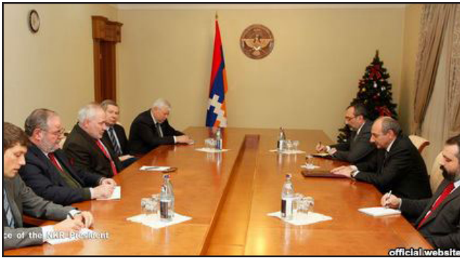
Արցախի Հանրապետության նախագահ Բակո Սահակեանի հանդիպումը ԵԱՀԿ Մինսկի խմբի համանախագահներուն հետ

Արցախի Հանրապետության նախագահ Բակո Սահակեանը Դեկտեմբերի 17-ին ընդունել է ԵԱՀԿ Մինսկի խմբի համանախագահներ Իգոր Պոպովին (ՌԴ), Ժակ Ֆորին (Ֆրանսիա), Ջեյմս Ուորլիքին (ԱՄՆ) եւ նրանց ուղեկցող անձանց: