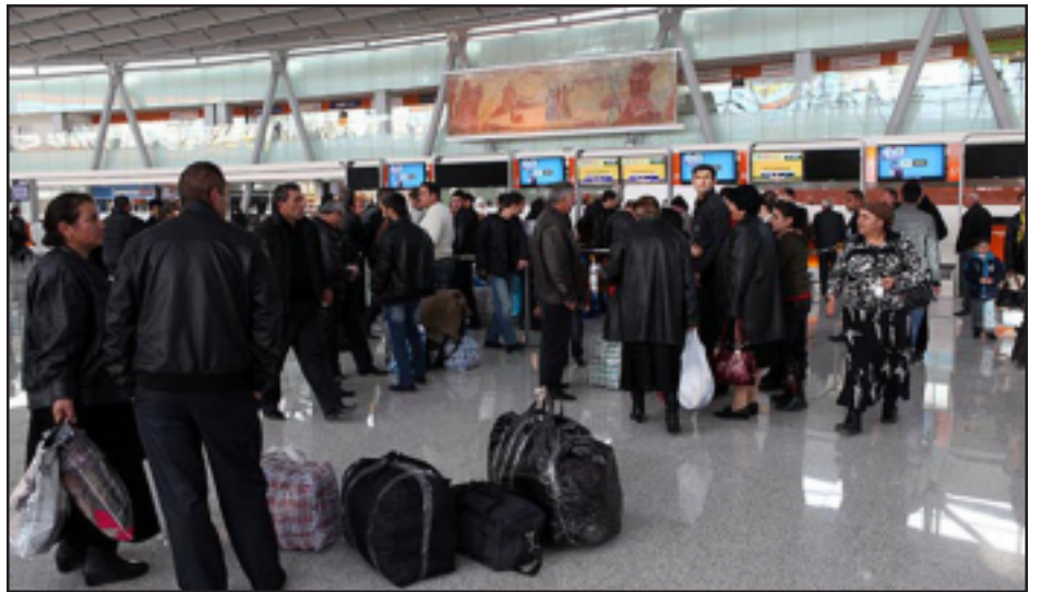
«Զուարթնոց» օդակայանէն հայեր կը մեկնին դէպի Ռուսաստան եւ այլուր