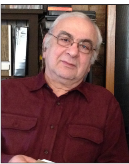
տադրում իր «դաշնակցին», դա մտածելու տեղիք է տալիս:

ՀՀ իշխանությունների մօտեցումը անդունդի եզրին հասած մարդու վերաբերմունք է, սակայն մարդու, ով 15 տարի է՝ մերժում էր, որ քայլում է դէպի անդունդ կամ որ նոյնիսկ չէր ընդունում, թէ անդունդ կար մի քանի քայլ անդին: Այդ բոլորը գործող նախագահն անում է իշխանութիւնը պահելու եւ ոչ թէ որեւէ հարց լուծելու համար, իսկ Ռուսաստանի համար սա պետական քաղաքականութեան հարց է: Ռուսաստանի պարտադրած դաժան պայմանները, հարաւոր է, բխում են իր շահերից: Սակայն եթէ իր շահերի պատճառով նա նման պայմաններ է պար-