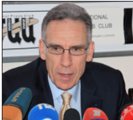
Ֆրանսայի արտակարգ եւ լիազօր դեսպան Անրի Ռէնօ

Նկատի առնելով վերջին զարգացումները՝ Եւրոպական Միութիւնը եւ Հայաստանը որոշած են վերանայիլ իրենց միջեւ համագործակցութեան հիմքերը: Այս մասին յայտարարած է Հայաստանի մօտ Ֆրանսայի արտակարգ եւ լիազօր դեսպան Անրի Ռէնօ, փետրուար 11-ին «Հայաստանի ձանապարհը Դէպի Եւրոպա. Խոչընդոտներ եւ Հնարաւորութիւններ» թեմայով քննարկման ժամանակ: