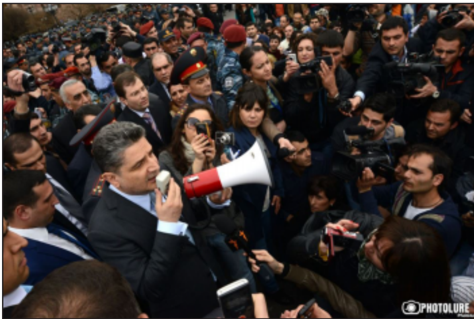
Հայաստանի հրաժարեալ Վարչապետ՝ Տիգրան Սարգսեան երկխօսութեան կոչ կ'ընէ ցուցարարներուն

Հանրապետութեան հրապարակում շուրջ երկու ժամ նստացոյց անցկացնող «Դէմ եմ» շարժման ակտիւիստներին հետ Ապրիլ 9-ին հանդիպեց հրաժարական տուած վարչապետ Տիգրան Սարգսեանը: