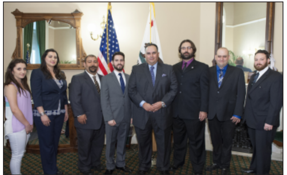
ACA representatives with Speaker of the State Assembly John Perez

SACRAMENTO, CA – On April 7, a delegation of over 100 members from the Armenian Council of America participated in a day of advocacy to gain support for Assembly Joint Resolution 32 during the annual Armenian Genocide Commemoration sponsored by the California State Senate and Assembly at the State Capitol.