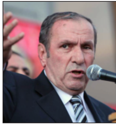
ՀՀ նախկին նախագահ Լեւոն Տէր-Պետրոսեան

«Իմ տպաւորութեամբ, ընդդիմութիւնը դեռեւս մինչեւ վերջ չի գիտակցել, որ ընդամէնը շուրջ օրեալ հանրահաւաքների սպառնալիքի միջոցով համեմատ վարչապետի հրաժարականին, արդէն իսկ մեծ յաղթանակ է տարել, իսկ