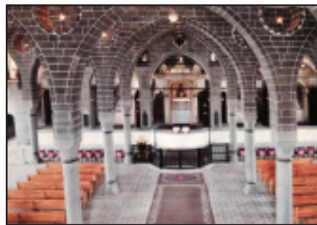
St. Giragos Church before and after renovation

NEW MILFORD, NJ - Dikranagerdtsis present a benefit evening to raise funds for the restoration efforts of the St. Giragos Church in Dikranagerd, Turkey on Saturday evening, May 17 at the Hovnanian Banquet Hall in New Milford, New Jersey.