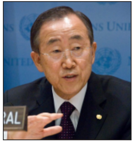
ՄԱԿ-ի գլխաւոր քարտուղար Բան Կի Մուըր

Բան Կի Մուըր մտահոգիչ է համարել Սիրիայում շարունակուող հակամարտութեան ընթացքում վայրագութիւնների վերաբերեալ հաղորդագրութիւնները եւ զգուշացրել է հակամարտող կողմերին եւ նրանց աջակիցներին պաշտպանել: