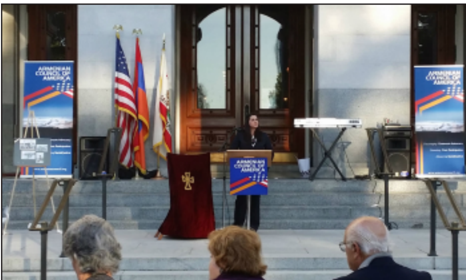
Armenian Genocide vigil at the California State Capital

SACRAMENTO, CA – The Armenian Council of America, in partnership with the Armenian-American community of Sacramento, organized an informative and empowering evening vigil, commemorating the 99th anniversary of the Armenian Genocide at the California State Capital on Sunday, April 6.