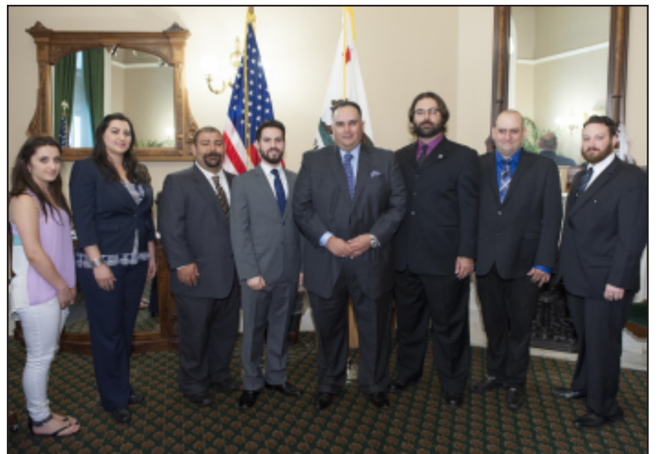
ՀԱԽ-ի ներկայացուցիչները Գալիֆորնիոյ Խորհրդարանի խօսակա Ջօ Փերեզի հետ հանդիպումի ընթացքին

Երեկոյթի առաջին խօսք առնողն էր ՀԱԽ-ի անդամներէն Գրիգոր Մոլոյեան: Ան հակիրճ ակնարկ մը նետելէ ետք մեծ Եղեռնի տուն տուող պատճառներուն եւ անոր սարսափելի հետեւանքներուն, անդրադարձաւ Լեռնային Ղարաբաղի