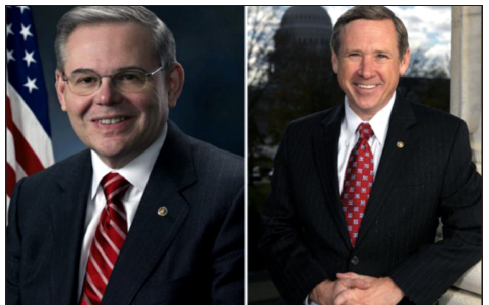
Senator S Robert Menendez (D-NJ) and Mark Kirk (R-IL)

WASHINGTON, D.C. – Senator Robert Menendez (D-NJ), a long-time champion of Armenian issues and powerful voice for justice, along with Senator Mark Kirk (R-IL), who previously served as Co-Chair of the Armenian Caucus during his tenure in the House of Representatives (House), introduced a new Armenian Genocide resolution