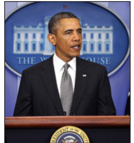
President Barack Obama

I have consistently stated my own view of what occurred in 1915, and my view has not changed. A full, frank, and just acknowledgement of the facts is in all of our interests. Peoples and nations grow stronger, and build a foundation for a more just and tolerant future, by acknowledging and reckoning with painful elements of the past. We continue to learn this lesson in the United States, as we