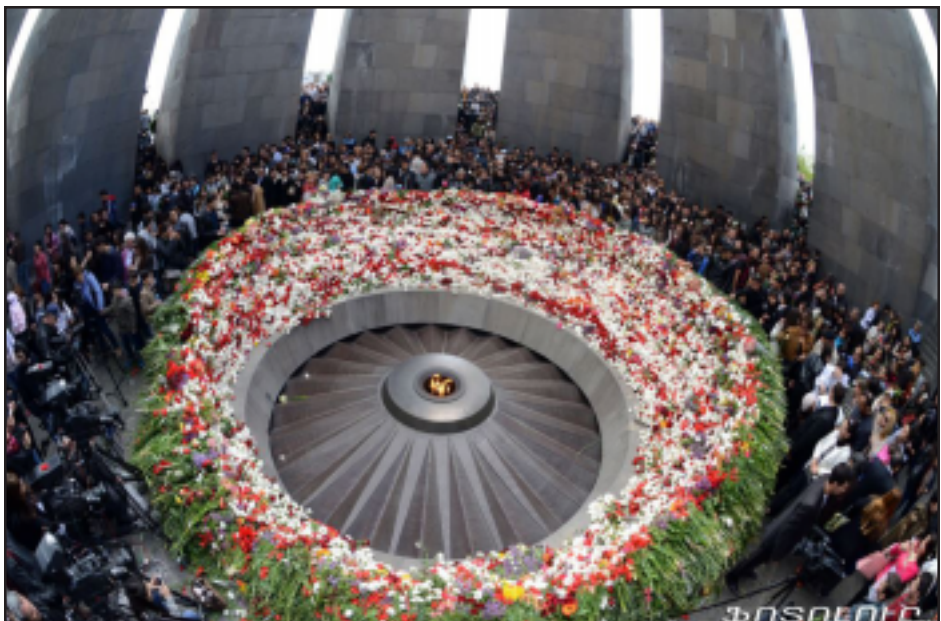
Միջնորդակաբերդի եղեռնի Յուշահամալիր անդրի

Հայաստանի նախագահ Սերժ Սարգսեան յիշեցուց Թուրքիոյ,