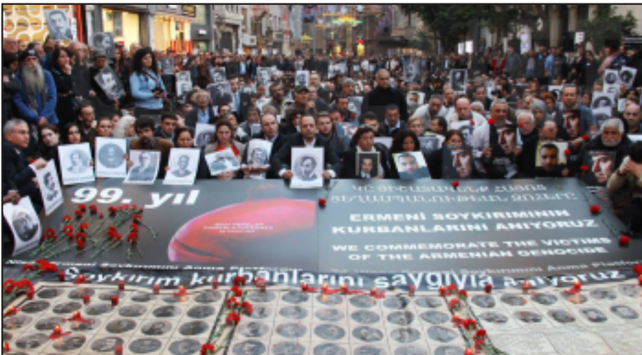
Տեսարան մը Պոլսոյ միջոցառումն

Ապրիլ 23-ին Հազարաւոր Լիբանանահայեր միասնական շարքերով քայլեց դէպի կեդրոնական Պէյրութի Նահատակաց հրապարակ, որ ինքնին ականատեսն է ցեղասպան