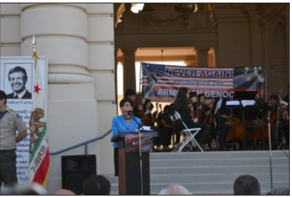
Տեսարան մը Փաստիւնայի հանդիսութենէն

որ մենք Հայոց ցեղասպանութեան 100-րդ շնորհն ենք եւ այս ապաշխարելու եւ պատմութեան խարանը մէկ կողմ դնելու հնարաւորութիւն կրնայ ըլլալ Թուրքիոյ համար, եթէ հարեւան երկիրը կարողանայ ուժ գտնել եւ ազատել իրենց պետութեան ապագան՝ այս ծանր բեռէն: