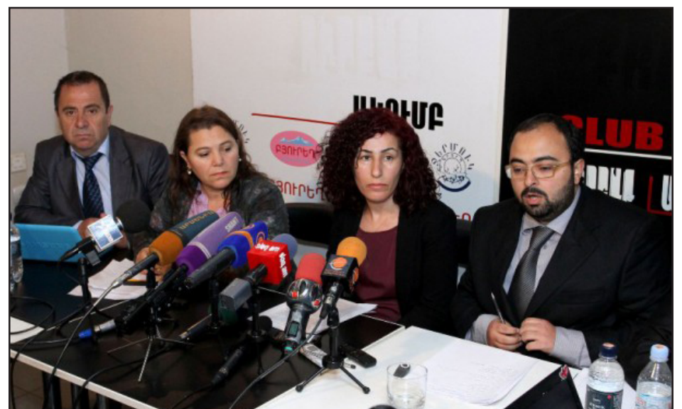
ABDEM members hold press conference in Yerevan

YEREVAN (Alisa Gevorgyan, Public Radio of Armenia) -- Members of the European Peace and Democracy Assembly (Avrupa Baris ve Demokrasi Meclisi -- ABDEM) have visited the Tsitsernakabert Memorial on April 24 to pay tribute to the memory of the Armenian Genocide victims.