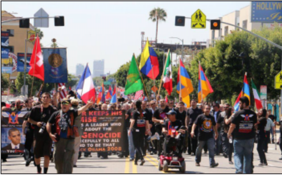
Տեսարան մը Հոլիվուտի ցայց