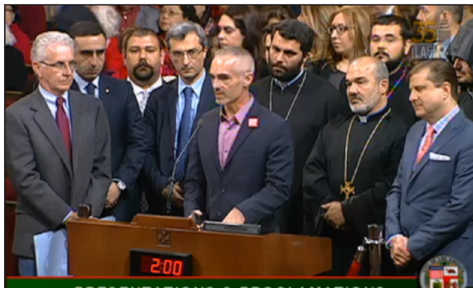
Councilmember Mitch O'Farrell addressing the Los Angeles City Council

LOS ANGELES, CA -- In commemoration of the 99th anniversary of the Armenian Genocide, the Armenian Council of America joined about 40 members from various Armenian political, cultural and religious organizations for the annual City of Los Angeles Armenian Genocide commemoration at the City Council chambers in City Hall.