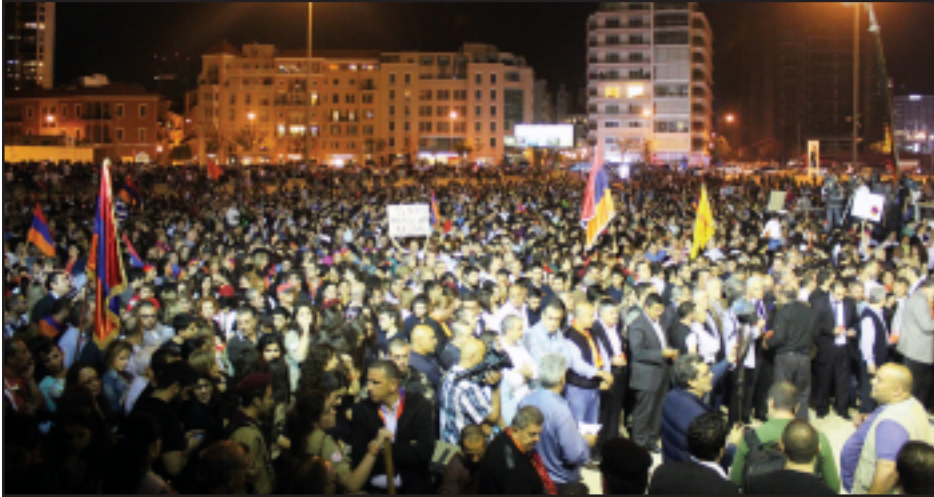
Տեսարան մը Պէյրութի Նահատակաց հրապարակի միջոցառումն

Թուրքիոյ չարիքներուն: Երեխաներ, պատանիներ, երիտասարդներ, կիներ, տղամարդիկ ու երէցներ հայհոյ շրջաններէն մոմերով ուղղուեցան Պէյրութի Նահատակաց հրապարակ, ուր տեղի ունեցաւ հառաք` կազմակերպութեամբ Հայոց Ցեղասպանութեան 100 ամեակի Լիբանանի Երիտա- սարդական Մարմինին: Երիտասարդական Մարմինին անունով արաբերէնով խօսք առաւ